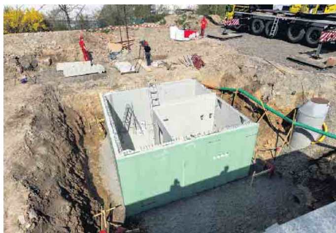
6,50 mal 6,50 Meter Baugrube reichen für einen kompakten Teilkeller meist schon aus.

können Hauslebauer mit einem effizient geplanten Teilkeller 50 Prozent der Kosten für eine Vollunterkellerung sparen, ohne ganz auf die Vorzüge eines Kellers verzichten zu müssen. Heizungsanlage, Sicherungskasten, Warmwasserspeicher, Automations- und Lüftungssystem - diese und weitere technische Anlagen im Haus nehmen heute schnell zehn Quadratmeter und mehr ein. Das ist Fläche, die vor