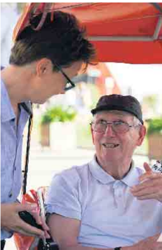
Senioren-Assistenten sind Ansprechpartner und qualifizierte Begleiter durch den Alltag älterer Menschen.

Senioren-Assistenten verhelfen älteren Menschen zu einem erfüllteren Leben