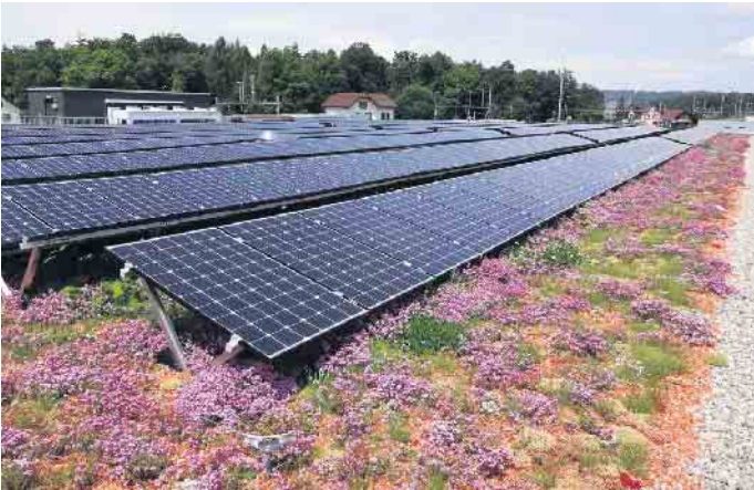
Solare Technik und eine Dachbegrünung: Diese Kombination ist gleichermaßen ökologisch als auch wirtschaftlich sinnvoll.

Mit einer Begrünung oder Solartechnik mehr aus der Fläche machen