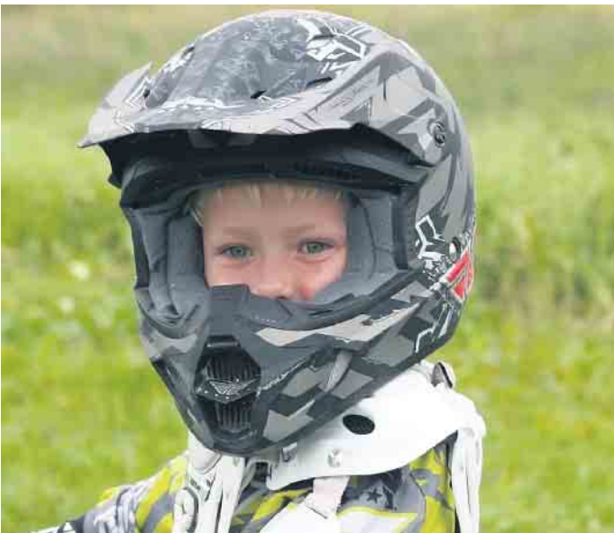
Wer leidenschaftlich gerne Motorrad fährt, steckt mit seiner Begeisterung oft auch den Nachwuchs an.

Kinder sicher auf dem Motorrad mitnehmen