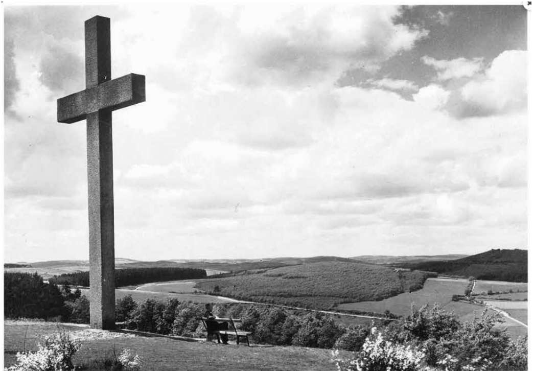
Aufnahme alten Postkarte mit dem Kreuz auf dem Roderter Radberg von vor 1939

Die alten Trassen werden teilweise heute noch von Wanderern und Autofahrern genutzt. Viele aber sind nur noch als Hohlwege im