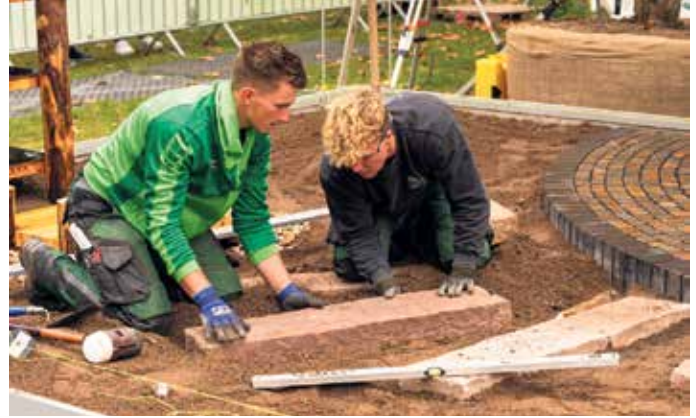
Bei der Verlegung von Trittstufen ist handwerkliches Geschick und Teamarbeit gefragt.

Ein Schülerpraktikum oder ein Ferienjob helfen, den Beruf kennenzulernen. Viele Betriebe bieten Schnuppertage an und freuen sich über interessierte Jugendliche, über junge Frauen wie junge Männer. Die duale Ausbildung kombiniert Praxis im Betrieb und Theorie in der Berufsschule - und legt den Grundstein für viele spannende Wege in einer stabilen und umweltrelevanten Branche. Wer will, kann sich später zum Meister / zur Meisterin oder zur Technikerin / zum Techniker weiterbilden, je nach Schulabschluss auch ein Studium im Landschaftsbau oder Umweltmanagement anschließen. Thomas Wiemer „Eltern sind in der Phase