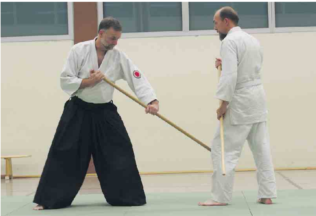
Aikido Kurs des Meckenheimer Sportvereins

Aikido ist eine ganzheitliche Sportart, die Körper und Geist gleichermaßen fordert. Durch die fließenden Bewegungen und die Schulung der Körperwahrnehmung verbessert sich nicht nur deine körperliche Fitness, sondern auch deine mentale Stärke.