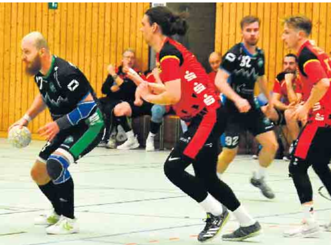
Die gegnerische Abwehr stand - eine Lücke war kaum zu finden.