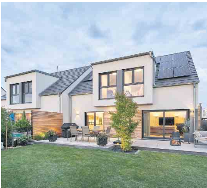
Doppelhaus in Fertigbauweise - das geht achsensymmetrisch oder auch grundverschieden.

wand weniger gibt“, so Hannott. Diese senke die Wohnnebenkosten beider Parteien und gebe bei einem zukunftssicher geplanten Doppel-Fertighaus mit fortschrittlicher Technik wie einer Photovoltaikanlage, einer Wärmepumpe und hauseigenen Speicherbatterie auf Jahre hin Kosten- und Versorgungssicherheit. (BDF/FT)