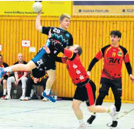
Angriffe wie dieser führten bei der HSG zu selten zum erfolgreichen Abschluss.

Kreisliga-Herren verlieren am Sonnenhügel klar gegen die Gäste vom TVE