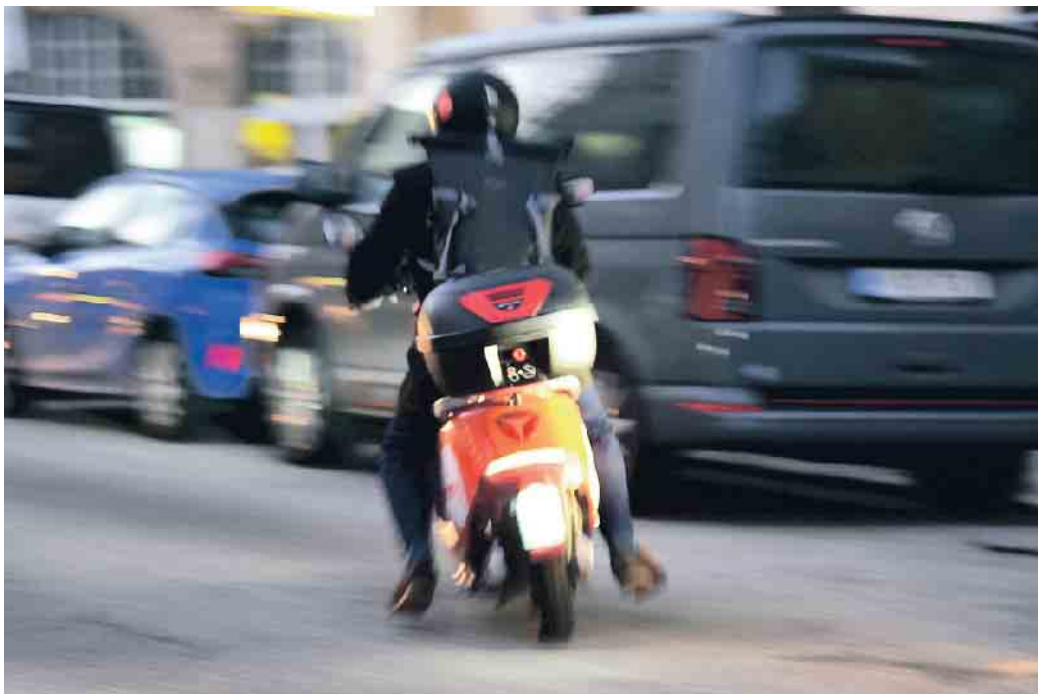
Kurvenfahren sollte man auf den Roller schon können.