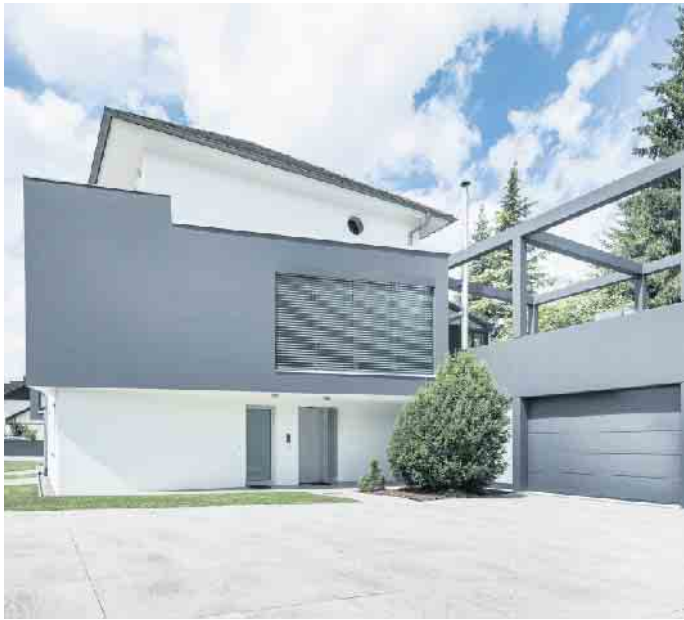
Die Fassade hat nicht nur eine schützende Funktion - sie bildet gleichzeitig das Gesicht des Eigenheims.

Neben Farbe und Putz spielt Klinker eine große Rolle. Häuser mit Klinkerriemchen prägen das Straßenbild ganzer Regionen beispielsweise im Norden und Westen Deutschlands. Das klassische Material wird heute mit einer noch größeren Vielfalt an Farben und Formaten wiederentdeckt. Die moderne Klinkerfassade erlaubt besondere Gestaltungen, gerade im Rahmen der Fassadendämmung. Die Basis dafür bildet stets ein Naturmaterial: Lehm, der entweder zu Klinkern gepresst oder zu Ziegeln geformt und anschließend gebrannt wird. (djd)