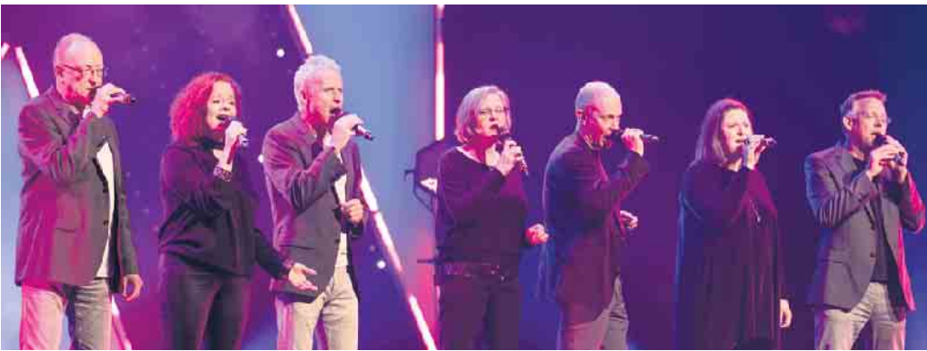
Dacapella in Aktion.

Das mehrfach preisgekrönte Ensemble „Dacapella“ gastiert im Münstereifeler Kulturhaus