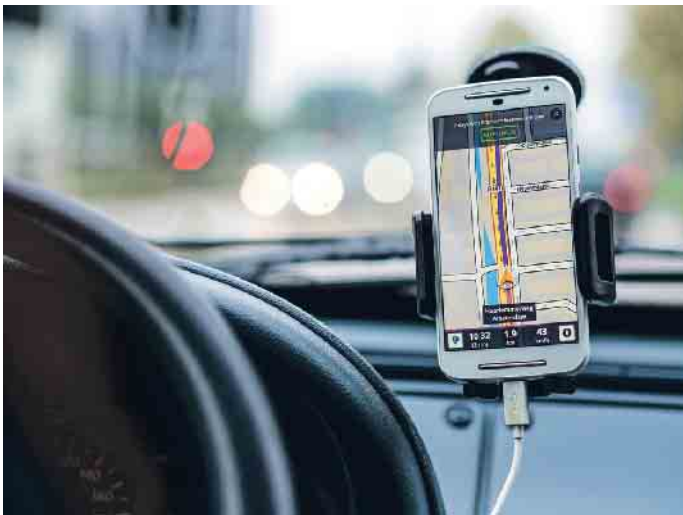
Immer mehr Menschen fühlen sich mit der Bedienung der Navigation überfordert.

Die integrierten Bildschirme für das Navigationssystem werden in Fahrzeugen immer größer. Statt nur die optimale Route vorzuschlagen, bieten sie ein komplettes Entertainmentsystem. Immer mehr Menschen fühlen sich mit der Bedienung überfordert. In einer Testreihe stellte die Dekra im kürzlich veröffentlichten Verkehrssicherheitsreport fest, dass die Probanden bei einem Fahrzeug mit Touchscreen im Durchschnitt deutlich mehr Zeit benötigten, um verschiedene Funktionen einzustellen, als im Vergleich bei einem Auto mit Knöpfen und Schaltern. Aus diesem Grund beleuchtet der ACE, Europas Mobilitätsbegleiter, die rechtliche Lage für die Verwendung von Navigationssystemen im Auto, auf dem Motorrad und dem Fahrrad. Dass die Nutzung des Handys am Steuer hierzulande verboten ist, ist inzwischen weithin bekannt. Doch wie verhält es sich mit überdimensionierten Touchscreens, die eher einem Tablet gleichen? Grundsätzlich gilt: Sämtliche elektronische Geräte dürfen nur bedient werden, wenn das Gerät dazu nicht in die Hand genommen wird, ein flüchtiger Blick ausreicht oder dies per Sprachsteuerung möglich ist. Der ACE rät daher allen Autofah-