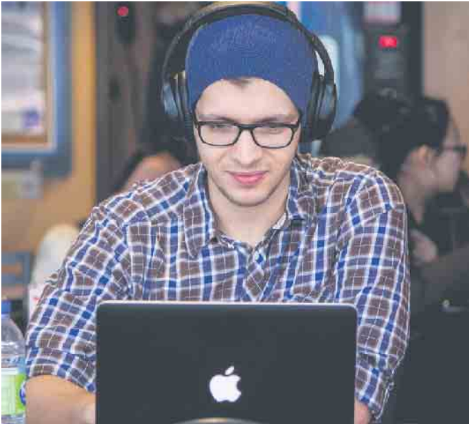
Bei der Lehrstellensuche spielt das Internet eine große Rolle.

Schon während der Schulzeit beschäftigen sich Burschen und Mädels mit der Frage, welcher beruflichen Tätigkeit sie später nachgehen wollen. Doch die Suche nach einer passenden Lehrstelle kann sich für die jungen Menschen manchmal als schwierig erweisen. Anlaufstellen mit Informations- und Beratungsangeboten für Jugendliche sind in dieser Phase von hoher Bedeutung. Der Lehrstellenmarkt ist riesig und genauso vielfältig sind die Möglichkeiten, die Schülerinnen und Schüler für die Suche nach einer passenden Lehrstelle nutzen können.