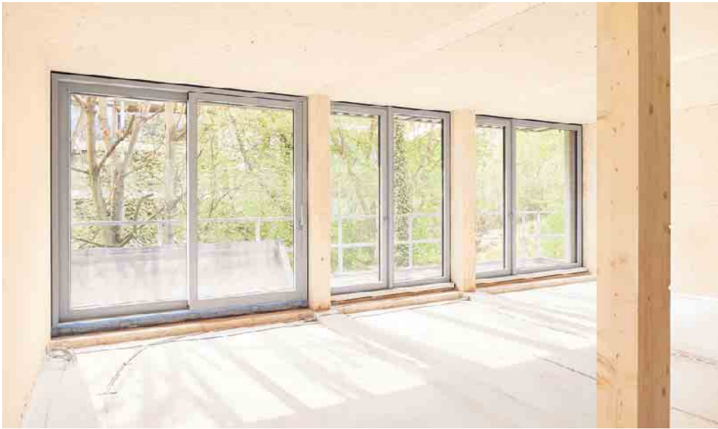
Lichtdurchflutete Räume, eingerahmt von eleganter Metall-Optik: Fensterrahmen aus einem Aluminium-Holz-Verbund bieten viele Gestaltungsmöglichkeiten gerade für großformatige Fenster.

Mit Holz als traditionellem und zugleich modernem, natürlichem Rahmenmaterial bietet sich ein nachwachsender Rohstoff an, dessen Verarbeitung mit sparsamem Energieeinsatz einhergeht. Zudem