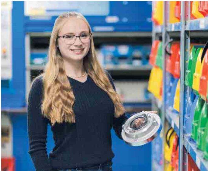
Kaufleute für Groß- und Außenhandelsmanagement sorgen für einen reibungslosen Warenfluss.

Viele Schulabgehende suchen eine Ausbildung nahe ihrem Wohnort. Grund genug für den VTH Verband Technischer Handel e.V., ab sofort eine Suche nach Postleitzahlen anzubieten. Im Internet können Suchende ihren Wunschort eingeben und das Suchkriterium „Ausbildungsbetrieb“ anklicken. Sofort werden ihnen die nächstgelegenen Großhändler angezeigt. Die Adresse dieses Services lautet: www.ich-will-handeln.eu . Der Technische Handel vereint mehr als 400 Betriebsstätten im deutschsprachigen Bereich. Die Technischen Händler versorgen Industrie, Gewerbe und Handwerk mit sämtlichem Bedarf, der für Produktion und Dienstleistungen erforderlich ist. Die Branche