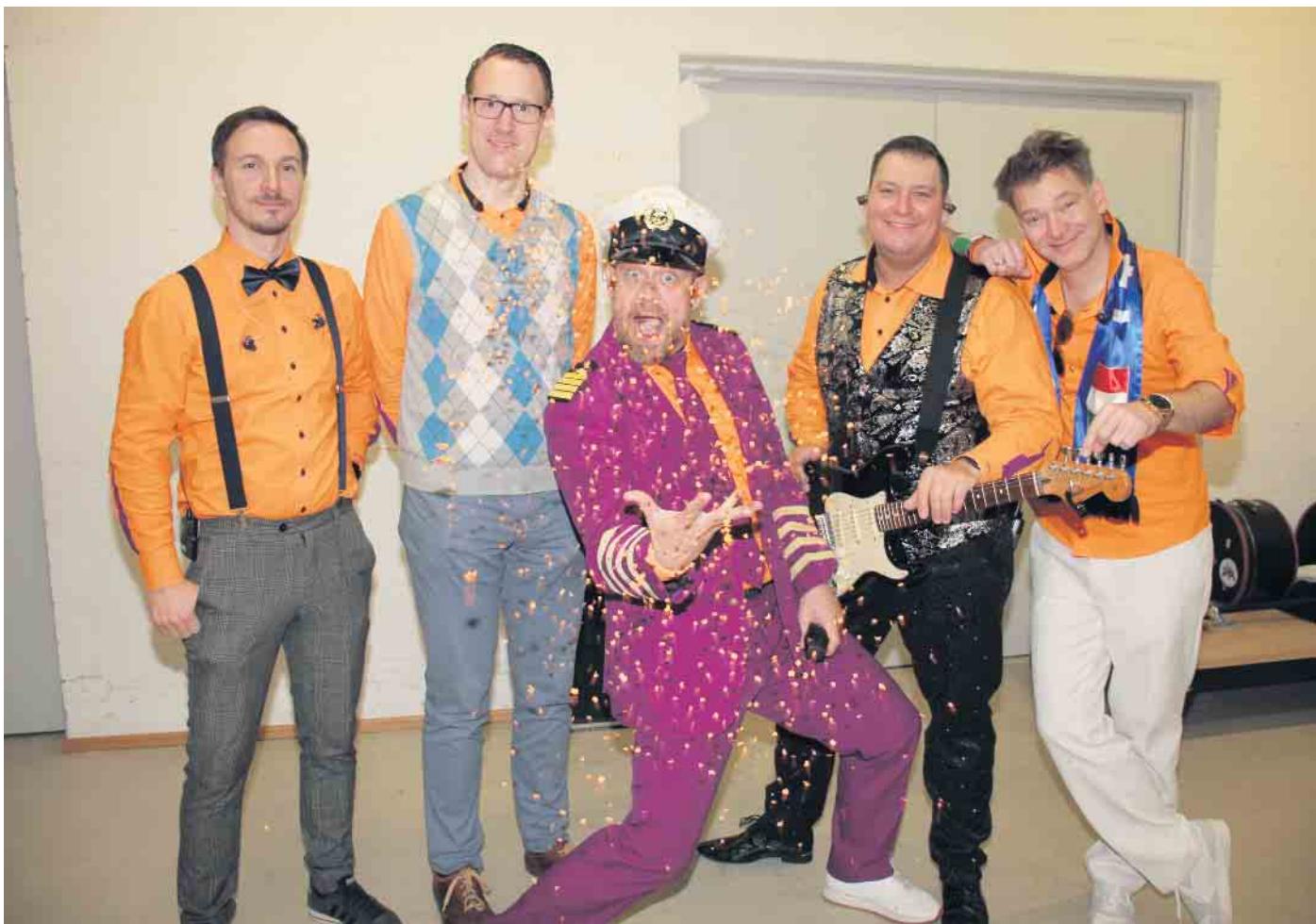
Die Männer von „Tacheles“ ließen unter dem Motto „Alles kann, Stimmung muss“ den Abend schließlich stimmungsgeladen ausklingen