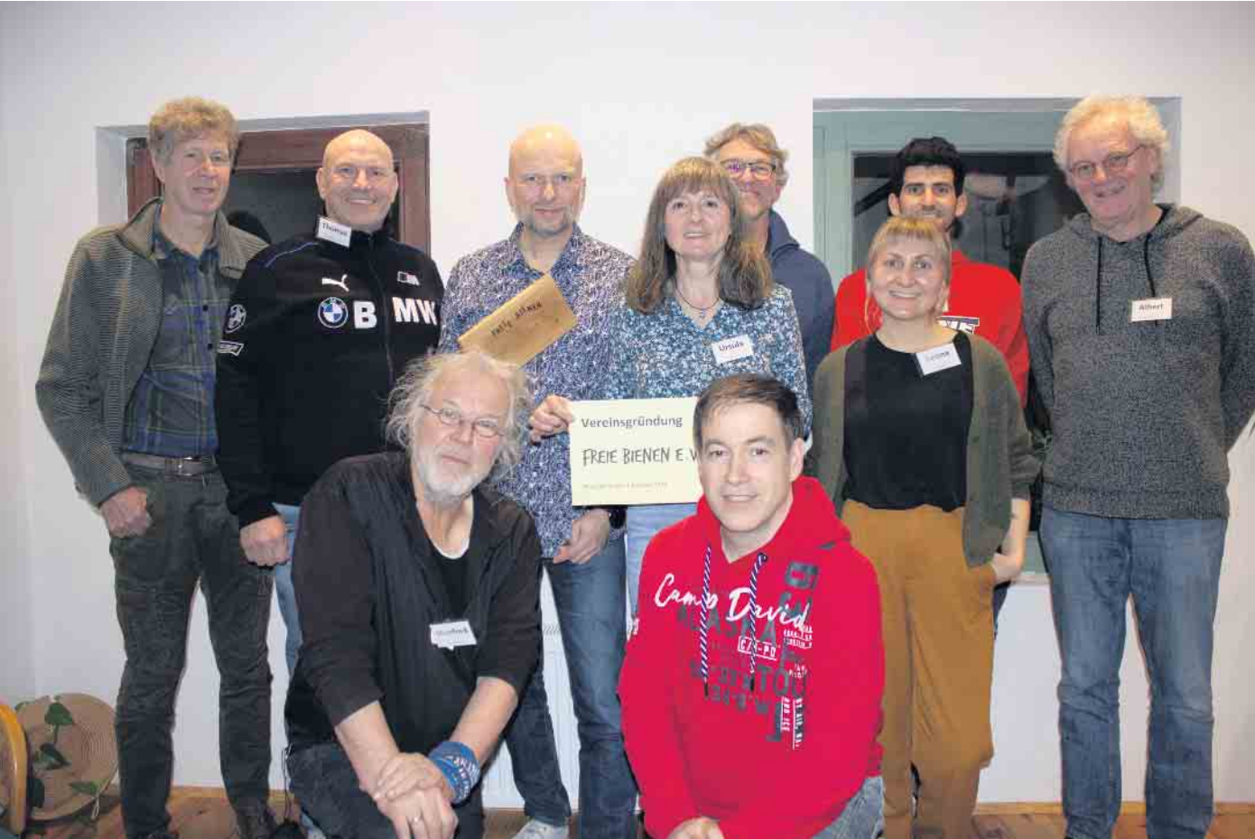
Gründungsmitglieder des Vereins „Freie Bienen e.V.“

Die Etablierung varroatoleranter Honigbienen und die Wiederansiedlung von überlebensfähigen wilden Honigbienen in Deutschland sind zwei zentrale Ziele des neu gegründeten Vereins „Freie Bienen e.V.“. Der Verein ist kein klassischer Imkerverein, sondern versteht sich als Ergänzung und