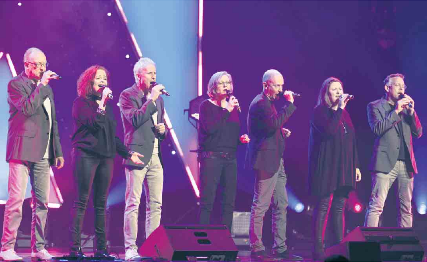
Dacapella in Aktion

Das mehrfach preisgekrönte Ensemble „Dacapella“ gastiert im Münstereifeler Kulturhaus