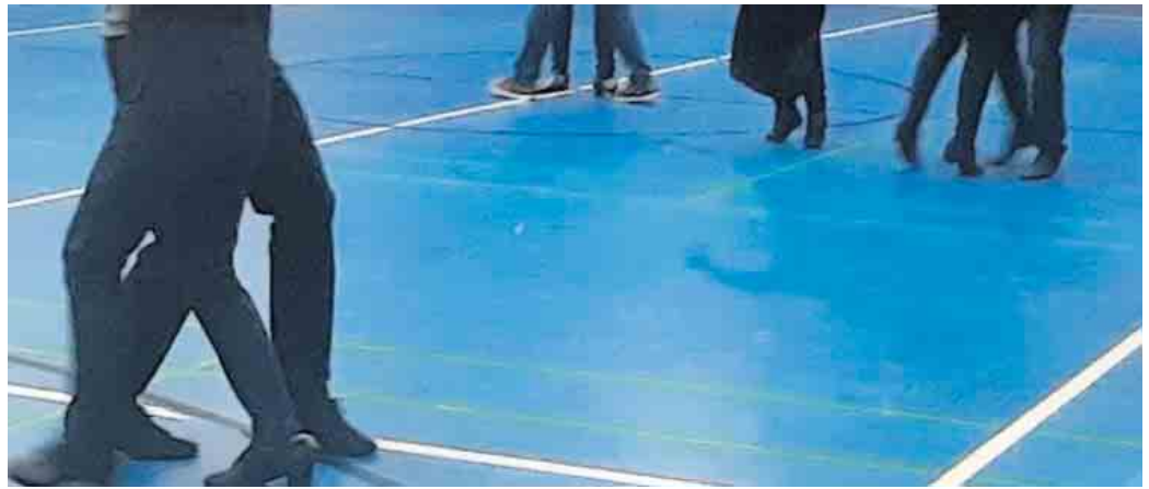
So fängt es an.