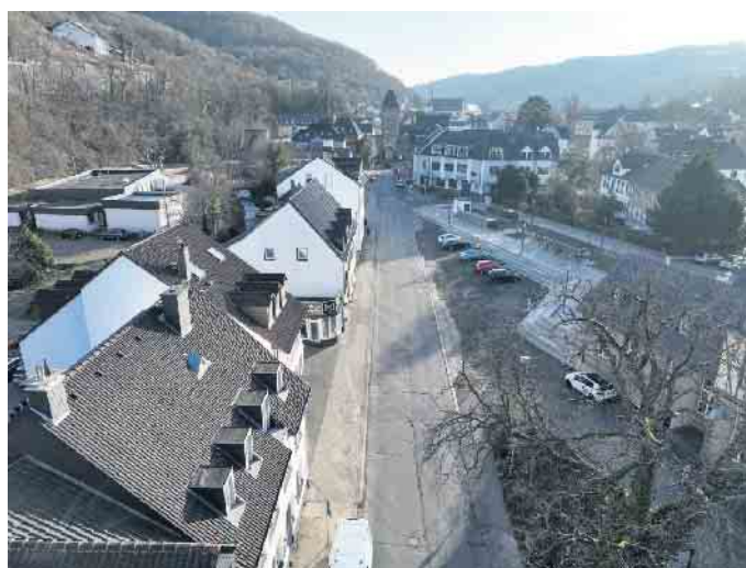
Im Februar startet die Sanierung der flutgeschädigten Kölner Straße.

Bereits begonnen hat der Abriss des Hauses Kölner Straße 12 neben der bisherigen Feuerwehrausfahrt. Schon vor der Flutkatastrophe war eine Sanierung des städtischen Gebäudes wirtschaftlich nicht mehr sinnvoll, durch die Flutschäden hat sich der Zustand weiter verschlechtert. Auf der frei werdenden Fläche wird provisorisch eine neue Feuerwehrausfahrt eingerichtet, um die Einsatzbereitschaft der Feuerwehr während der Bauarbeiten an der eigentlichen Ausfahrt sicherzustellen. Derzeit ist die Feuerwehr noch im Feuerwehrraum an der Kölner Straße untergebracht. Anfang 2027 wird dieses Gebäude abgerissen, da die Schäden aus der Flutkatastrophe eine Sanierung unmöglich machen. Die Haupt-Übergangswache wird in den ehemaligen Hallen von Auto Heinen am Bendenweg eingerichtet, wo ausreichend Platz zur Verfügung steht. Zusätzlich entsteht auf dem Grundstück der ehemaligen Kölner Straße 12 eine Übergangshalle für zwei Fahrzeuge.