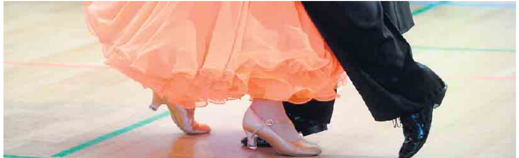
Da wollen wir hin.