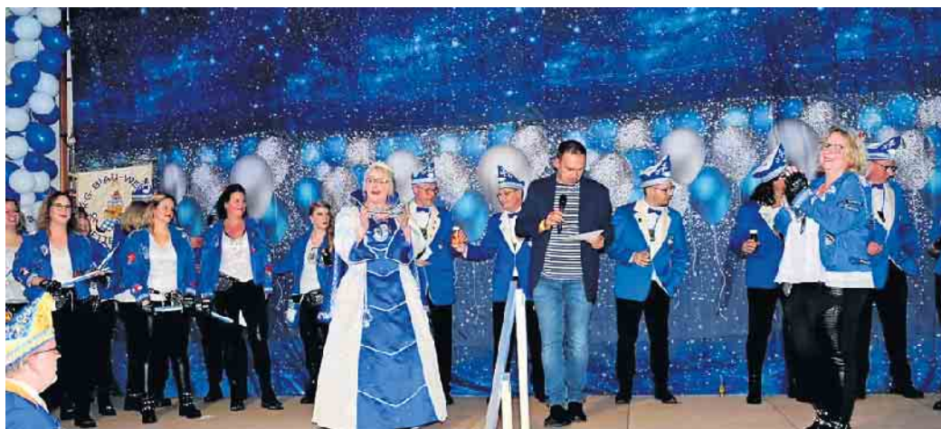
Proklamation am 15. November

15. Februar: Dr' Zock kütt in Mätenich Start 14 Uhr, anschließend Afterzoch Party