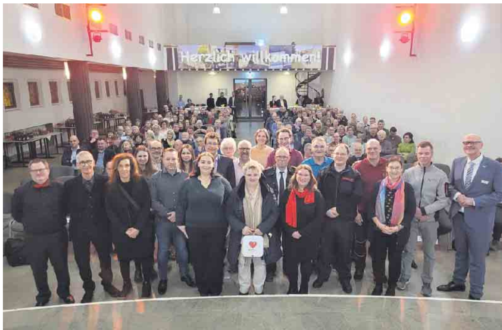
Mit dem Ehrenamtspreis 2026 wurden die Corheller aus dem Stadtgebiet, der Thürne-Verein für die Spielplatz-Patenschaft und das „Netzwerk psychosoziale Hilfe Bad Münstereifel“ ausgezeichnet.

Im Bildungsbereich stehen Investitionen in die Offenen Ganztagschulen, der geplante Um- und Anbau am St.-Michael-Gymnasium aufgrund der G9-Wiedereinführung sowie die weitere Sanierung der Grundschule Bad Münstereifel auf der Agenda. Deutlich wurde dabei erneut, wie stark die Stadt auf Förderprogramme von Land und Bund angewiesen ist.