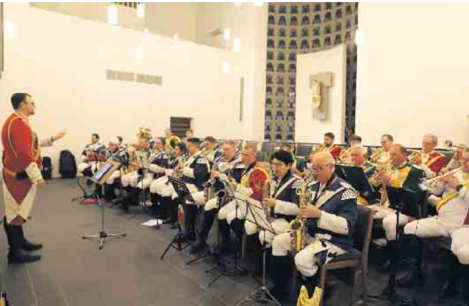
Musikalisch untermalt wurde die Messe durch Abordnungen von vier Karnevalsvereinen