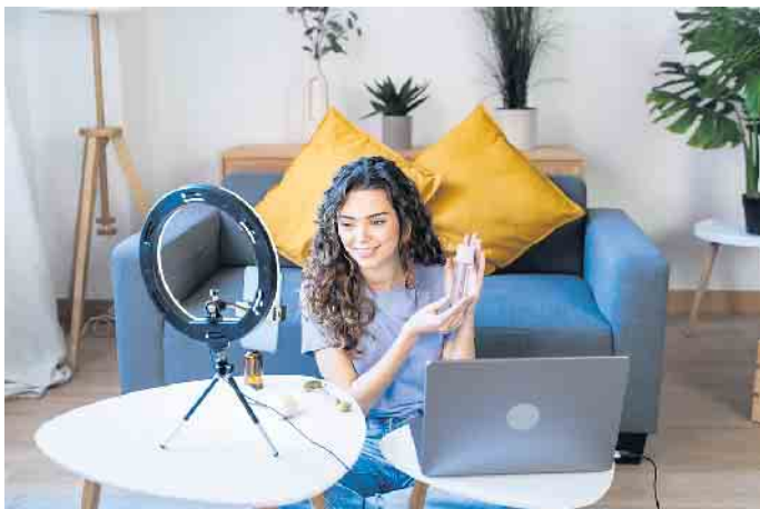
Jederzeit nah beim Kunden: Neben der persönlichen Beratung gewinnen digitale Formate, virtuelle Verkaufspartys oder Video-Tutorials im Direktvertrieb stark an Bedeutung.

Nach Angaben des Bundesverbandes Direktvertrieb Deutschland ist auch zu beobachten, dass die Kinder erfahrener Vertriebspartner oder -partnerinnen mit ins Familiengeschäft einsteigen - zum Beispiel als attraktiver Nebenerwerb während des Studiums. Schließlich bietet die Tätigkeit alle Freiheiten, sich Arbeitszeiten und -umfang flexibel einzuteilen. Daher ist