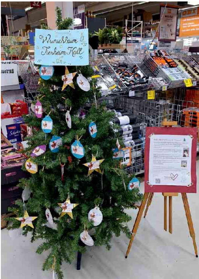
Auch mit dem OBI-Wunschbaum wurde das Kaller Tierheim großartig unterstützt.

Mit großer Dankbarkeit und Zuversicht startet das Team des Tierheims Kall in das neue Jahr. Die überwältigende Unterstützung aus Kall und der Eifel in der Weihnachtszeit hat einmal mehr gezeigt, wie stark der Zusammenhalt in der Region ist - und wie viel Herz für den Tierschutz hier vor Ort schlägt. Zahlreiche Spenden und Hilfsaktionen haben dazu beigetragen, die Versorgung der Tiere weiterhin auf einem guten und verlässlichen Niveau zu gewährleisten. Besonders die Weihnachtsaktio-