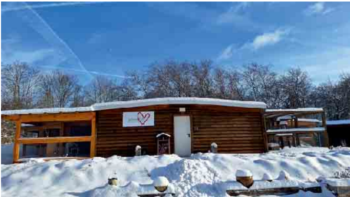
Das Tierheim Kall startete mit großer Unterstützung ins neue

Mit großer Dankbarkeit und Zuversicht startet das Team des Tierheims Kall in das neue Jahr. Die überwältigende Unterstützung aus Kall und der Eifel in der Weihnachtszeit hat einmal mehr gezeigt, wie stark der Zusammenhalt in der Region ist - und wie viel Herz für den Tierschutz hier vor Ort schlägt. Zahlreiche Spenden und Hilfsaktionen haben dazu beigetragen, die Versorgung der Tiere weiterhin auf einem guten und verlässlichen Niveau zu gewährleisten. Besonders die Weihnachtsaktio-