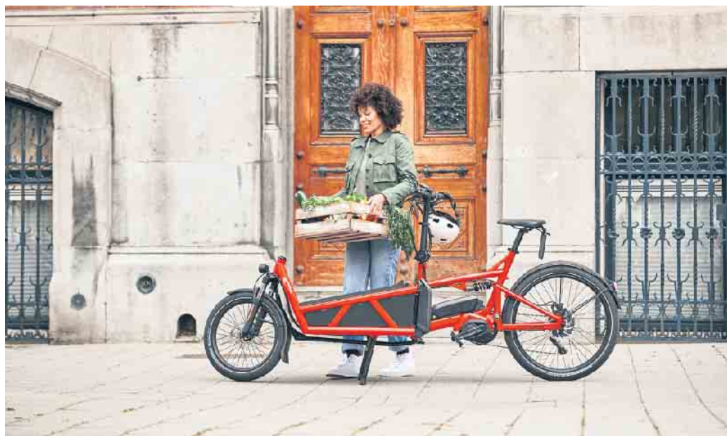
Lastenräder gehören in vielen Städten zum Alltagsbild. Mit elektrischer Unterstützung ermöglichen E-Cargobikes den bequemen Transport zum Beispiel von Wocheneinkäufen.

Vor allem im innerstädtischen Verkehr gehören Lastenräder mit zusätzlicher elektrischer Unterstützung bereits zum Alltagsbild. Sie entlasten nicht nur den Straßenverkehr, sondern schonen auch die Umwelt, da sie weniger Platz als ein Auto benötigen, keinen Lärm und keine Luftschadstoffe verursachen. Aufgrund der geringen laufenden Kosten dürften E-Cargobikes somit vielfach das bisherige Zweitauto der Familie ersetzen. Hinzu kommen zeitliche Vorteile, wenn man morgens im Berufsverkehr entspannt am Stau vorbeiradeln kann. Für Eltern, die den Nachwuchs beispielsweise zur Kita bringen möchten, eignen sich sogenannte Long-John-Modelle mit einer Lade- fläche vor dem Lenker. Der Vorteil: Hier haben Mama oder Papa ihre Kids stets im Blick. Aber auch mit Long-Tail-Modellen, bei denen sich der Stauraum hinter dem Sattel befindet, lassen sich größere Kinder noch mitnehmen - das Rad wächst quasi mit dem Nachwuchs. Ebenso bieten die Lastenräder ausreichend Platz für den Wocheneinkauf, dank der elektrischen Unterstützung etwa des Cargo Line-Antriebs von Bosch eBike Systems werden selbst schwere Lasten bequem transportiert. Der Antrieb unterstützt in niedrigen Trittfrequenzen kraftvoll und sorgt so für Schub beim Anfahren oder Beschleunigen. Genug Energie auch für längere Strecken Wichtig ist gerade bei elektrischen Lastenrädern ein leistungs-