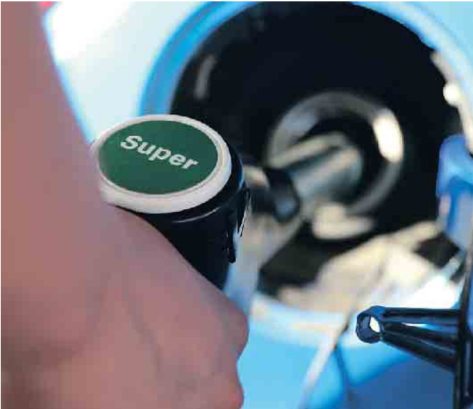
Nicht immer super: Benzin kann im Dieselfahrzeug erhebliche Schäden anrichten.

Es kommt öfter vor als viele denken: Beim Tanken greifen Autofahrer zur falschen Zapfpistole. Das kann für die Technik fatale Folgen haben. Als erste Verhaltensregel gilt: Umgehend den Tankvorgang abbrechen, falls man das Missgeschick schon währenddessen bemerkt. Nächster Schritt: Das Auto zur Seite schieben, ohne den Motor zu starten. Denn das Einschalten der Zündung oder gar ein Startversuch können zu Schäden führen. Das Tankstellenpersonal kennt Spezialfirmen, die mit Absauggeräten den ungeeigneten Kraftstoff absaugen. Auch Automobilclubs können helfen. Ein Startversuch nach falschem Tanken wirkt sich unterschiedlich aus. Der Ottomotor springt mit Diesel im Tank nicht mehr an oder beginnt bald zu stottern, bevor er ausgeht. Grund: Diesel entzündet sich weitaus schlechter als Benzin. Dem Zündfunken gelingt es nicht, das Gemisch zur Explosion zu bringen. Eine unkontrollierte Verbrennung kann zu Motordefekten führen, auch Katalysator oder die Lambdasonde können Schäden davontragen. Rasches Handeln hilft: Nach dem Absaugen des Diesels und dem Einfül-