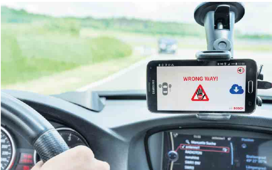
Im Fall der Fälle schlägt das Cloudsystem Alarm, die Falschfahrerwarnung ist innerhalb von zehn Sekunden möglich.