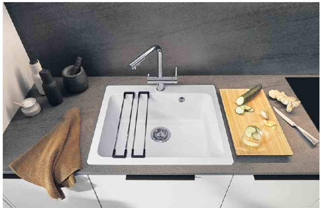
Raumwunder mit großem Beckenvolumen: Diese Granitspüle in einer ausgewogenen und modernen Linienführung sorgt für Spülkomfort im Kompaktformat. Vielseitiges Zubehör macht sie zum Multitalent am Wasserplatz.

plin fündig: z. B. eine Spülenmaterialität, die zu 99 Prozent aus natürlichen, nachwachsenden oder recycelten Rohstoffen besteht und nach einem langen Lebenszyklus wieder in einen geschlossenen Recycling-Kreislauf zurückgeführt werden kann. „Neben ihren besonderen Gebrauch- und Materialeigenschaften überzeugen moderne Spülen insbesondere auch aufgrund ihrer hohen Funktionalität. Hinzu kommen ein außergewöhnliches Design und eine sehr angenehme Haptik. Ob es nun eine formschöne Edelstahl-, Keramik- oder Granitspüle wird, seine finale Kaufentscheidung sollte man am besten in einem Küchenstudio oder in einem Möbelhaus treffen“, empfiehlt AMK-Geschäftsführer Volker Irle. (AMK)