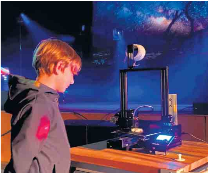
Jugendlicher Technikfan bestaunt 3D-Drucker unterm Sternenhimmel.

Illuminierter Sternenhimmel symbolisiert „Hightech zum Greifen nah“