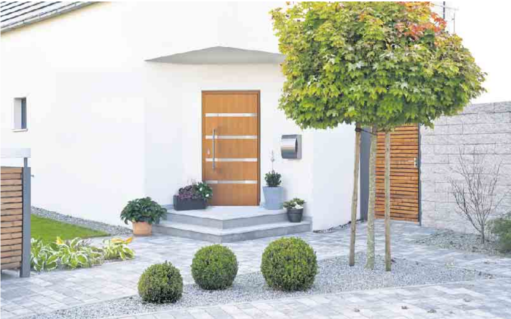
Natürlich anmutende Tür in modernem Design.

Reine Funktionalität, um ins Haus und nach draußen zu gelangen, war gestern - Immer mehr Bauherren sehen die Haustür als elementares Gestaltungselement der eigenen vier Wände, berichtet der Verband Fenster und Fassade (VFF). Folgende Faktoren haben Einfluss auf die Auswahl der passenden Tür.