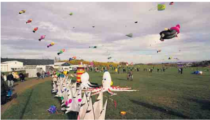
Am 2. und 3. November gehört der Flugplatz „Auf dem Dümpel“ wieder ganz den Drachenfreunden.