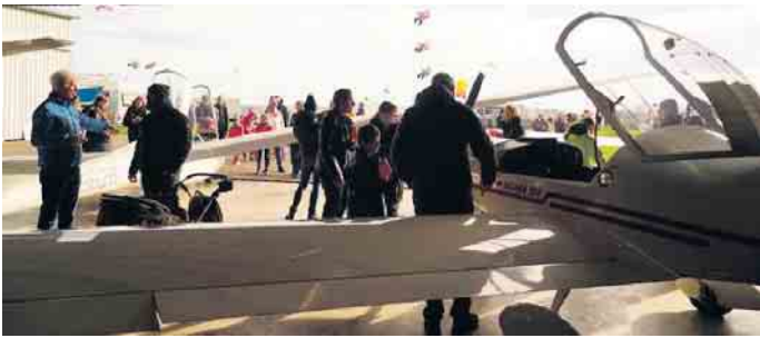
Großer Andrang auch in der Flugzeugausstellung des LSC Dümpel

sitzen möchten, bietet die Flugzeugausstellung zum Drachenfest noch einmal Gelegenheit, sich umfassend über die Pilotenausbildung im LSC Dümpel zu informieren, oder schon einmal auf dem Pilotensitz eines echten Flugzeuges Platz zu nehmen.