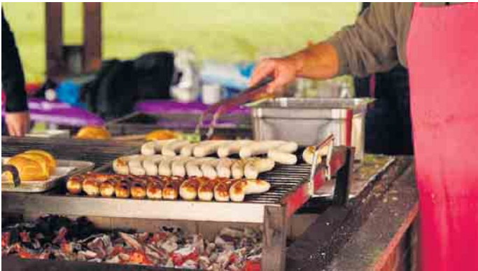
Für das leibliche Wohl ist wieder bestens gesorgt.