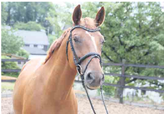
Wer in der freien Landschaft und im Wald auszureiten möchte, benötigt ein gültiges Reitkennzeichen für sein Pferd.

Weitere Informationen auf www.obk.de/reitregelung und beim Umweltamt des Oberbergischen Kreises, Isabell Engel, Telefon: 02261 88-6718 und E-Mail isabell.engel@obk.de .