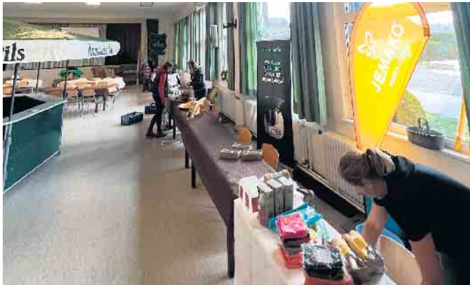
Aufbauarbeiten im St. Anna-Heim

Darüber hinaus findet ein Preisschießen für Jung und Alt mit dem Lichtpunktgewehr statt, der amtierende Schützenkönig hat sich auf die Kinderbelustigung spezialisiert. Für das leibliche Wohl ist gesorgt. Der Markt ist geöffnet am Samstag, 4. November, von 14 bis 22 Uhr und am Sonntag, 5. November, von 10 bis 17 Uhr. (mk)