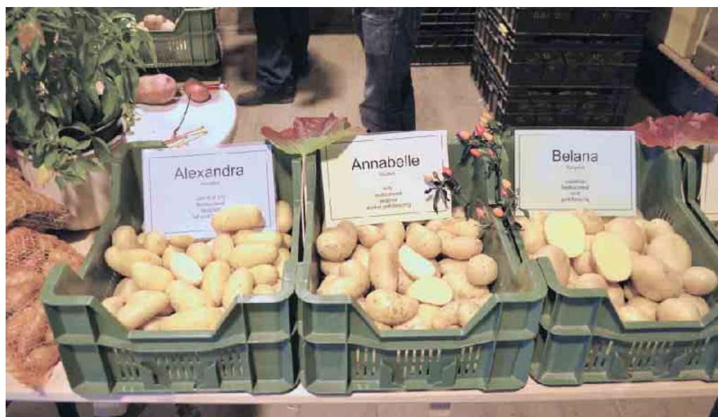
Kartoffelsortenschau beim Äpelsfess im LVR-Freilichtmuseum Lindlar.

LVR-Freilichtmuseum Lindlar veranstaltet Kartoffelfest