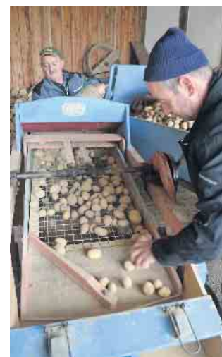
In der Sortiermaschine werden Kartoffeln nach Größe sortiert.