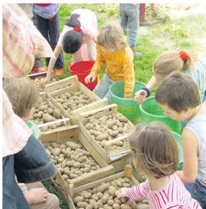
Kinder beim Kartoffeln sortieren im LVR-Freilichtmuseum Lindlar.