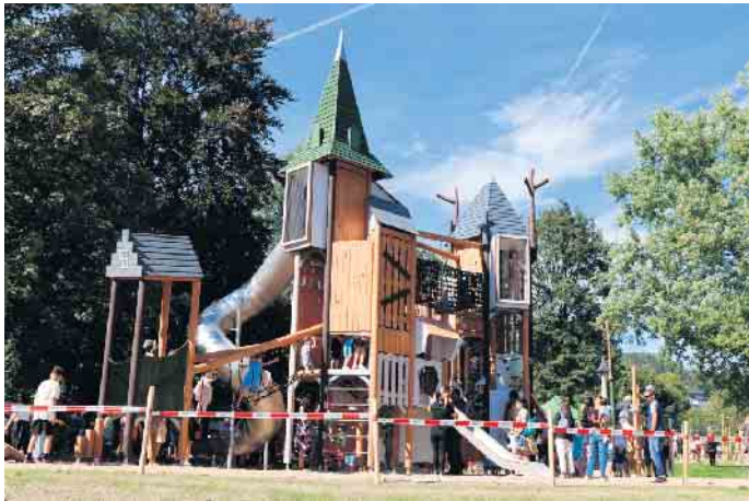
Die Spielburg ist das Wahrzeichen des Talparks