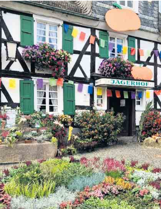
Blumenpracht am Jägerhof.

Mit Öffnung des Jägerhofs um 11 Uhr startet der Frühschoppen. Neben der obligatorischen Kürbissuppe werden leckere Waffeln mit heißen Kirschen und mehr angeboten. Mit Livemusik der Familie Rink werden große und kleine Leute unterhalten. Eine Hüpfburg wartet im Garten auf „Kundschaft“. Das Blumenmeer am Jägerhof, von Blumen Krumme im Frühjahr liebevoll gestaltet, wird seine größte Pracht zum Kürbisfest entfalten. Pflanzenexperte und Kürbiskenner Jürgen Krumme unterstützt die Veranstaltung und steht für Fachfragen zur Verfügung.