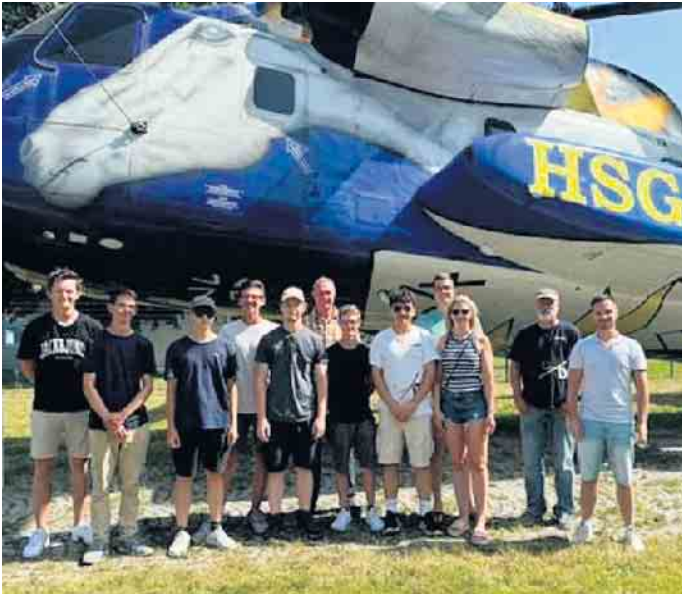
Einige Teilnehmer des Fliegerlagers nutzten die Gelegenheit, das Hubschraubergeschwader 64 Laupheim zu besuchen.