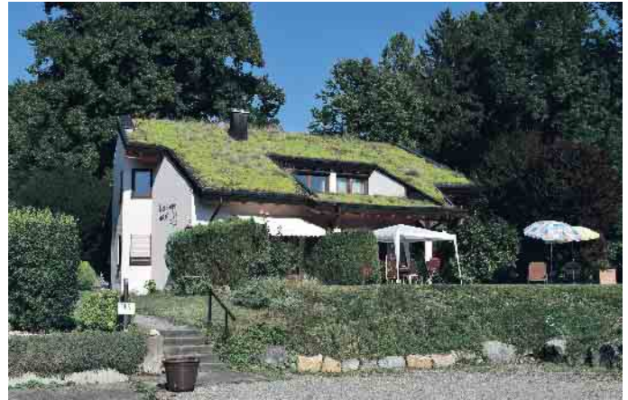
Auch Steildächer können begrünt werden.

Die Fortschritte im Dachdeckerhandwerk sind ein beeindruckendes Beispiel für ein sich ständig weiterentwickelndes Gewerbe. Durch die Kombination traditioneller Handwerkskunst mit innovativen Technologien - Schieferhammer und iPad - tragen Dachdecker und Dachdeckerinnen