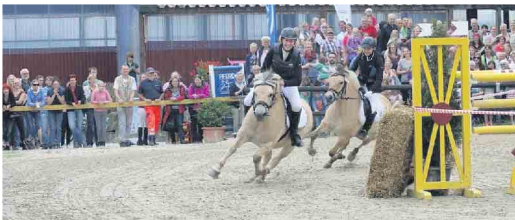
Highlight am Sonntag: Das bekannte Ponyrennen