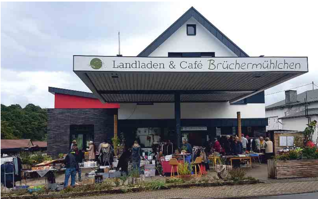
Das „Brüchermühlchen“ findet man in der Ortsmitte.

Seit November 2021 besteht das „Brüchermühlchen“ in Brüchermühle und bereichert den Ort mit einem gut sortierten Bioladen sowie einem behaglichen Café. Hier bietet das Team täglich ein warmes Mittagessen, Kaffee und Kuchen an. Im Landladen findet man alles für den täglichen Bedarf sowie gute fachliche Beratung zu allen Produkten. Das „Brüchermühlchen“ möchte für alle Besucher und Kunden ein gemütlicher Treffpunkt mit kulturellen und kulinarischen Angeboten sein. Dazu gehören ganzjährig Konzerte und Themenabende, mit Lesungen und vielem mehr. Im Sommer gibt es immer besondere Highlights und das Café wird in den Außenbereich ausgedehnt. Das Sommerfest am 9. Juni startet um 11 Uhr mit dem beliebten Flohmarkt. Ab 17 Uhr er-