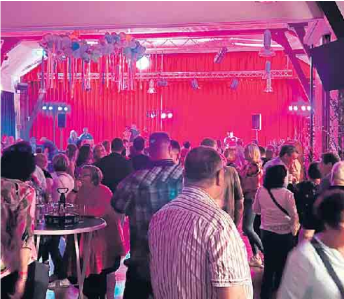
Jägerhof eG: Tanz in den Mai.

Feuerwehr-Musikzug und Jägerhof eG musizieren und tanzen in den Mai