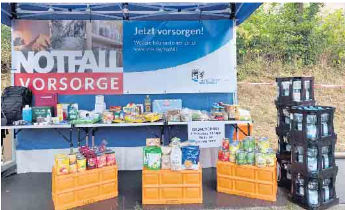
Bei der Blaulichtmeile 2022 entlang der Aggertalsperre ging der Oberbergische Kreis an seinem Stand auf das Thema Not- bzw. Grundvorrat ein.

Die Kreisverwaltung informiert monatlich zum Thema Notfallvorsorge. Diesmal geht es um das Anlegen eines Notvorrats.