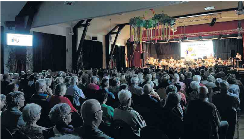
Frühjahrskonzert des Feuerwehr-Musikzugs

Begeisterte Besucher im Saal dankten mit anhaltendem Applaus, der zwei Zugaben mit Stücken der Toten Hosen und von Brings herausforderte. Zur anschließenden Happy Hour übernahm die Jägerhof-Genossenschaft das Regiment. In der Rekordzeit von 8 Minuten und 36 Sekunden räumten ihre Genossen und die Feuerwehr sämtliche Stühle beiseite und machten den Saal frei für die Tanzfläche. Das DJ-Team Jürgen und Constantin Brensing sorgte mit aktuellen Schlagern, legendären Oldies und Gassenhauern dafür, dass die rund 150 Gäste ihre Frühjahrsmüdigkeit endgültig wegtanzten. Zu später Stunde klinkten sich in den mit einer Discokugel und flackernden Spotlights, mit Birken, bunten Schleifen und Ballons geschmückten Saal noch neue, junge Besucher ein. Pünktlich