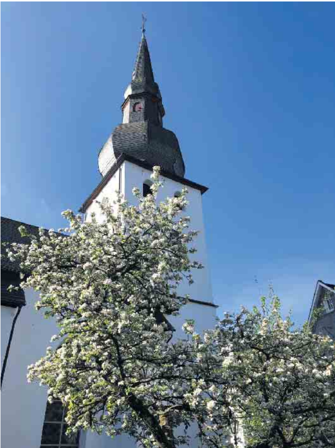
Kirche Bergneustadt.

Evangelische Kirchengemeinde lädt zur Gründungsversammlung des Fördervereins Altstadtkirche ein