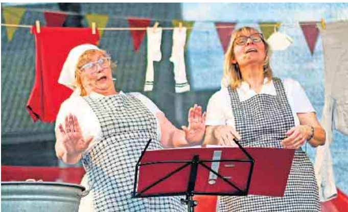
Minchen und Jettchen.

Danach wird rund um den Losemundbrunnen bei Speis und Trank sowie musikalischer Begleitung gefeiert.