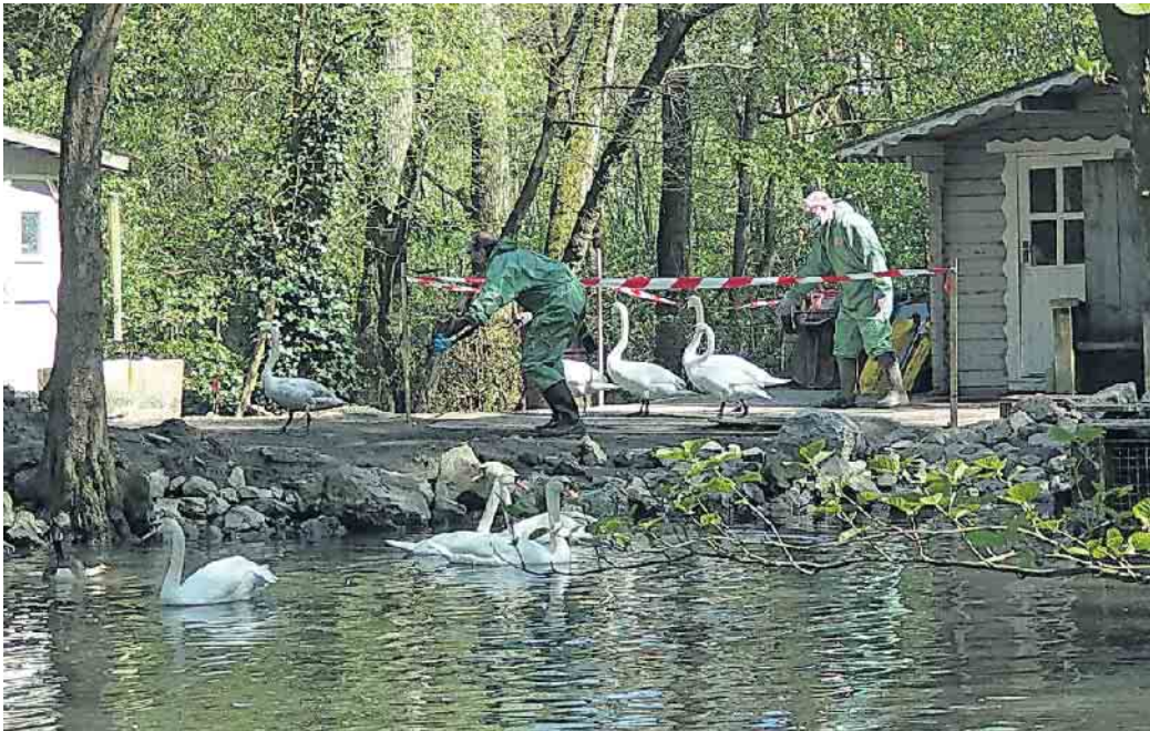
Die Veterinäre während der Übung.

Der Oberbergische Kreis hat am vergangenen Montag zusammen mit den Nachbarkreisen in einer groß angelegten Übung die Bekämpfung der Vogelgrippe geübt. Das Veterinäramt des Oberbergischen Kreises hat sich mit den Veterinärbehörden von sechs Nachbarkreisen zusammengeschlossen und eine gemeinsame Seuchenbekämpfung vereinbart. In diesem Tierseuchenverbund finden jährlich reihum Übungen statt. Die diesjährige Übung wurde vom Ennepe-Ruhr-Kreis ausgerichtet und fand an drei Orten im Kreisgebiet des Ennepe-Ruhr-Kreises statt. Als Übungsszenario wurde ein Vogelgrippeausbruch (Aviäre Influenza) in einer Wildvogelstation in Hattingen und der Fund mehrerer toter Wildvögel auf dem Kemnader Stausee durchgeführt.