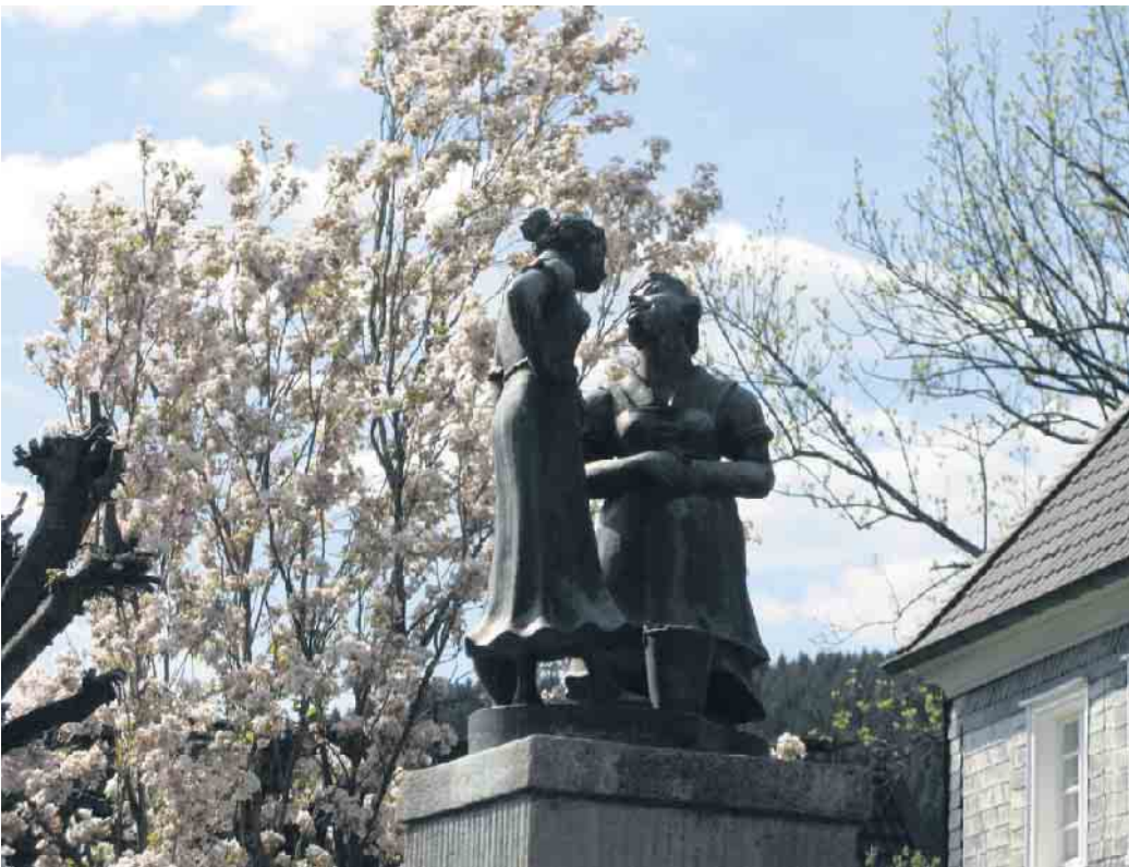
Altstadt / Losemundbrunnen.

17.15 Uhr - ‚Weg der Stadtgründer‘ - vom Berg in die Altstadt. Mit Bürgermeister, Landsknechten und Marketenderinnen, Mitgliedern des Stadtrates, Kindergärten, Schulen und Vereine