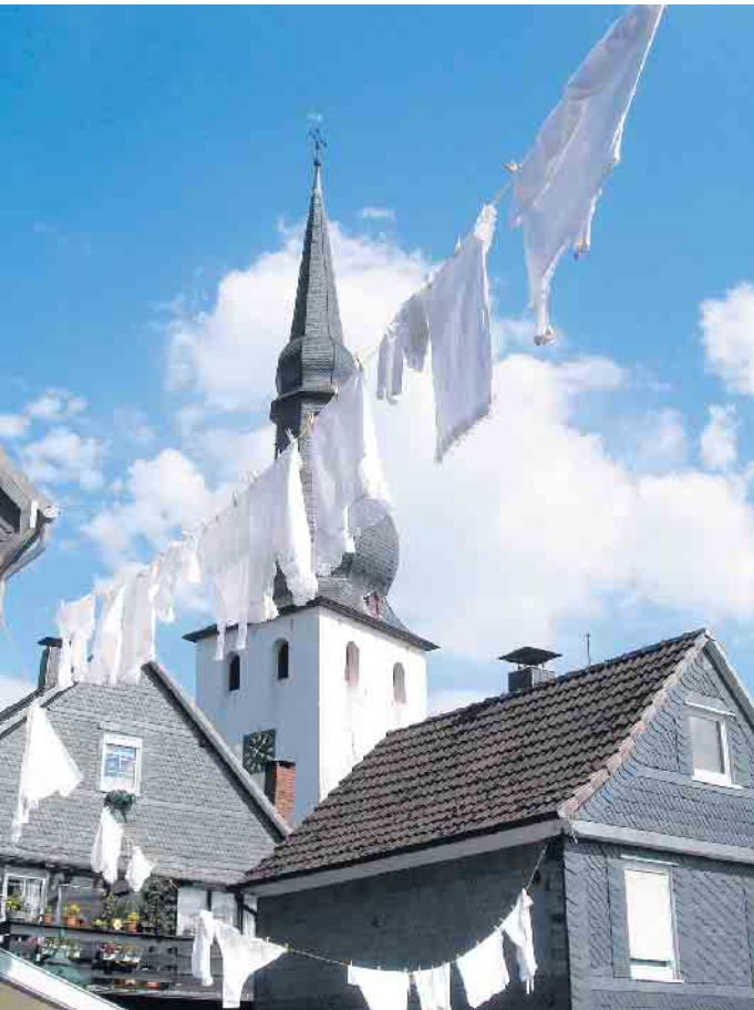
Historische Altstadt Bergneustadt.