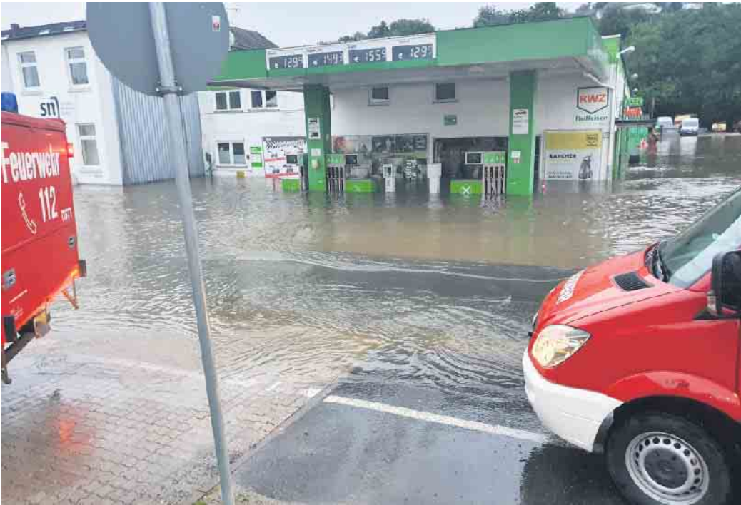
Bürgerinnen und Bürger können sich kostenlos in einer Online-Infoveranstaltung des Dorfservice Oberberg über Vorsorgemaßnahmen gegen Hochwasser und Starkregen informieren.