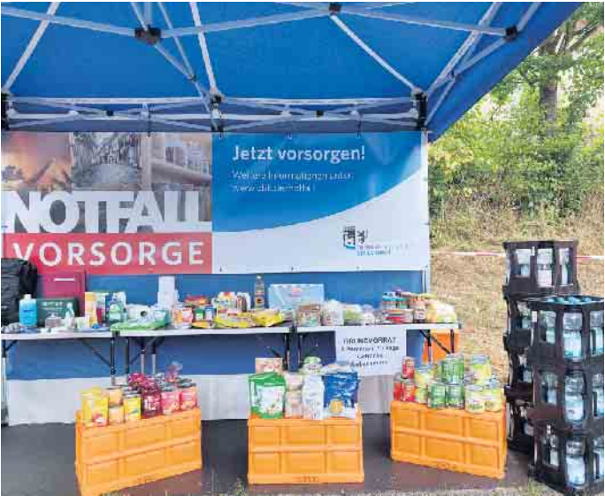
Eine Übersicht über die Notfallvorsorge.

Das Bundesamt für Bevölkerungsschutz und Katastrophenhilfe (BBK) empfiehlt, u. a. Taschenlampen und ggf. ein UKW-Radio mit Batterien bereitzuhalten. Unwetterwarnungen über die Medien sollten beachtet werden. Auch unter www.dwd.de (Deutscher Wetterdienst) oder in der Warn-