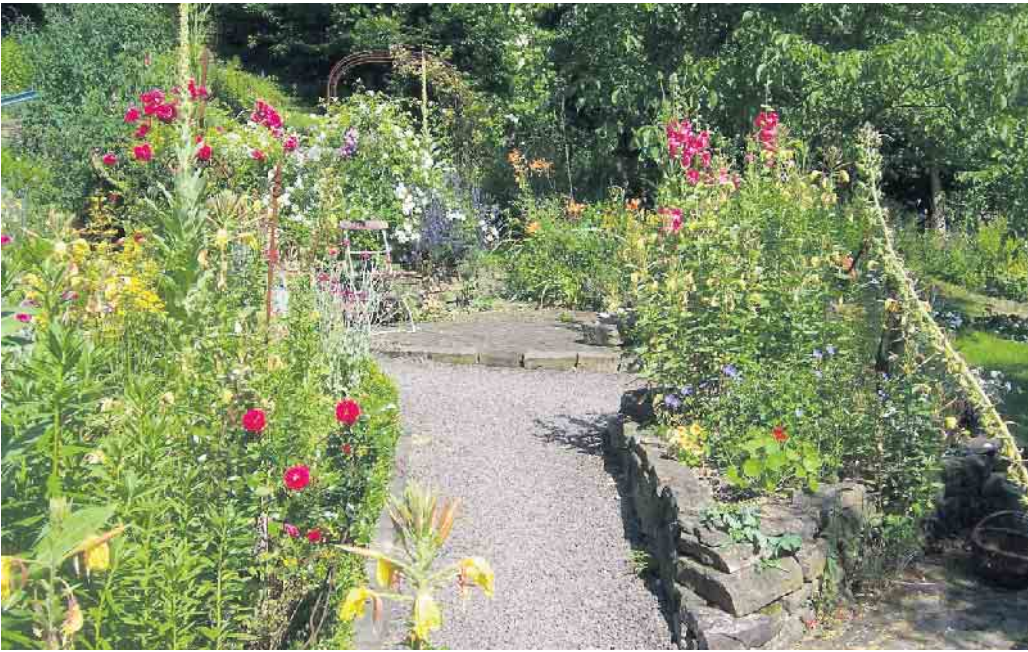
Eine Oase für Mensch und Tier - der naturnahe Garten mit seiner Wildpflanzenvielfalt und seinen spannenden Lebensräumen.

Die Themen Klimakrise und Artensterben begleiten unseren Alltag längst. Doch jede(r) kann schon mit kleinen Schritten dabei helfen, bedrohten Wildbienen und anderen Insekten - und in Folge Gartenvögeln, Igel und Fledermäusen - einen Lebensraum im Garten oder auf dem Balkon an-