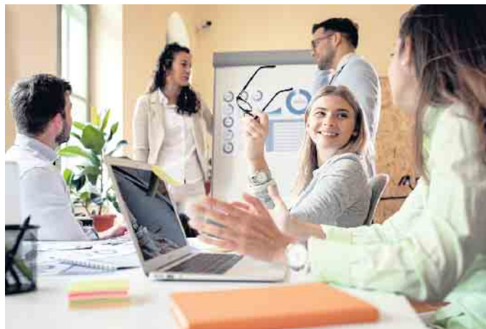
Kommunikative Fähigkeiten sind bei angehenden Bankkaufleuten besonders gefragt.