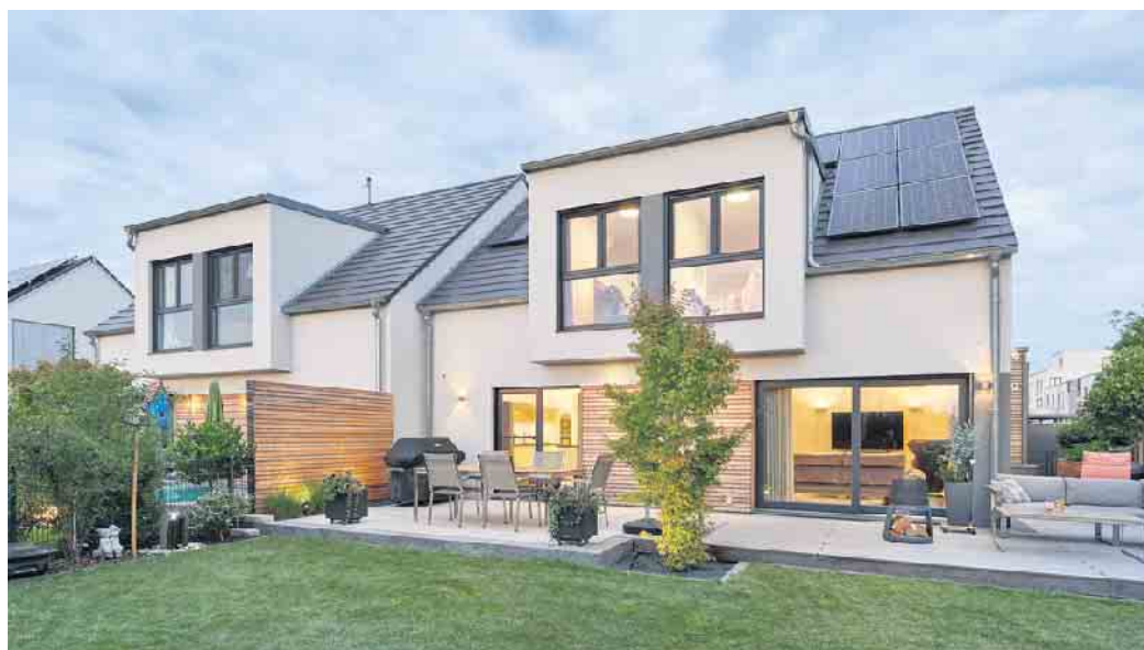
Doppelhaus in Fertigbauweise - das geht achsensymmetrisch oder auch grundverschieden.

Diese senke die Wohnnebenkosten beider Parteien und gebe bei einem zukunftssicher geplanten Doppel-Fertighaus mit fortschrittlicher Technik wie einer Photovoltaikanlage, einer Wärmepumpe und hauseigenen Speicherbatterie auf Jahre hin Kosten- und Versorgungssicherheit. (BDF/FT)