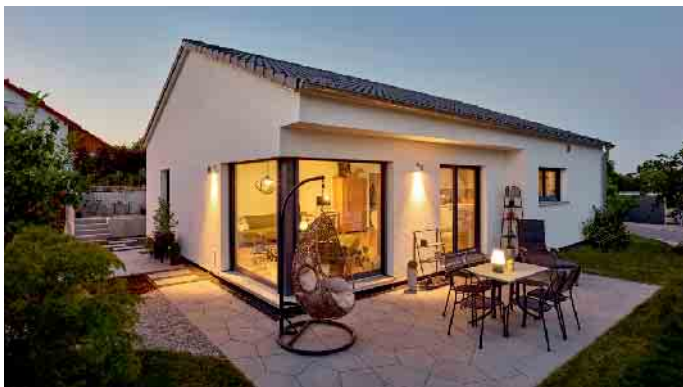
Nicht nur, aber besonders bei älteren Menschen ist das Wohnen auf einer Ebene beliebt.

Nach der jungen Familie sind Menschen über 50 die zweitwichtigste Zielgruppe für Hausbauunternehmen. Laut Statistik des Bundesverbandes Deutscher Fertigbau (BDF) zählt fast jeder vierte Bauherr zu dieser Altersgruppe. Viele von ihnen möchten aus einer Stadtwohnung oder einem zu groß gewordenen Haus lieber in einen altersgerechten Wohnsitz umziehen. Sie wünschen sich ein kleines Haus mit Garten, das modern, komfortabel und pflegeleicht ist und das viele Lieblingsplätze bereithält, die sich spätestens nach Ende des Berufslebens so richtig genießen lassen. Meist ist ihr Traumhaus für die zweite Lebenshälfte ein Bungalow. Das entscheidende Merkmal des Bungalows ist, dass er nur eine Etage hat. Schlafzimmer, Wellnessbad und Wohnbereich befinden sich allesamt im Erdgeschoss. Auch für ein Gästezimmer, ein Homeoffice und natürlich die Haustechnik findet sich in modernen Bungalow-Grundrissen Platz. Lästiges Treppensteigen entfällt entweder ganz oder lässt sich wahlweise auf ein