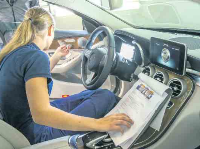
Ausbildungsberufe in der Kraftfahrzeugbranche bieten jungen Menschen gute Entwicklungschancen und zukunftssichere Arbeitsplätze.

Wandel der Mobilitätsbranche bringt neue berufliche Herausforderungen