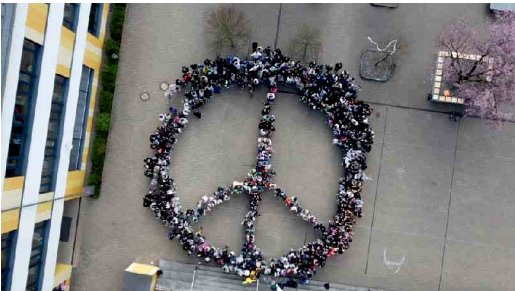
Die Schüler des Aggertal Gymnasiums Engelskirchen formierten sich in Form eines Peace-Zeichens.