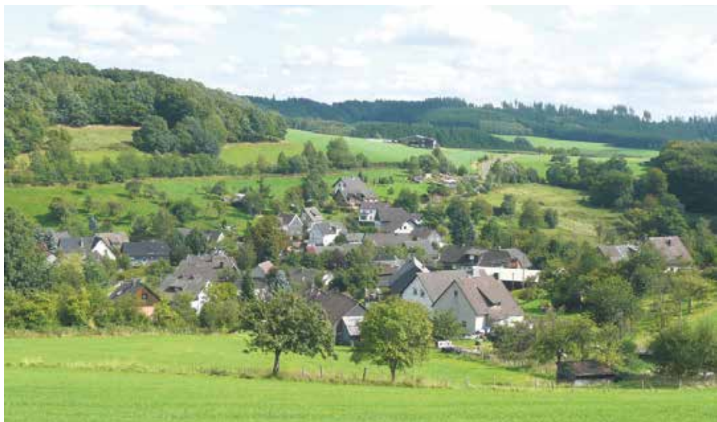
Der Dorfservice Oberberg unterstützt Dorfvereine und Dorfgemeinschaften des Oberbergischen Kreises weiterhin mit gebührenfreien Schulungen.

Die gebührenfreie Schulung erfolgt ab Mittwoch, 15. April, in sechs Fortbildungsmodulen mit vielen Beispielen, Vorlagen und Tipps für die direkte Anwendung im Vereinsalltag. "Ziel des Oberbergischen Kreises ist es, durch das Engagement der Dorfbewohnerinnen und Dorfbewohner in Zeiten des wirtschaftlichen und demographischen Wandels die ländliche Region l(i)ebenswert zu erhalten.