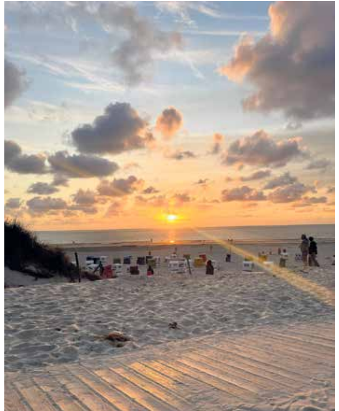
Inselfreizeit Langeoog.