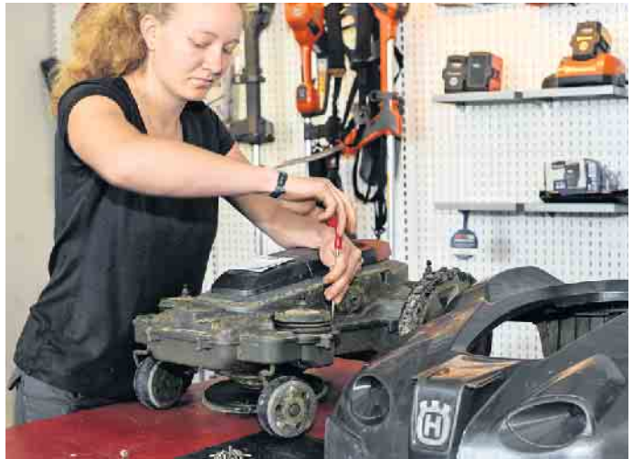
Bei mechatronischen Berufen stehen Wartung und Reparatur von Garten- und Outdoorgeräten im Mittelpunkt.

weiter. Da gut jeder vierte Betrieb in den nächsten fünf bis zehn Jahren einen Nachfolger oder Geschäftsführer suche, seien die Karriereperspektiven sehr gut. Unter www.greenbase.de etwa gibt es mehr Details dazu, zudem lassen sich hier örtliche Motoristenbetriebe finden. Ein Praktikum vor der Entscheidung für eine Berufsausbildung ist immer eine gute Idee. Angehende Fachkräfte in diesem Bereich werden spannende Entwicklungen hautnah miterleben: Der Wandel vom Verbrennungsmotor hin zu ökologisch nachhaltigen Antrieben sowie der Trend zu Robotertechnologie macht auch vor dieser Branche nicht halt und sorgt für neue Herausforderungen, gerade für die junge Generation. (DJD)