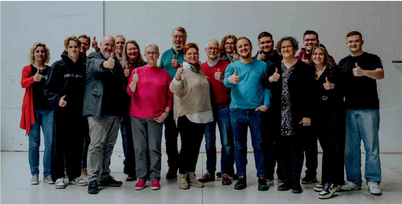
Gruppenfoto der diesjährigen Mitgliederversammlung Anfang März

von einheimischen Mitarbeitern vorgeschlagen und geleitet werden. Das Team aus Deutschland begleitet, unterstützt und stellt finanzielle Mittel bereit. Aufgrund des wachsenden Teams vor Ort wurden im Laufe des Jahres ein Co-Leiter und ein Sozialarbeiter eingestellt. Der Sozialarbeiter soll den Bewohnern im Slum helfen, die täglichen Probleme zu bewältigen und Unterstützung bei verschiedenen Belangen anzubieten. Aufgrund der Armut der Slumbewohner in Myanmar, die keinerlei Sozialleistungen erhalten,