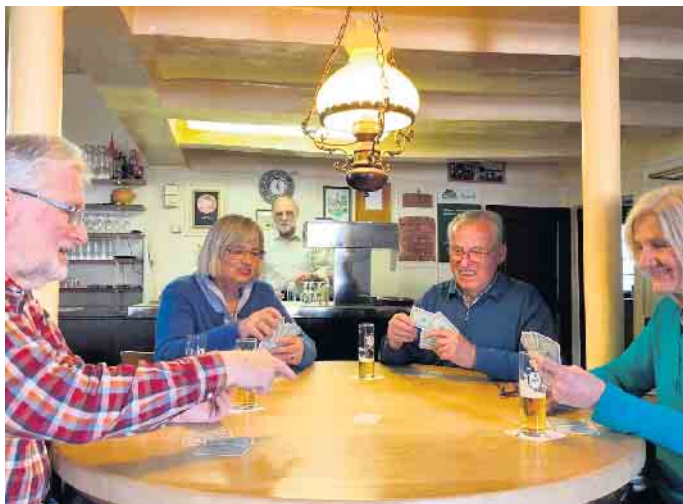
Doppelkopf-Turnier im Jägerhof.

vielfach variieren, werden vorab die „Turnierspielregeln im Jägerhof“ erläutert. Startschuss für die erste Spielrunde ist um 18 Uhr. Zum Turnier-Modus: Die Namen aller angemeldeten Spieler kommen in einen Lostopf. Pro Tisch werden vier bzw. fünf Spieler ausgelost. Nach einer Stunde Spielzeit wird der jeweilige Spielstand bekannt gegeben. Um ausgeglichene Chancen für alle durch eine möglichst große Spielermischung zu erreichen, werden danach neue Spieltisch-Besetzungen ausgelost. Nach der vierten Runde, also etwa um 22 Uhr, werden der Endstand ermittelt und die Siegerehrung vorgenommen.