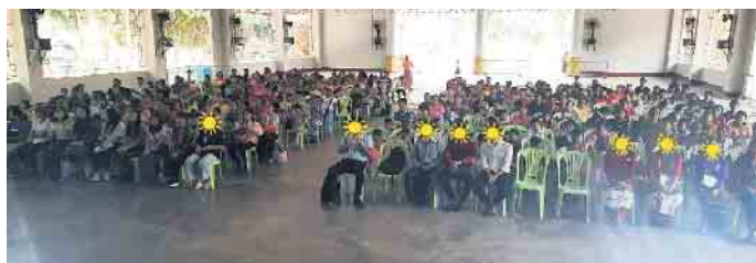
Beitrag eines Kindergarten beim Abschlussfeste Ende Februar in Yangoon

Die Arbeit des Vereins HelpMy e. V. wächst dynamisch in Myanmar