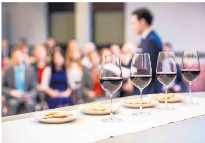
In Erinnerung an Jesu Tod

Einladung zu einem biblischen Vortrag in Bergneustadt