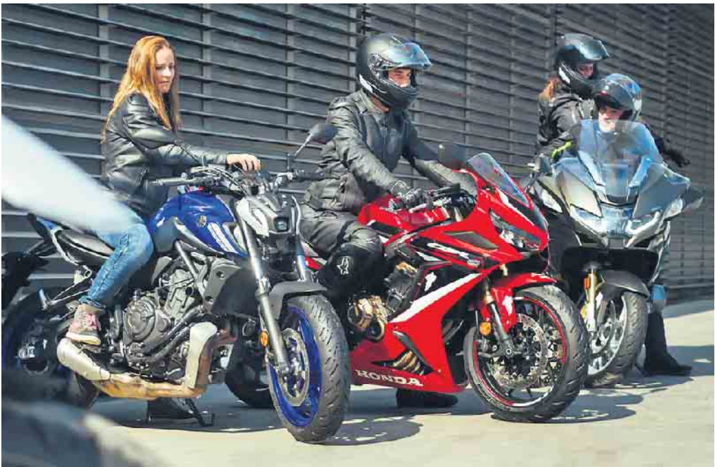
Die Freiheit auf zwei Rädern genießen - hochwertige und gut gepflegte Reifen sorgen dabei für ein sicheres Vergnügen.

bei neuen Gummis ist ein kurzes Anfahren empfehlenswert, um die Oberfläche etwas anzurauen. Zusätzlich empfiehlt etwa Michelin, den Fülldruck mindestens alle 14 Tage bei kalten Reifen zu prüfen. Nach ausgedehnten Touren ist etwas Pflege angesagt, um Reifen und Felgen sauber zu halten. Dauerhafter Kontakt zu Öl, Benzin, Lösungsmitteln und Chemikalien sollte in jedem Fall vermieden werden. Eine kurze Behandlung, zum Beispiel beim Entfernen eines Etiketts mit Bremsenreiniger, schadet dem Reifen jedoch nicht. Ebenfalls unbedenklich verwendet werden kann Shampoo - anschließend mit klarem Wasser gründlich abspülen. Wer zum Dampfstrahler greift, sollte einen Mindestabstand der Düse zu den Reifen von 15 Zentimetern einhalten, um Beschädigungen zu vermeiden. (djd)