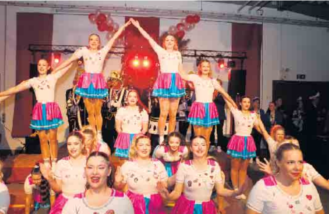
Große Garde der KG Tolle Elf Wildberg mit ihrem Showtanz „Sweet Candy“

Tollitäten und Tanzgruppen reichten sich bei der KPG-Party die Türklinke