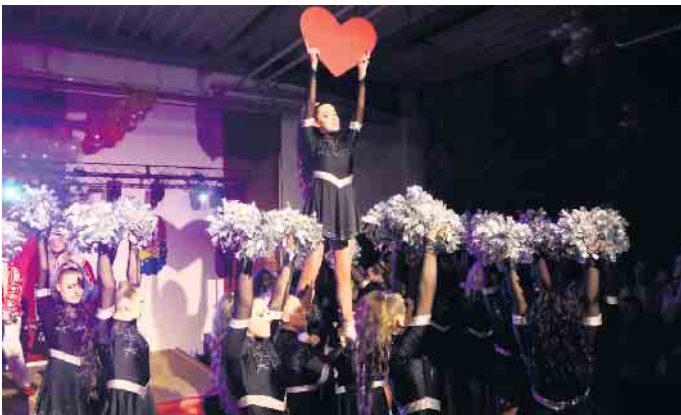
Auftritt der „Raketen“ vom VfR Marienhagen