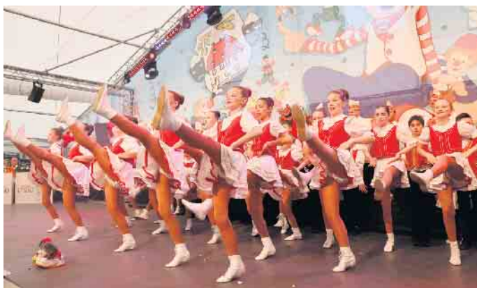
Tanz der „Pänz von der Burg“

Traditionell als Eisbrecher begeisterten die „Burgmäuse“, die jüngsten Tanzgarde der KG, mit einem flotten Auftritt. Ginczek schilderte, dass etwa ein Drittel der 33-köpfigen Truppe für die nächste Session in die Jugendgarde „Pänz von der Burg“ wechselt. Nachwuchsprobleme gebe es dennoch nicht - die Warteliste sei gut gefüllt. Für den Nachmittag und Abend hatte die KG ein opulentes Programm auf die Beine gestellt. Mit „1.000 Nächte“ stiegen die