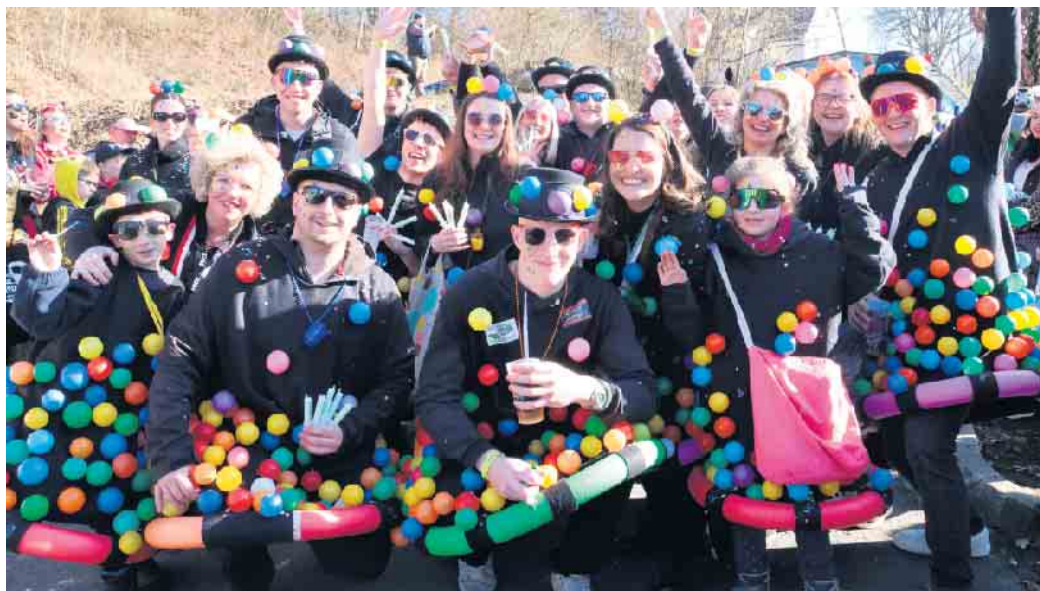
Die „Froschköpfe“ baden in bunten Bällen.