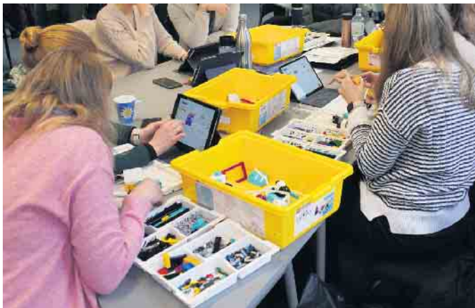
Die angehenden Grundschullehrkräfte entdecken vielfältige Möglichkeiten, mit den Robotik-Baukästen zu arbeiten.