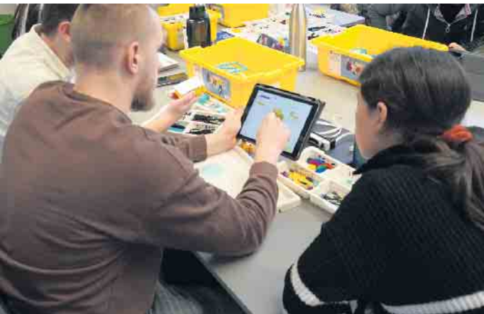
Das Programmieren können die angehenden Grundschullehrkräfte jetzt mit Hilfe der Robotik-Baukästen spielerisch im Unterricht vermitteln.

europaweit das größte Netzwerk zur Förderung des MINTNachwuchses. Das zdi-Zentrum investMINT Oberberg Oberbergischen Kreis ist seit 2011 Teil der Gemeinschaftsoffensive und fester Bestandteil des Bildungsnetzwerk Oberberg. In Kooperation mit Kindertagesstätten, Schulen, Unternehmen, Initiativen und Hochschulen im Oberbergischen Kreis stehen die jungen Fachkräfte von morgen im Mittelpunkt. Bei ihnen soll frühzeitig die Neugierde an Mathe, Informatik, Naturwissenschaften und Technik (MINT) geweckt werden. Davon profitiert der Oberbergische Kreis als Wirtschaftsregion mit vielen Talenten und weltweit gefragten Produkten; zukunftsorientiert und hochtechnologisch.