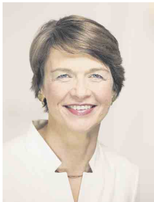
Elke Büdenbender