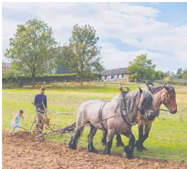
Bei gutem und trockenem Wetter im LVR-Freilichtmuseum Lindlar zu sehen: Feldarbeiten mit Pferden.