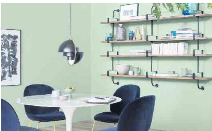
Mehr Mut zur Farbe: Das kreative Kombinieren von Wandfarben, Bödenbelägen und Möbeln verleiht dem eigenen Zuhause mehr Ambiente.

Wer hingegen kräftige Farbakzente setzen will, ist mit den „fruchtigen“ Tönen Amarena, Mango oder dem satten, beruhigenden Blau von Blueberry in der passenden Einrichtungswelt unterwegs. Die 32 Trendfarben aus der Kollektion von Schöner Wohnen-Farbe ermöglichen das Einrichten im eigenen Stil. Für ein unkompliziertes Verarbeiten und Verschönern sind die Dispersionsfarben fertig gemischt in unterschiedlichen Gebindegrößen im Fachhandel sowie in vielen Baumärkten erhältlich. Unter www.schoener-wohnen-farbe.com etwa gibt es mehr Details und Videos mit praktischen Tipps für das eigene Zuhause. Neben der Optik sind ebenso die inneren Werte wichtig. Daher enthalten die Wandfarben keine Konservierungsstoffe oder Lösemittel, sind für Allergiker geeignet und tragen das renommierte Umweltzeichen Blauer Engel. (djd)