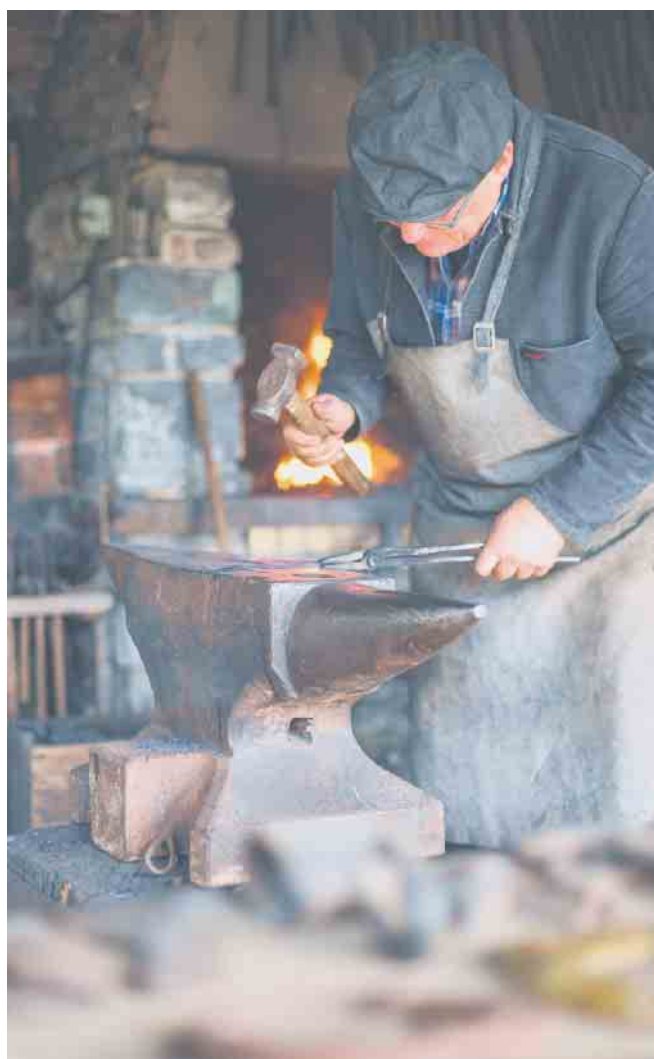
In der Schmiede erklingt das rhythmische Hämmern beim Saisonstart im LVR-Freilichtmuseum Lindlar.