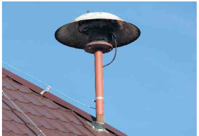
Am 12. März ist landesweiter Warntag.

Der Funktionalität von Cell Broadcast kommt aufgrund der besonderen Bedeutung im Warnmittelmix eine grundlegende Funktion