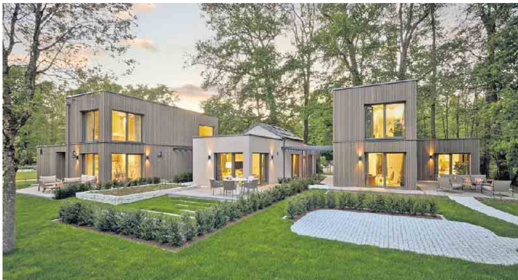
Kleine Fertighäuser überzeugen mit klarer Architektur, effizienter Bauweise und einer ansprechenden Optik.

Damit kleine Häuser gut funktionieren, muss der Grundriss effizient sein. Der vielgenutzte Wohnbereich bietet offen gestaltet mit Verbindung zur Küche ausreichend Bewegungsfreiheit. Bei Bad, Küche und Schlafzimmer zählen Funktionalität und ausreichend Stauraumlösungen. Durchdachte Räume können mehrere Funktionen erfüllen - etwa ein kombinierter Wohn-Ess-Bereich oder ein integrierter Arbeitsplatz. Für eine großzügige optische Wirkung ist der Übergang zwischen Innen- und Außenbereich entscheidend. Hannott ergänzt: „Gute Planung bedeutet, bereits bei der Grundrissgestaltung zu überlegen, wie Be-