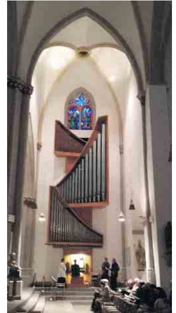
Stifts- und Pfarrkirche St. Peter.