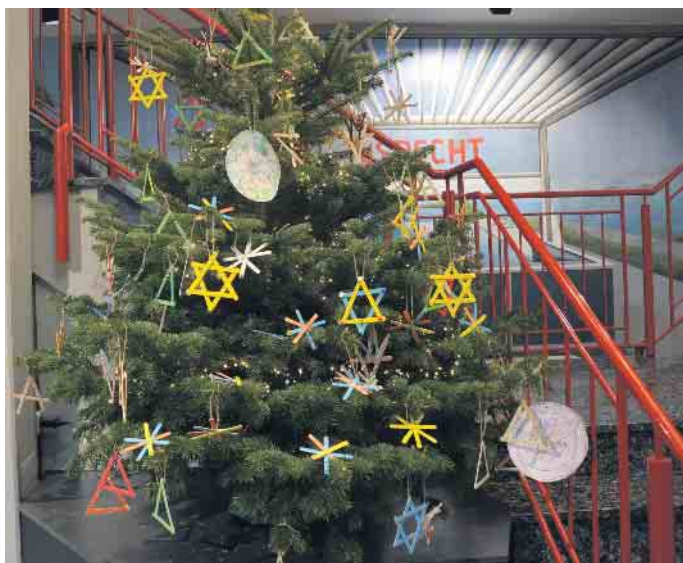
Von den Kindern schön geschmückt: der Weihnachtsbaum im Foyer der Fa. Specht

Die Umsetzung ist stets ein kleines Ritual. Den Baum und die Kerzen organisiert die Fa. Specht, für den festlichen Schmuck sorgen die Kinder. Begonnen werden die Bastelarbeiten schon im November. Und die Kinder haben immer neue kreative Ideen. Mal sind es aus buntem Filz fabrizierte Weihnachtssterne, mal kunstvoll bemalte Blumentöpfe, aus denen kleine Glocken gestaltet werden, mal werden Streichholzschachteln mit glitzerndem Papier in kleine Geschenkpakete verwandelt. In diesem Jahr hatten