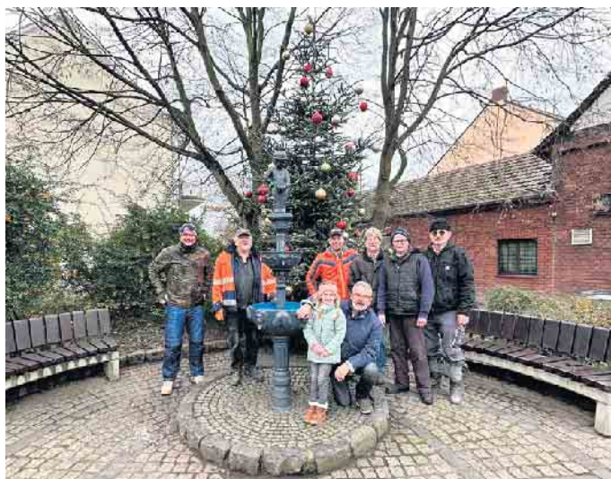
Die Arbeit ist getan. Zufriedene Bottemelechs Jonge warten auf das Christkind.

Zunächst stand der Gesang, mit dem sie 37 Jahre später den „Bonner närrischen Löwen“ gewannen, für die Gruppe im Vordergrund. Heimat und Tradition wurden aber wurden aber auch ganz groß geschrieben, denn die „Jonge“ kümmerten sich um viele Dinge im Dorfgeschehen! Sie sammelten Geld für den Erhalt