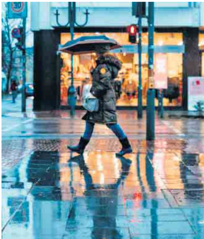
Entsprechend bekleidet ist der Besuch der Friedrich-Breuer-Straße auch bei Dauerregen kein Problem.