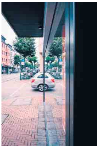
Zwei halbe Autos, oder?

Einjähriges Straßenfotografie-Projekt vorgestellt