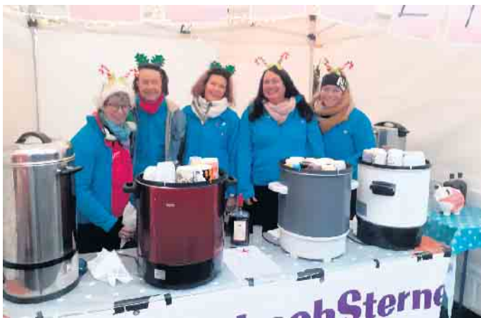
Expertinnen in Sachen Glühwein sind die Mühlenbachsterne.

Halle aufgebauter weihnachtliche Modellbahn der Familie Litzinger. Gern gesehene Gäste sind immer wieder die „Biker for Kids“ aus dem Rhein-Sieg-Kreis, die als Nikolaus verkleidet in größerer Anzahl mit ihren geschmückten, bunt blinkenden Motorrädern vorfahren. Die Gruppe besucht seit Jahrzehnten Einrichtungen für Kinder und freut sich immer darüber, hilfsbedürftigen Kids eine Freude zu machen. Auch der „Müldorfer“ Nikolaus drehte unentwegt seine Runden und hatte dabei immer ein offenes Ohr für die Wünsche der Kinder. Am frühen Abend gaben die „Montagsbläser“ der evange-