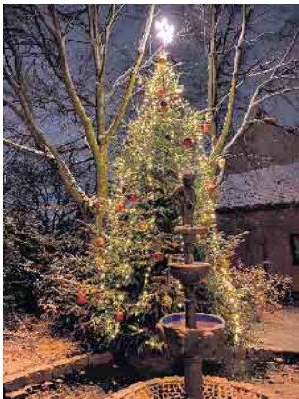
Ein schöner Baum, an dem sich Jung und Alt erfreuen können.