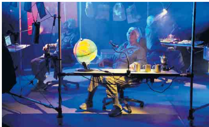
Wo ist „Laika“? Bisher war es eine vergebliche Suche. Die Crew ist enttäuscht.