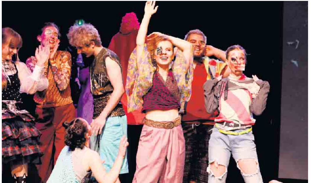
„Perfor ME“: Junge Menschen auf der Suche nach dem wahren Ich.

Am 30. Januar findet von 9.30 bis 19.30 Uhr das nächste Theaterlabor, eine regelmäßige Fortbildungsveranstaltung des Marabu für Lehrerinnen und Erzieherinnen statt. Die Fortbildungen sind auch Bestandteil der Fortbildungsveranstaltungen für Lehrerinnen in NRW und können jeweils einzeln als Termin gebucht werden. Schwerpunkt dieser Fortbildung ist Choreographie und Tanz in der theaterpädagogischen