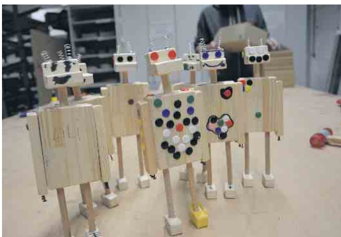
Das fertige Werk: eine stattliche Roboter-Armee

„Und da hat das Baumschmücken bei der Fa. Specht auch für uns Tradition und gehört einfach dazu.“ CSH