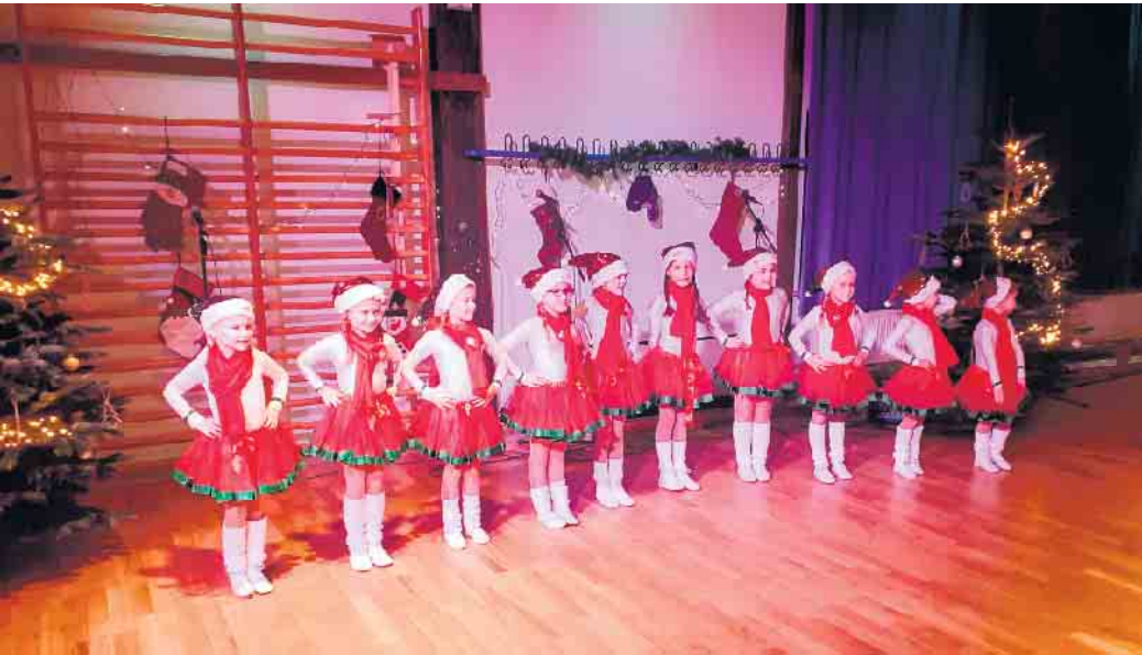
Ungewöhnliches Outfit, aber die Minis der Prinzengarde Vilich-Müldorf fühlen sich auch als kleine Nikoläuse einfach wohl.

Vorweihnachtliche Veranstaltungen an und in der Mühlenbachhalle