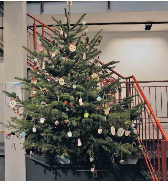
Von den Kindern prächtig geschmückt: der Weihnachtsbaum im Entrée der Fa. Specht.

Da steht er wieder, der festlich geschmückte Weihnachtsbaum im Entrée der Fa. Specht GmbH. Wunderschön dekoriert haben ihn auch in diesem Jahr Kinder des Kinderheimes Maria im Walde. Es ist schon längst ein Ritual, das seit fast einem Vierteljahrhundert immer zum Beginn der Adventszeit in den Räumen der Fa. Specht stattfindet. Den Baum und die Lichterketten organisiert die Fa. Specht, für den festlichen