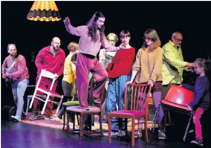
Sich „ZusammenRaufen“ erfordert sehr viel Arbeit.

Generationsübergreifende und musikalische Aufführungen