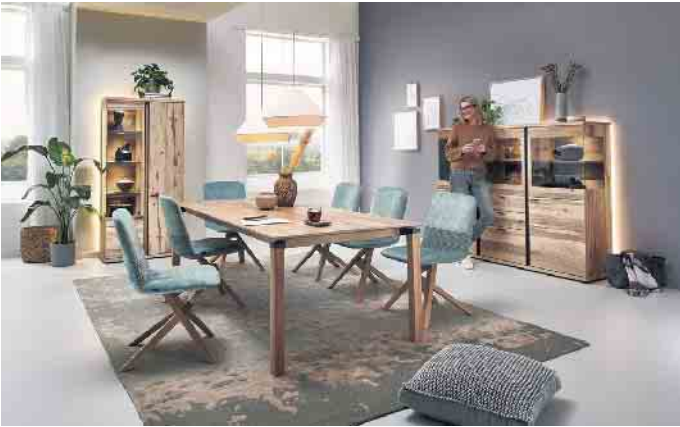
Zeitlos schöne Qualitätsmöbel bereiten ihren Besitzern lange Freude.