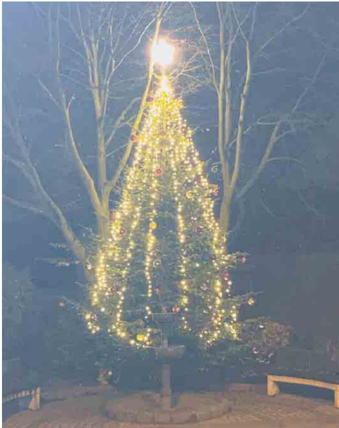
Der Baum brennt, Weihnachten kann kommen.

den Erhalt der Mühlenbachhalle, restaurierten das Ehrenmal auf dem Friedhof sowie das Heiligenhäuschen an der Burbankstraße, dem sie auch eine neue Pieta stifteten, da das Original gestohlen wurde. Zur Bonner 2000-Jahrfeier schenkten sie ihrem Heimatort einen Brunnen, der auf dem Platz vor der Dorfschänke steht und im Sommer ein Anziehungspunkt für die Bevölkerung ist. Die Pflege des Brunnens und der daran angrenzenden Begrünung übernahmen die Jonge auch. Seit 20 Jahren ist der Brunnen auch Standort eines Weihnachtsbaumes, den die BMJ wiederkehrend als den Schönsten im Stadtbezirk Beuel be-