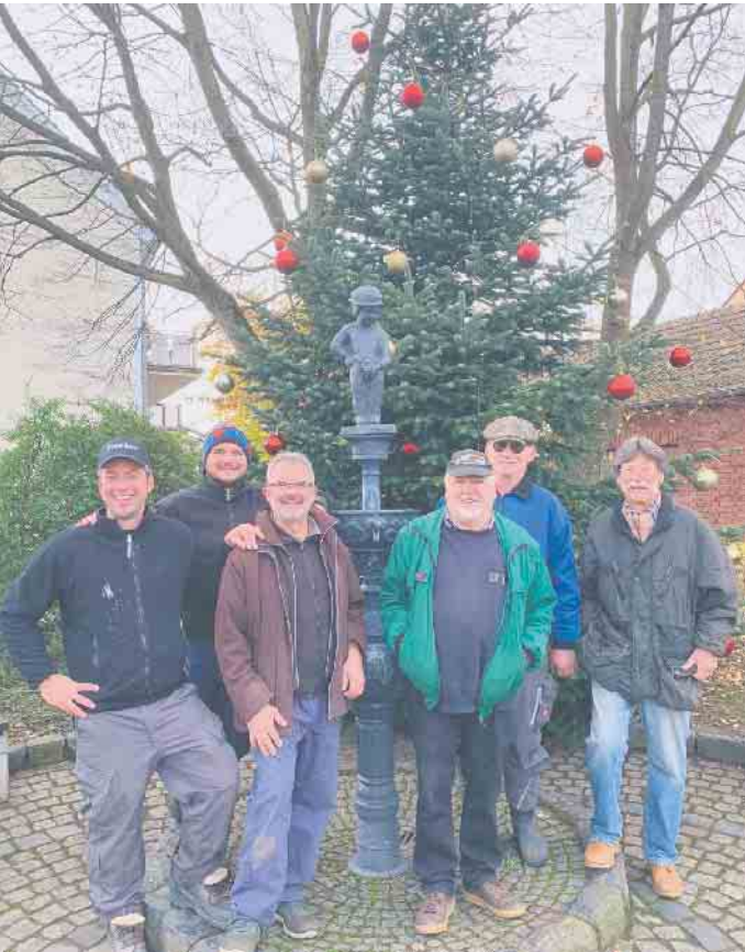
Die Arbeit ist getan, der Baum steht.

Eine beispielhafte Aktion der Bottemelech’s Jonge