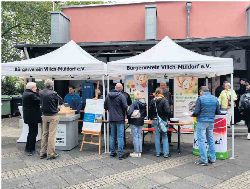
Beratung vor Ort: Der Bürgerverein Vilich-Müldorf macht es möglich.

Zwischendurch machte Kasperle immer wieder seine Späße. Zu Gast waren auch die MINT-kids, die mit den Kindern kleine Experimente durchführten, beispielsweise wurden aus Zitronen Batterien gebaut.