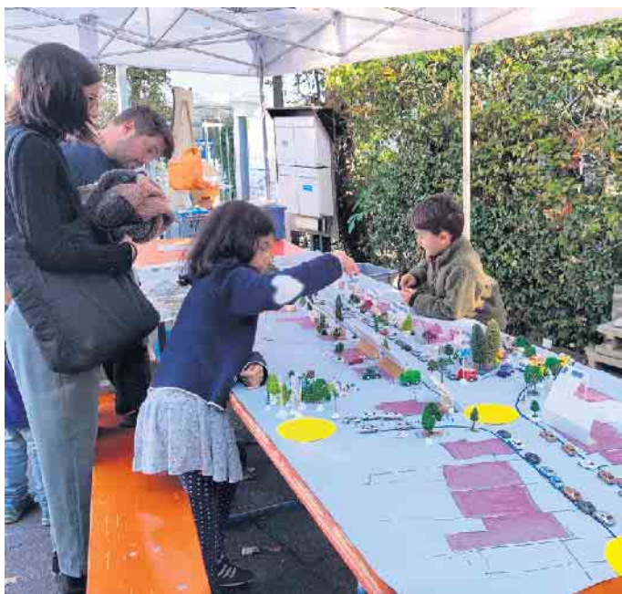
Kids lernen spielend die Umwelt zu verstehen und zu schützen.

Mit Blick in die Zukunft kündigt der Bürgerverein bereits den 11. KlimaTag an, der am 22. März 2026, dem internationalen Weltwassertag, stattfinden wird. wm