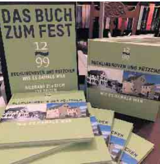
Ein Exemplar des Buches würde auch gut unter den Weihnachtsbaum passen.

Das Buch ist aufwendig gestaltet - mit Hardcover und Lesebändchen - und umfasst 116 Seiten. Die Macher wollten weniger ein Geschichtsbuch mit wissenschaftlichem Anspruch konzipieren, sondern historische und aktuelle Fotos in den Vordergrund stellen. Mit ihnen wird eine Zeitreise in Straßen und an Orte möglich, die in den letzten 100 Jahren große Veränderungen erfahren haben. Ergänzt wird der Bildband um eine Darstellung der Vereine der Orte Pützchen und Bechlinghoven.