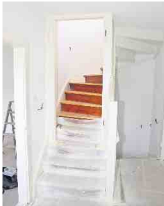
Der Renovierungs- und Modernisierungsbedarf älterer Immo-bilien ist nicht immer auf den ersten Blick zu erkennen. Bei Kaufabsicht lohnt es sich daher, einen unabhängigen Sachverständigen einzuschalten.

mmobilie immer ein großzügiges finanzielles Polster eingeplant werden. So lassen sich auch unvorhergesehene Renovierun-gen oder zusätzliche Komfortwünsche abdecken, ohne in finanzielle Schieflage zu kommen. (DJD)