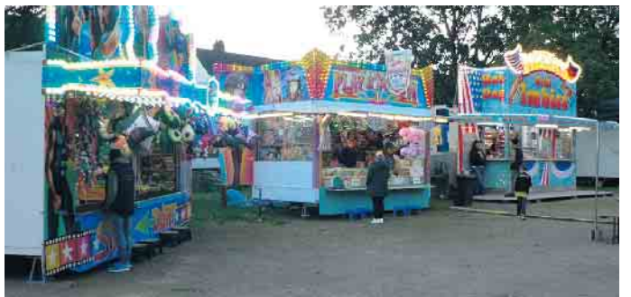
Kirmesatmosphäre in Geislar: Nur die Besucher fehlten nach einer Regenschauer.

das leibliche Wohl bildeten den Rahmen für den Getränke-stand und das große Zelt. Freitagabend legte DJ Basti Weeber bei der Open-Air-Party auf und heizte den überwiegend jüngeren Besuchern so richtig ein. Samstags standen die wieder entdeckte Schürreskarren-Rallye sowie eine weitere Open-Air-Party auf dem Programm. Höhepunkt des Sonntags war erneut die Verbrennung der Figur, die für alles Böse verantwortlich ist - der Paias musste dran glauben. Der Dorfplatz „An de Löng“ war wieder Schauplatz der Ramersdorfer