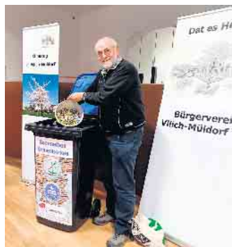
Eine Kronkorkensammlung, für die eine Box bereitsteht, wurde gestartet. Der Erlös kommt krebserkrankten Kindern zugute.

Die Kleidertauschaktion wurde ebenfalls gut angenommen. Bei der Produktion von Kleidung wird viel Wasser verbraucht, viel CO 2 freigesetzt und viel Chemie genutzt. Wenn die Kleidung nicht mehr getragen wird, weil die Farbe nicht mehr gefällt oder die Größe nicht mehr passt, dann ist sie meist noch nicht abgetragen. Ziel des Kleidertausches ist es, sie weiterzugeben an jemand, der sich darüber freut und dadurch Rohstoffe zu sparen. Weiterhin wurde eine Kronkorken-Sammeltonne aufgestellt und „eingeweiht“. Der Erlös aus der Verwertung kommt dem Förderkreis für krebserkrankte Kinder und Jugendliche Bonn e. V. zu Gute.