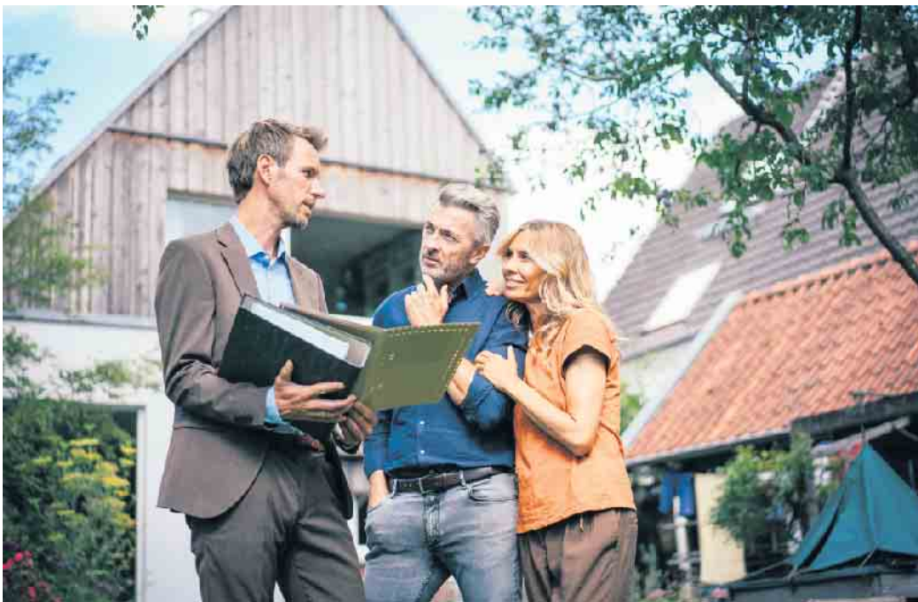
Bei der Besichtigung eines gebrauchten Hauses sollte man nicht alleine auf den Augenschein vertrauen, sondern die Immobilie mit sachverständigem Rat unter die Lupe nehmen lassen.

Auch wenn eine ältere Immobilie auf den ersten Blick einen sehr guten Eindruck macht, können sich unter der Oberfläche versteckte Schäden verbergen. Dazu gehören etwa unsichtbare Feuchteprobleme, eine veraltete, schadenanfällige Haustechnik oder Bauschadstoffe aus früheren Jahrzehnten. Mithilfe eines unabhängigen, erfahrenen Bau-sachverständigen lässt sich der Sanierungs- und Modernisie-rungsbedarf realistisch ein-schätzen. Unter www.bsb-ev.de