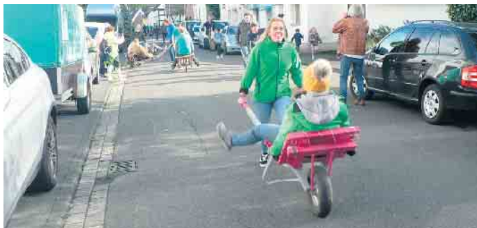
Die Tänzerinnen der Dilledöppchen erkämpften sich den zweiten Platz.

Schüürekirmes. Alte Bräuche und Traditionelles kennzeichnen diese Veranstaltung. Die Schüür (Scheune) gibt es nicht mehr, aber dem veranstaltenden „Schüüre-club“ war es gelungen, auf dem kleinen Platz eine sehr gemütliche Atmosphäre zu schaffen. Traditionell eröffneten die Junggesellen am Samstag mit der Verteilung ihrer köstlichen Erbsensuppe die Veranstaltung, die eigentlich keine herkömmliche Kirmes ist. Nur für die Jüngsten fanden verschiedene Aktionen statt und eine Hüpfburg lud zum lustigen Hüpfen ein. Nachmittags wurde auch schon