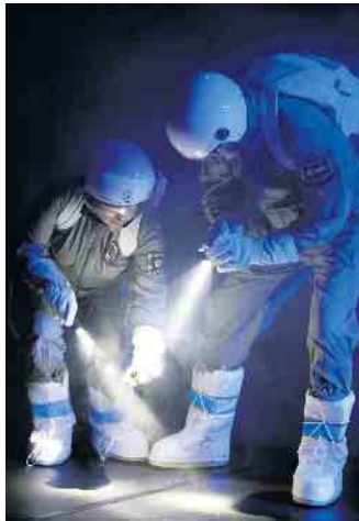
Intensive Suche nach Laika, aber wieder erfolglos.

am 1. November um 15 Uhr, 2. November um 10 Uhr und 3. November um 10 und 19 Uhr. Der Weltraum. Unendliche Weiten. „Mission Laika“ (ab 6 Jahre) startet am 5. November (15 Uhr), 6. November (10 Uhr) und 7. November (9 und 11 Uhr) ins All auf der Suche nach Laika, dem ersten Lebewesen, das im Orbit die Erde umkreiste, lange bevor Menschen ihrem Weg folgten. Die abenteuerliche Reise führt vorbei an Sonne, Mond und Sternen über die Milchstraße hinaus in ferne Galaxien. Vergiftete Äpfel, blutende Schuhe, böse Stiefmütter - Märchen sind oft grausam. Die Kinder in den Märchen haben mit bösen Mächten zu kämpfen und schwierige Aufgaben zu lösen, bevor am Ende alles gut werden kann. In „Good Game Gretel“ (ab 10 Jahre) machen sich zwei Performer*innen auf die Spur von Hänsel und Gretel und begeben sich in die düstere Märchenwelt.