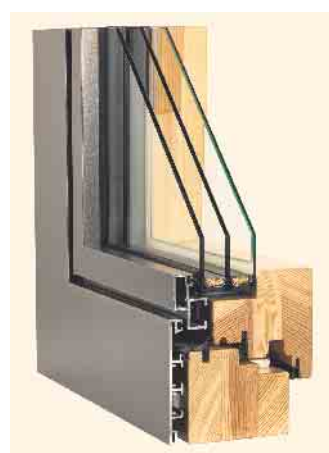
Das Beste zweier Welten miteinander verbinden: Querschnitt durch einen Holz-Aluminium-Fensterahmen.

Außentemperaturen schützt eine Aluminium-Verschalung zudem vor großer Erhitzung des Kunststoffs. Die Witterungsbeständigkeit von Aluminium ist auch bei Holz-Aluminium-Kombinationen ein Pluspunkt. Sie gelten als sehr wartungsarm da eine mögliche Nachbehandlung des Holzes durch Streichen entfällt. Wer auf Holz-Behaglichkeit im Innern und architektonische Moderne nach außen setzt, für den mögen Holz-Aluminium-Kombinationen genau das Richtige sein - mit der ästhetischen Haptik des Naturprodukts auf der Innenseite und dem Metall-Look nach außen. „Sei es die Investition in Holz-, Aluminium- oder Kunststoff-Rahmen: Wer modernisiert oder baut, dem stehen hochwertige Produkte aus diesen Materialien zur Verfügung. Gezielter Fenstertausch ist ein zentrales Element, damit Deutschland seine Klimaziele im Gebäudebereich erreicht. Daher sind auch, trotz jüngster Anpassungen in der Bundesförderung für effiziente Gebäude