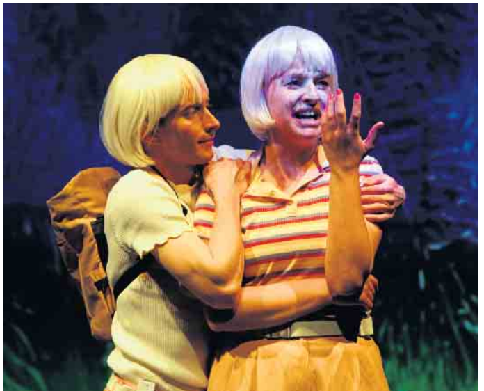
Zwei Menschen machen sich auf die Spur vom Hänsel und Gretel.

Die Menüs gibt es in vielen Gebieten tiefkühlfrisch oder täglich heiß auf den Tisch. Auch für spezielle Ernährungsanforderungen bieten wir eine Vielzahl köstlicher Gerichte an. Lassen Sie sich dazu gerne von Birgit Inwich persönlich beraten. Rufen Sie uns an.