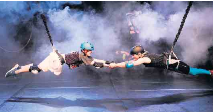
„Komme etwas näher“! Auf der Marabubühne: Der Versuch, Hass und Gewalt zu überwinden.

herbringen und die man festhalten kann ohne auseinanderzudriften, wie die Sterne im Universum. Das JEM macht sich auf die Suche nach den Geschichten, die Halt geben gegen die Fliehkräfte da draußen, die den Feindseligkeiten, dem Hass und der Gewalt etwas entgegensetzen und daran erinnern, was es heißt, ein Mensch zu sein. Das Junge Ensemble Marabu wird gefördert vom Land NRW im Rahmen der Konzeptionsförderung 2023 - 2025 des Ministeriums für Kultur und Wissenschaft des Landes NRW und der Stadt Bonn. wm