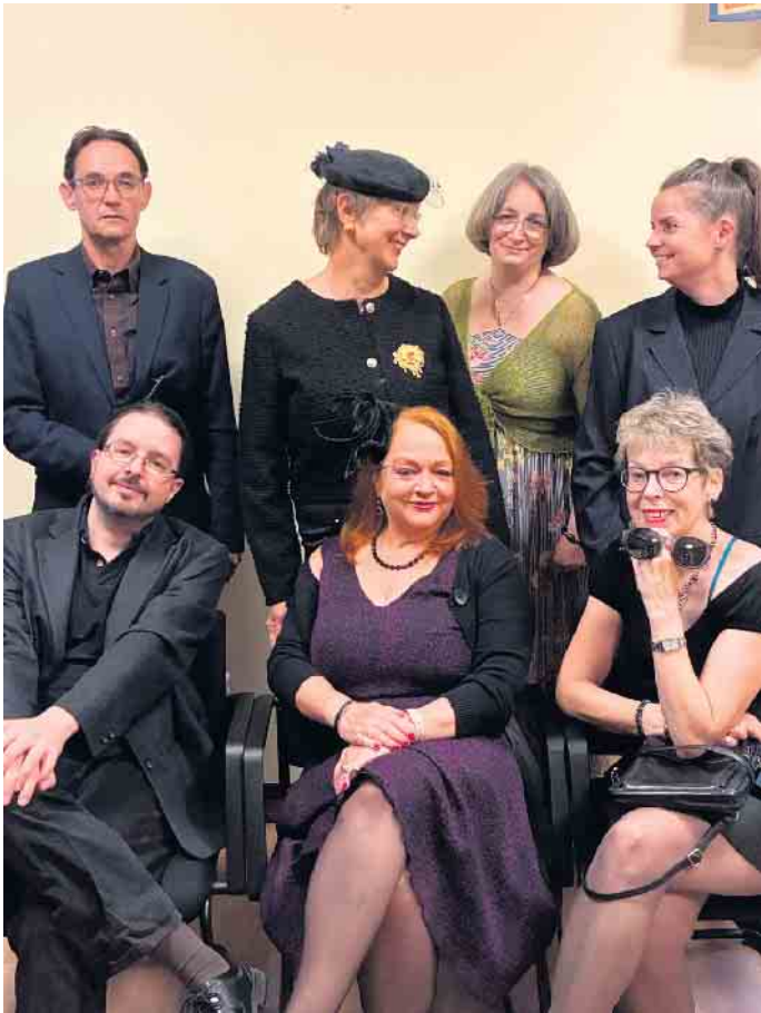
Das Ensemble „theater vimue“ freut sich auf die Aufführungen in der Mühlenbachhalle.

Vilich-Mueldorf. Das „theater vimue“, die Theatergruppe des Bürgervereins Vilich-Müldorf, kehrt im Oktober auf die Bühne in der Mühlenbachhalle zurück. Nach der erfolgreichen Premiere im vergangenen September wagt sich das Ensemble an sein zweites Stück. Es führt die rabenschwarze Komödie „Eine Mordsbeerdigung“ von Stefan Altherr am 24., 25. und 26. Oktober in der Mühlenbachhalle auf. Das „theater vimue“, „vimue“ steht für Vilich-Müldorf, gibt es seit Anfang 2023. In dem aktuellen Stück treten bekannte Gesichter aus dem Vorjahr auf, ergänzt durch neue Darsteller*innen aus Bonn und Sankt Augustin. Thomas Spillecke, der auch schon für die Sieglarer Bühnengesellschaft inszeniert hat und selbst als Schauspieler aktiv war, hat die Spielleitung übernommen und probt mit den acht Mitwirkenden jeden Montag in der Mühlenbachhalle. Die „Mordsbeerdigung“ bringt die drei ungleichen Schwestern Anna, Bianka und Doris bei der Beisetzung ihres Vaters wieder zusammen - und nichts läuft, wie es soll. Ein Sarg mit falscher Leiche, ein Pfarrer, der ausfällt und von einer überforderten Trauerrednerin ersetzt wird, ein unbekannter Trauergast, der einiges durcheinander wirbelt, eine zwielichtige Bestatterin: Das sind die Zutaten für eine Komödie mit bissigem Hu-