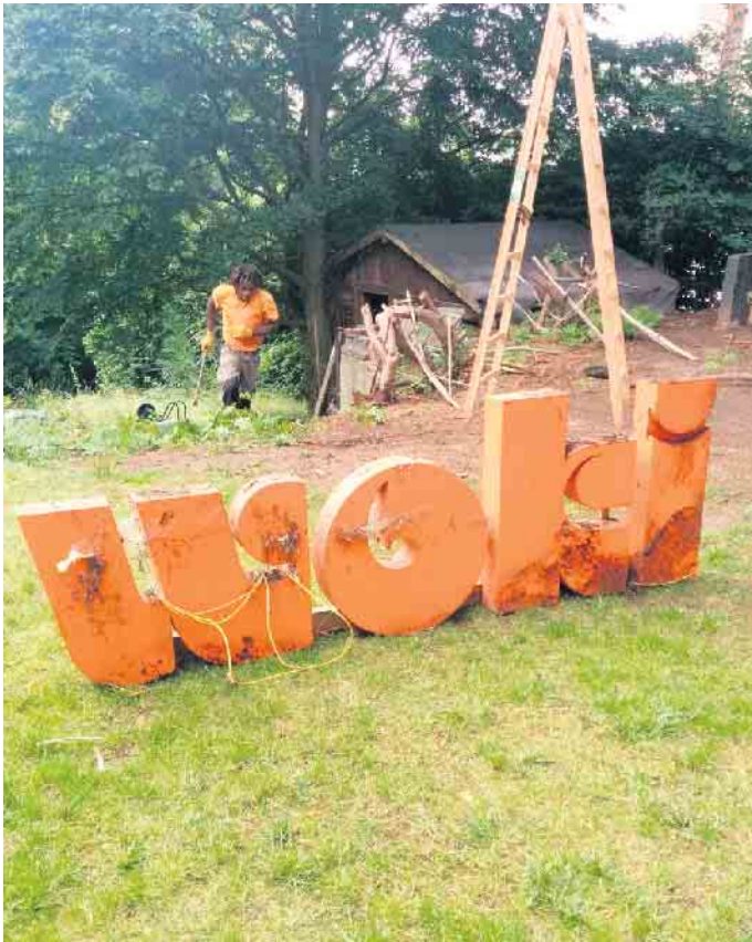
Der WOKI-Schriftzug nach der Demontage.

Das ErlebnisCenter in der Gangolfstraße ist mehr als eine Bankfiliale - es ist ein Ort der Begegnung, Inspiration und Beratung. Dass hier nun das WOKI wieder leuchtet, ist ein sichtbares Bekenntnis zur regionalen Identität. wm