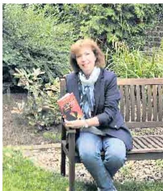
Karin Büchel schildert in ihrem neuen Buch Luzies Schicksal und beleuchtet die Stärke der Mutter.

Karin Büchel startet Lesereise mit ihrem neuen Buch