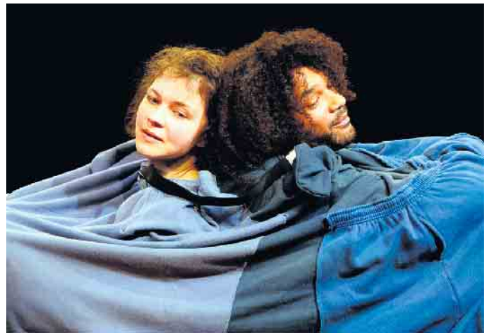
„Genauso, nur anders“, aber was unterscheidet uns?