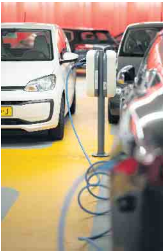
Die Elektromobilität nimmt auch in Deutschland langsam Fahrt auf: Die Zahl der Zulassungen weist steil nach oben.

www.kupfer.de/elektromobilitaet gibt es dazu mehr Wissenswertes und Hintergrundinfos. Allein ein Lithium-Ionen-Akku besteht zu rund 18 Prozent aus Kupfer, hinzu kommen die Wicklungen in den Elektromotoren, das Hochvoltbordnetz, die Leistungselektronik und mehr. Das Metall spielt wegen seiner guten Stromleitungseigenschaften aber nicht nur im Fahrzeug selbst, sondern auch beim Aufbau der Lade-Infrastruktur eine Hauptrolle. Denn die Verteilung von Strom aus erneuerbaren Energien erfordert einen Ausbau der Stromnetze - und auch in den Ladestationen läuft nichts