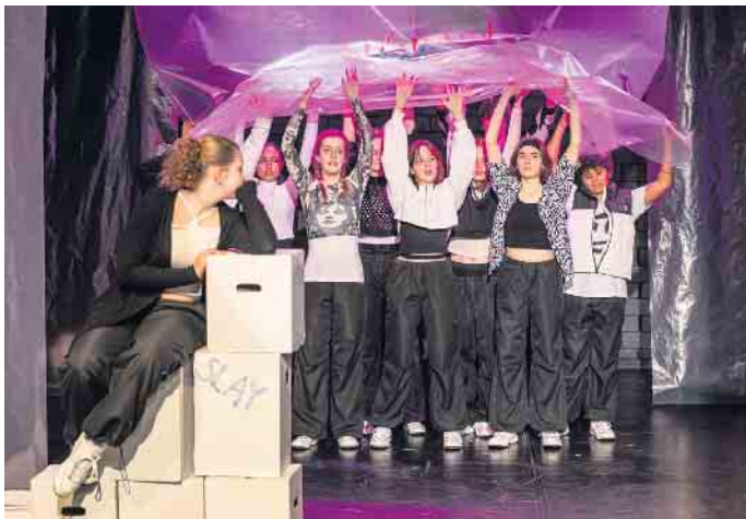
„Angry baby one more time!“ Zwölf Jugendliche sind wütend und suchen die Identifikation mit ihrer Generation.

Aufführungen im Theater Marabu zum Monatsende