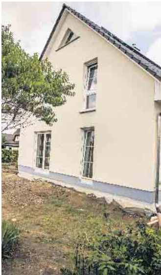
Wer sich für ein Haus auf Erbbau-land interessiert, sollte sich über die Vor- und Nachteile sowie die Konditionen des Erbpachtvertrags sehr genau informieren.

stückspreise. Künftige Entwicklungen lassen sich aber nur schwer vorhersagen. Was ist beim Kauf eines Bestandshauses auf Erbpachtgrund zu beachten? Der Erwerb eines bestehenden Hauses auf Erbpacht ist zumeist günstiger als der Kauf inklusive Grundstück. Bei alten Verträgen sind die jährlichen Zahlungen oft gering. Wichtig ist die Restlaufzeit: Wird danach ein Anschlussvertrag geschlossen, orientieren sich die Zinsen am aktuellen Grundstückswert und können um das Zehnfache höher als bisher liegen. Im schlimmsten Fall wird der Vertrag nach Ablauf nicht verlängert und der Hausbesitzer erhält nur eine Entschädigung für das Haus. Was sollte vor dem Vertragsabschluss beachtet werden? Erbpachtverträge sind komplex und sollten daher vorab genau geprüft werden, am besten mithilfe eines versierten Vertrauensanwalts. Unter www.bsb-ev.de gibt es Infos zu Beratungsangeboten und Adressen in ganz Deutschland. (DJD)