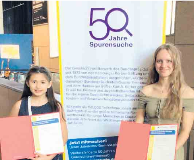
Die Preisträgerinnen nach der Urkundenvergabe im Haus der Geschichte

Vier Schülerinnen aus dem Sankt-Adelheid-Gymnasium gewinnen Landes- und Förderpreise