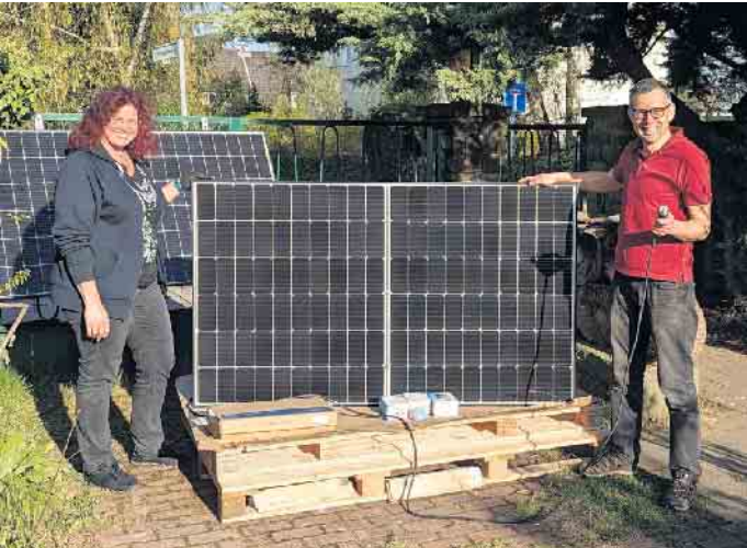
Diese Balkonanlage wird verlost.

Verlosung des Klimatopfes und Ausstellung abstrakter Malerei