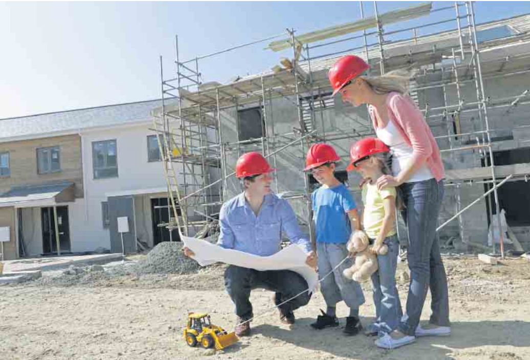
Das Bauen auf einem Erbpachtgrundstück kann interessant sein, um mit weniger Eigenkapital ins Eigenheim zu starten.

Bauen auf Erbpacht: Das müssen Immobilieninteressierte wissen