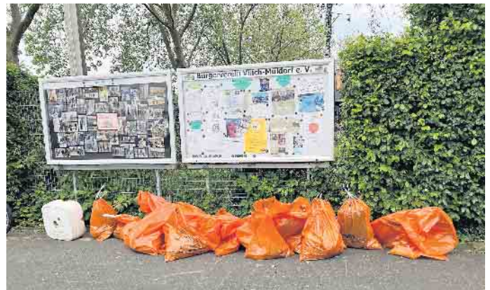
Ergebnis einer Müllsammlung durch Vilich-Müldorfer Kinder.

Vilich-Müldorf. Der Bürgerverein Vilich-Müldorf (BV) hat beim VOR-AUSDENKER-Wettbewerb der Landesbausparkasse Münster durch das Voting seiner Mitglieder und Freunde ein Preisgeld in Höhe von 2.500 Euro gewonnen.