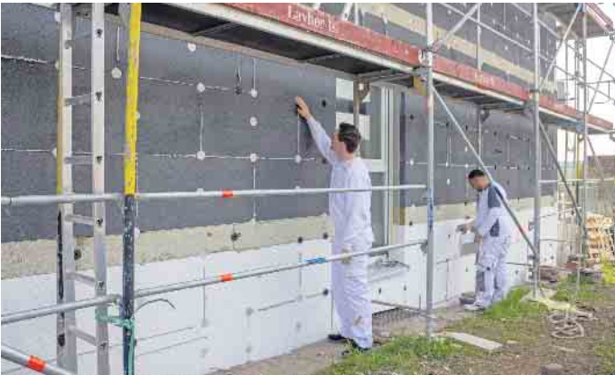
Angesichts hoher Energiepreise amortisiert sich das energetische Sanieren noch schneller.

Als Voraussetzung für eine dauerhaft wirksame Dämmung gilt, dass die Sanierung von erfahrenen Fachbetrieben geplant und ausgeführt wird. Energieberater begleiten den Prozess zusätzlich und können einen individuellen Sanierungsfahrplan aufstellen, der exakt für die vorhandene Bausub-