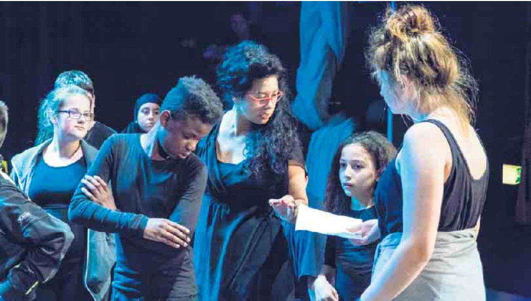
Schauspielkurse des JTB