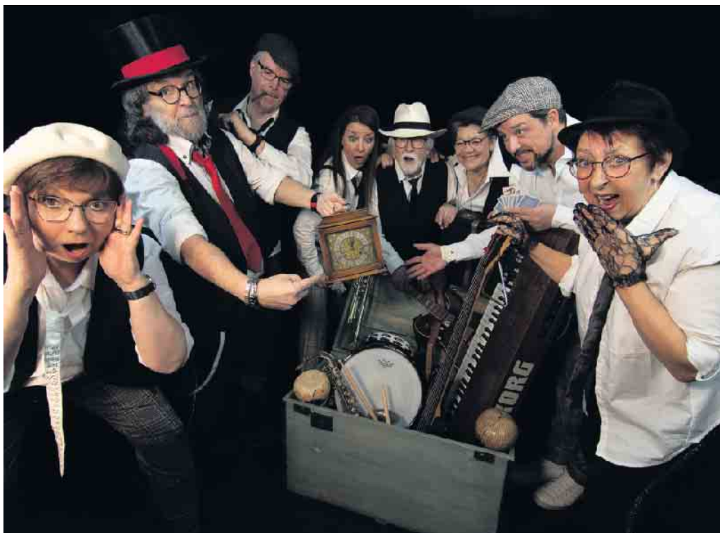
„Sing Sing“ hat sich neu formiert. Künftig kann man die Gruppe „nur“ als Chor oder mit Band erleben.