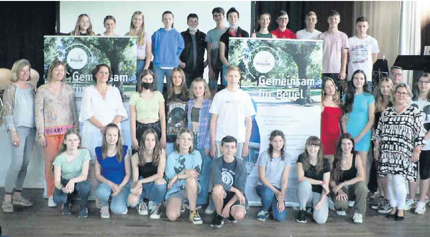
Lernpatinnen und -paten vor dem Start in das neue Betreuungsjahr.

Die Johannes Nepomuk Stiftung erweitert ihr Lernpatenprojekt