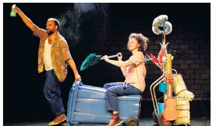
Das Theater ist sauber. Jetzt kommt der Spaß!