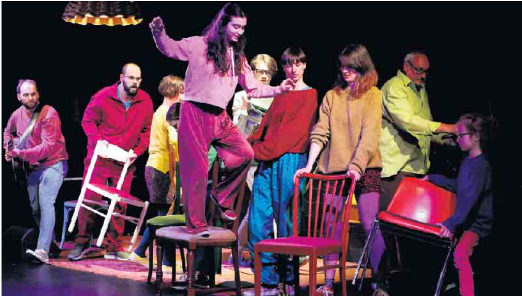
Alle unter einen Hut zu bringen ist nicht einfach. Da heißt es: Zusammenraufen.