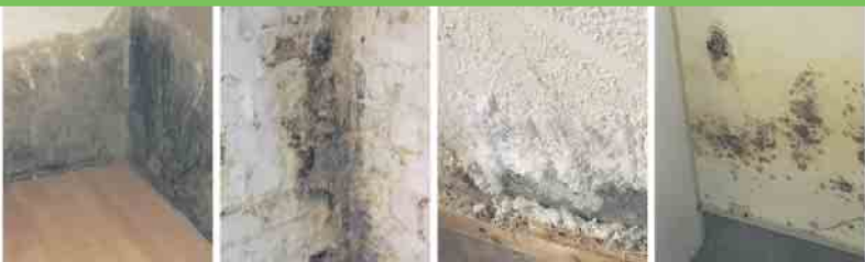
Defekte Horizontalsperre Querdurchfeuchtung Ausblühungen Schimmelbefall

nährstoffarmen Böden kann sich eine größere Vielfalt an Kräuterarten etablieren. Neben dem Wiesenprogramm engagiert sich die Stadt Bonn mit zahlreichen weiteren Maßnahmen für die Förderung der biologischen Vielfalt. Dafür wurde Bonn im bundesweiten Labeling-Verfahren mit dem Label „StadtGrün naturnah“ in Gold ausgezeichnet. Interessierte finden weitere Informationen unter www.bonn.de/stadtgruen-naturnah .