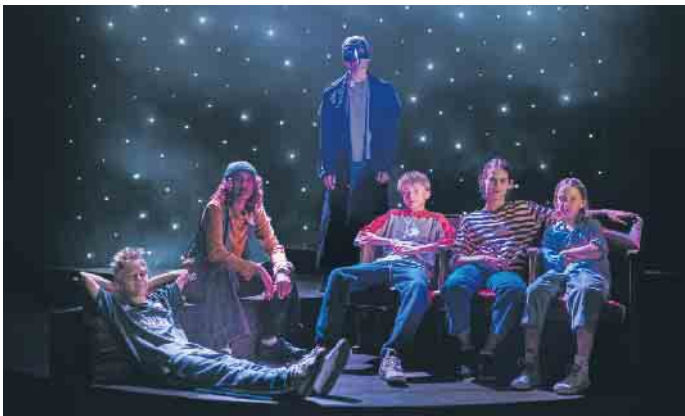
„Herr der Diebe“ im JTB

kleinen Diebstählen über Wasser. Angeführt wird sie von einem geheimnisvollen Jungen, der sich selbst „Herr der Diebe“ nennt. Er scheint nicht nur mutig und klug zu sein, sondern auch ein großes Geheimnis zu hüten. Als er eines Tages einen außergewöhnlichen Auftrag annimmt - den Diebstahl eines hölzernen Flügels aus einem alten Haus -, nimmt das Abenteuer eine magische Wendung. Denn der scheinbar harmlose Auftrag führt die Kinder auf die Spur eines mystischen Karussells, das die Macht besitzt, Menschen älter oder jünger zu machen - ein verlockendes Versprechen, aber auch eine große Gefahr. Während sich die Kinder immer tiefer in das Rätsel um den Auftraggeber, den „Conte“, verstricken, müssen sie erkennen, dass Mut, Vertrauen und Freundschaft oft der einzige Kompass sind, wenn alles andere ins Wanken gerät. Marcel Höfs inszeniert das Stück mit Kindern aus dem Nachwuchsensemble und dem Profiensemble des JTB, für Publikum ab 8 Jahren, und nimmt das Publikum mit auf eine spannende Reise in ein magisches Venedig, irgendwo zwischen Fantasie und Realität. „Herr der Diebe“ von Cornelia Funke feiert am Samstag, 27. und Sonntag, 28. September, im Telekom Forum Premiere. Anschließend steht das Stück regelmäßig auf dem Spielplan des JTB. Termine, Karten und weitere Informationen finden Sie unter www.jt-bonn.de .