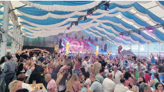
Im letzten Jahr sorgten u.a. „Die Köbesse“ für Partystimmung in der Bayernfesthalle.

Der Rheinische Abend am Sonntag, 14. September, ist inzwischen eine Tradition auf Pützchens Markt. Mitbegründer dieses Events war der Freundeskreis Pützchens Markt e. V. Um 17:30 Uhr beginnt das kostenlose Programm in der Bayernfesthalle. Es treten dort die rheinischen Mundartgruppen