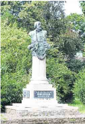
Das restaurierte Kinkel-Denkmal mit neuen Reliefplatten im Sockel.

Oberkassel. Am 21. September, 18 Uhr, findet in der Alten Evangelischen Kirche, Zipperstraße, in Bonn-Oberkassel ein Festakt zur Wiederherstellung des Kinkel-Denkmals statt. Die Arbeitsgemeinschaft im Heimatverein Oberkassel wird dabei allen Beteiligten herzlich danken für den Ersatz der gestohlenen Reliefplatten, die Restaurierung der Büste und die umfassende Reinigung des Denkmalssockels. Im Festakt werden auch Johanna und Gottfried Kinkel als wichtige Kämpfer für die Demokratie in Deutschland gewürdigt. Eine Besonderheit beim Festakt sind Lieder von Johanna Kinkel mit Klavierbegleitung. wm