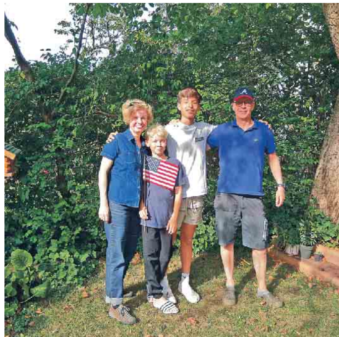
Gastfamilien schenken Austauschschüler/innen ein Zuhause auf Zeit.

Das Besondere: Mit Experiment können fast alle Gastfamilie werden! Egal ob auf dem Land oder in der Stadt, ob alt oder jung, ob