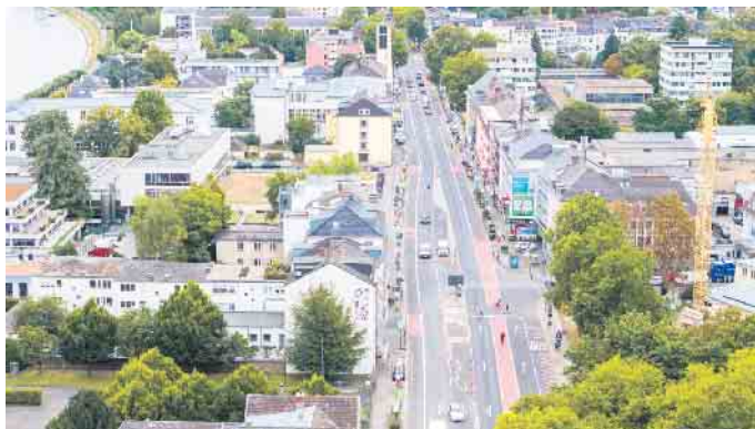
Aus der Vogelperspektive der Blick auf die Adenauerallee. Die Markierungsarbeiten sind pünktlich nach dem Ende der Sommerferien abgeschlossen worden.

Die Adenauerallee ist Teil einer durchgängigen Hauptroute im Radverkehrsnetz, welche von Bad Godesberg über das Bundesviertel bis in das Bonner Zentrum führt. Mit Einrichtung der neuen Radfahrstreifen ist diese Route jetzt auf einer Gesamtlänge von sieben Kilometern für den Rad-