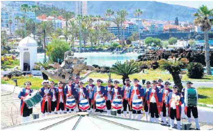
Auch auf Teneriffa waren die Oberkasseler Musiker willkommen.

hinaus, so nach Oxford, Straßburg, Budapest und Venedig. Junge, alte, ehemalige oder zeitlich eingeschränkte Musiker haben hier einen Platz, um die Liebe zur Musik und Traditionspflege, die Verbundenheit zum Verein, gewachsene Freundschaften und das Bedürfnis nach Geselligkeit ausleben zu können. Dadurch ist das Veteranencorps entstanden, dessen Mitglieder auch gelegentlich bei Personalmangel aushelfen. Kinder und Jugendliche ab dem neunten Lebensjahr, aber auch Erwachsene, die als „Spätberufene“ Spaß an der Musik haben, können an der Ausbildung durch qualifizierte Ausbilder teilnehmen. Mögliche Instrumente sind die Querflöte, Marschtrommel, große Trommel, Becken oder Lyra. Schnupperproben sind am 18. und 25. Oktober, jeweils um 17.30 Uhr im Jugend- und Ausbildungsheim, Königswinterer Str. 718. Das Tambourcorps Grün-Weiß 1950 Oberkassel freut sich auf euch. Fragen beantwortet gerne der Vorsitzende Stephan Käufer, den Sie unter 0176 25547120 erreichen. Weitere Infos zum Verein gibt es unter www.tambourcorps.net . wm