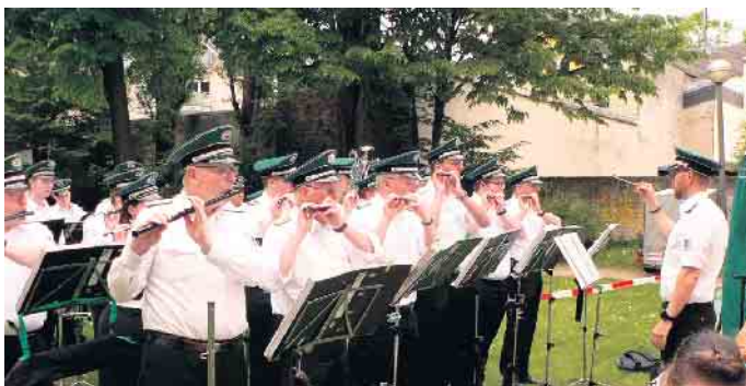
Beim Schützenfest in Pützchen hatten die Musiker fast ein Heimspiel.