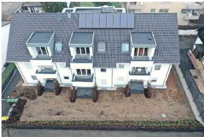
Das Dachdeckerhandwerk, der richtige Ansprechpartner für die Solaranlage auf dem Dach.

nung der Klimaexperten eine Rate von 3,5 %. Hier kommt das Dachdeckerhandwerk ins Spiel: Sie führen geeignete Maßnahmen wie Wärmedämmung an Wänden, am Dach oder an der oberen Geschossdecke aus, durch die schon viel Energie eingespart werden kann. Dachdecker und Dachdeckerinnen sind wichtige Berater, wenn es darum geht, welche Maßnahmen sinnvoll sind, aber auch, welche Fördergelder infrage kommen. Zum Beispiel lassen sich