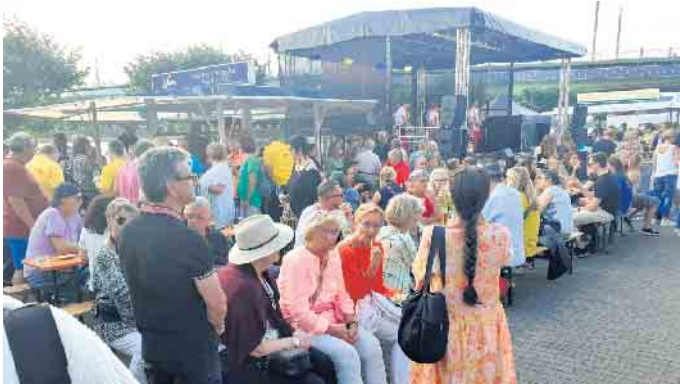
Sehr gut besucht war das Fest der Vereine an der Rheinpromenade.

Das große Angebot mobilisiert die Menschen