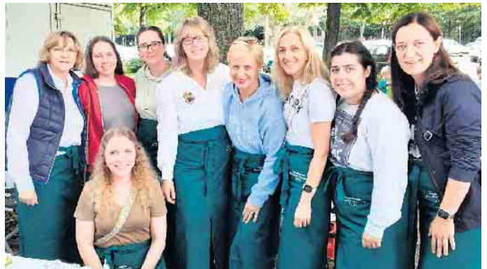
Nichts blieb übrig auf den Kuchenblechen des Damenkomitees Grün Weiß Ramersdorf.

Beueler*innen nicht daran, das Fest zu besuchen, um in sehr angenehmer Atmosphäre ein paar fröhliche Stunden zu haben. Freunde und Bekannte trafen sich rein zufällig, tauschten sich aus und schwärmten in Erinnerungen. Es war einfach