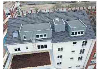
Dachdecker lassen Dächer auch ergrünen.

beiten und dabei auch Klimaschützer sein wollen, liegen mit einer Ausbildung im Dachdeckerhandwerk genau richtig“, rät ZVDH-Präsident Dirk Bollwerk und ergänzt, dass das Dachdeckerhandwerk bislang auch gut durch die Coronakrise gekommen sei: kaum Kurzarbeit und wenige Entlassungen. Auch dies ein Pluspunkt, der für eine Dachdecker-Ausbildung spricht: Dachdecker sind immer gefragt. Mehr Infos unter www.dachdeckerdeinberuf.de (akz-o)