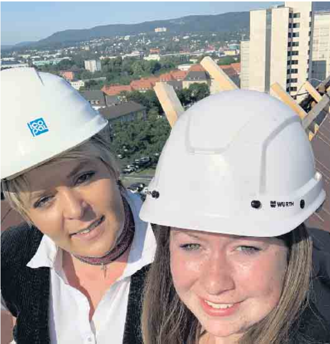
Klimaschutz, keine reine Männersache; es gibt auch Frauen im Dachdeckerhandwerk.

durchführen“, erläutert Claudia Büttner, Pressesprecherin beim Zentralverband des Deutschen Dachdeckerhandwerks (ZVDH).