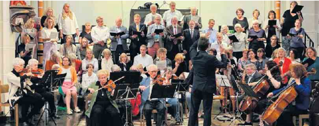
Schola, Kirchenchor und Collegium Instrumentale

1898 wurde der Kirchenchor St. Josef Beuel gegründet. Seit 125 Jahren erklingt dort Musik zum Lob Gottes und zur Freude der Menschen. Am Sonntag, 24. September, findet um 17 Uhr in der Kirche Sankt Josef Beuel eine musikalische Vesper zu diesem Jubiläum statt. Kirchenchor, Schola und Collegium instrumentale musizieren Werke aus verschiedenen Epochen, welche die Vielfalt der Kirchenmusik zeigen. Anschließend findet im Pfarrheim ein Empfang statt, zu dem alle sehr herzlich eingeladen sind.