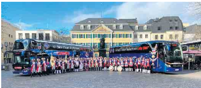
Vor allem in der Karnevalszeit ist das TC Grün Weiß Oberkassel oft mit den Bonner Stadtsoldaten unterwegs.

Der Verein ist keine reine Männerdomäne mehr, sondern eine sehr ausgeglichene Gemeinschaft weiblicher und männlicher Spieler. Viel Engagement wird vor allem in die Jugendarbeit gelegt. Ausbildung und Eingliederung junger Nachwuchsmusiker sichern den Fortbestand des Vereins und der Spielmannstradition. Eine mit viel Fingerspitzengefühl vermittelte gute musikalische Ausbildung und altersbezogene Aktivitäten fördern soziales Engagement und ver-