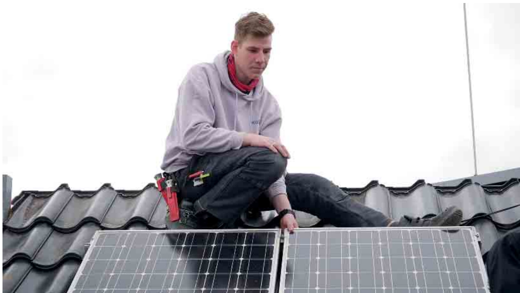
Dächer sind mehr als Ziegel. Auch die Montage von Photovoltaikanlagen gehört zum Dachdeckerhandwerk.

Ob man für den Beruf des Dachdeckers oder der Dachdeckerin geeignet ist, stellt man am besten bei einem Schüler­praktikum fest. Viele Dachdeckerbetriebe bieten heute ein Praktikum an, nehmen am Girls' Day teil und informieren auf Azubimessen über den Beruf. Dabei kann man sich dann gleich kennenlernen, erhält den ersten Einblick ins Unternehmen und wird vielleicht sogar mit einem Aus­bildungs­vertrag belohnt. Gute Voraussetzungen zum Dachdeckerberuf sind neben hand-