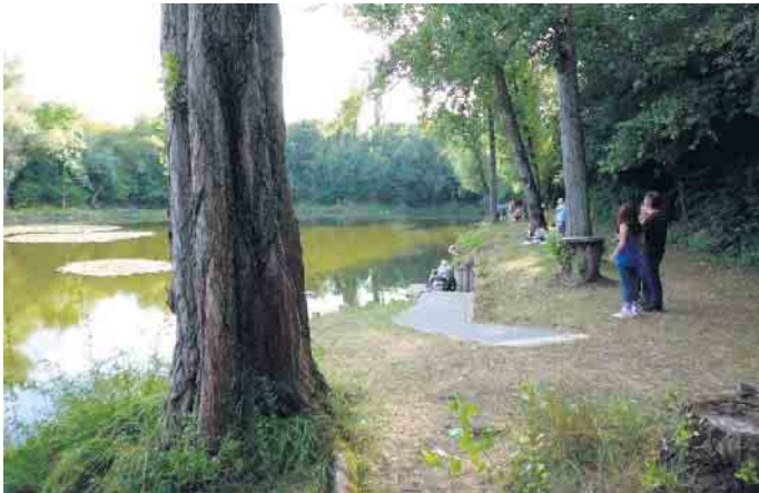
Ruhig liegt der Elfgen und lädt zum Angeln ein.

bewirtschaftet. Unter Bewirtschaftung versteht der Verein den Aufbau und Erhalt eines gesunden Fischbestandes sowie einer ausgewogenen Flora und Fauna. Kaum jemand weiß, dass sich Angler verstärkt für die Belange von Umwelt und Natur einsetzen. Die regelmäßige Pflege der Uferregion, Sicherung der Wasserqualität, Ansiedlung von seltenen Vogel- und Insektenarten und Erhaltung der Naturlandschaft sind nur einige Dinge, die sich die Mitglieder der SGB zum Ziel gesetzt haben. Das größere „Elfgen“ ist ein sehr leicht zu beangelndes Gewässer mit einem sehr guten Fischbestand. Durch ein ausgedehntes Schongebiet mit vielen Laichmöglichkeiten reproduziert sich der Bestand von selbst. Die Fangergebnisse der Mitglieder sprechen für sich. Der See verfügt über ein großes Vereinsgebäude, das Mitglieder nutzen können, um viele schöne Stunden dort zu verbringen. Der See an der Ziegelei ist kleiner und sehr ruhig. Beide Gewässer haben altersgerechte und behindertenfreundliche Angelplätze, die von engagierten Mitgliedern gebaut wurden. So haben auch Menschen