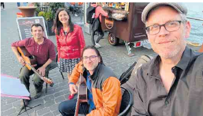
Letztmalig in 2022: Musik an schönen Orten. Mit dabei ist „La Diva Caprichosa“.

caprichosa.de ) interpretiert spanische und lateinamerikanische Lieder über das wunderbare und doch launische Leben sowie über die Liebe. „El Gato Con Botas“ ( https://www.gatoconbotas.de ) bringt Lieder und Geschichten aus Frankreich, Lateinamerika und der Türkei mit. Die Veranstaltung beginnt um 18 Uhr. Der Eintritt ist frei. Gefördert wird sie durch das Bundesprogramm „Neustart Kultur“. Aktuelle Informationen und Details zum Programm sind auf der Webseite des Bürgervereins zu finden ( www.bv-vilich-mueldorf.de ). wm