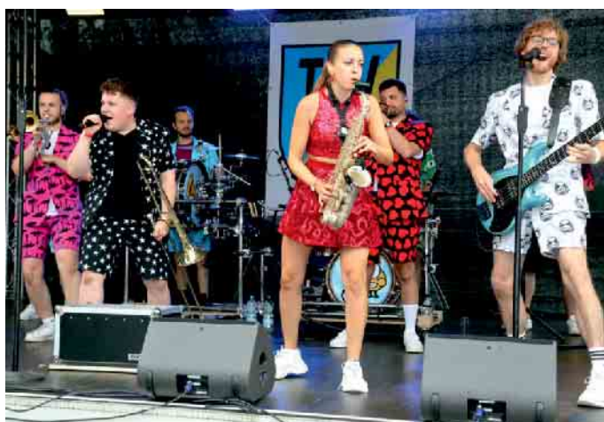
„Druckluft“ begeisterte mit einem tollen Musikauftritt

die Gruppe Druckluft, die nach einem Auftritt in der Bonner Rheinaue die heimische Rheinseite besuchte und sich mit einer tollen Musik-show präsentierte. Damit aber nicht genug des Musikprogramms, denn auch die Kölschrock-Band Kempest Feinst, die Beueler Stadtkapelle und die B-Five-Blues-Band sorgten für eine Superstimmung. Das Tanzkorps der Ennertfunken war mit 54 Tänzerinnen und Tänzern angetreten und versprühte mit gekonnten Tänzen einen Vorgesmack auf die kommende