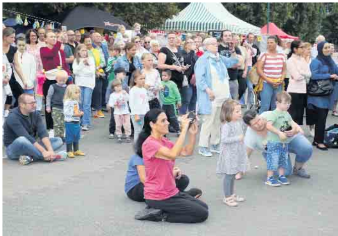
Die Bühne war stets von vielen Schaulustigen umlagert.

Erfolgreicher Neubeginn am Hans-Steger-Ufer