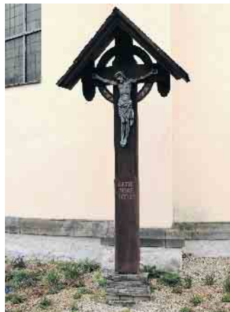
Das Missionskreuz vor der Verpackungsaktion.