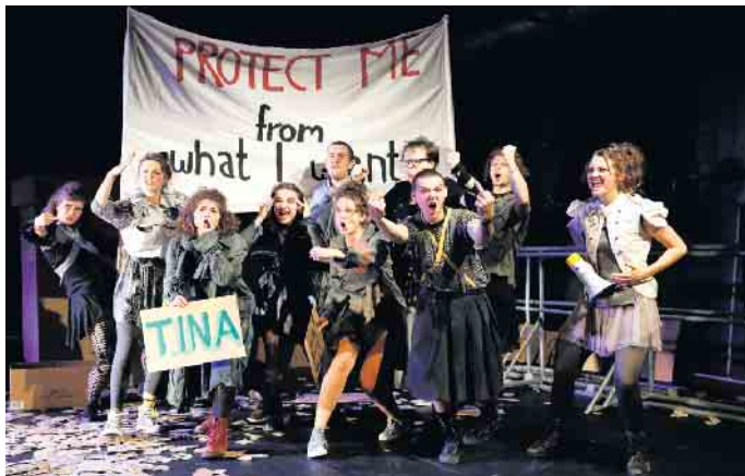
Was tun? Vögel beklagen den bedauernswerten Zustand der Welt.

Seit Sommer 2021 gibt es in Bonn die Initiative „Theater und Musik für junges Publikum“, in der das Junge Theater Bonn, PORTAL (Theater Bonn und Beethoven Orchester Bonn) und das Theater Marabu sich vernetzen. Nach einer gemeinsamen Vorschau auf die Programme der kommenden Spielzeit im Jungen Theater Bonn, lädt die Initiative am Montag, 26. September, zu einem Fortbildungstag für Lehrer*innen (inkl.