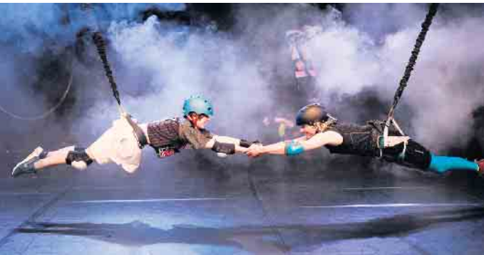
„Come a little closer“, der Versuch um ein vernünftiges Miteinander.

Zusammenleben, weltweite Krisen und Geld machen sind die Themen