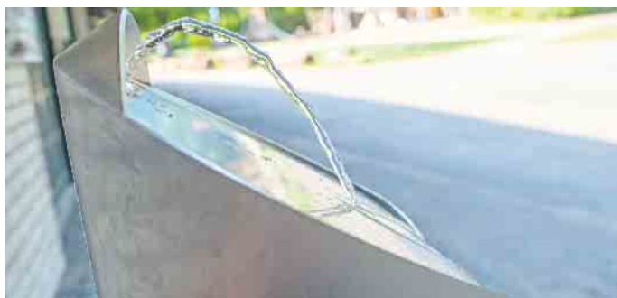
Der Trinkwasserbrunnen am Skatepark steht außen am Vereinsgebäude und steht somit auch Besuchenden der Beueler Rheinaue und des angrenzenden Spielplatzes zur Verfügung.

gen und ist ein wichtiger Schritt auf dem Weg zu einer hitzeresistenten Stadt. Am Standort Beuel testet das Städtische Gebäudemanagement (SGB) ein neues, frostsicheres Brunnenmodell, das ganzjährig genutzt werden kann. Die Kosten für Anschaffung und Installation inklusive Tiefbauarbeiten betrugen rund 18.000 Euro. Bereits im Rahmen eines Pilotprojekts hatte das SGB drei verschiedene Brunnenmodelle getestet - am Konrad-Adenauer-Platz in Beuel, im Budafokpark in der Innenstadt und am Schickshof in der Fußgängerzone des Stadtbezirks Hardtberg. Die bisherigen Erfahrungen zeigen: Edelstahlbrunnen heizen sich deutlich weniger auf als Modelle aus Naturstein und sind daher besonders geeignet für den Einsatz im öffentlichen Raum. Aktuell stehen in Bonn acht öffentliche Trinkwasserspender zur Verfügung: