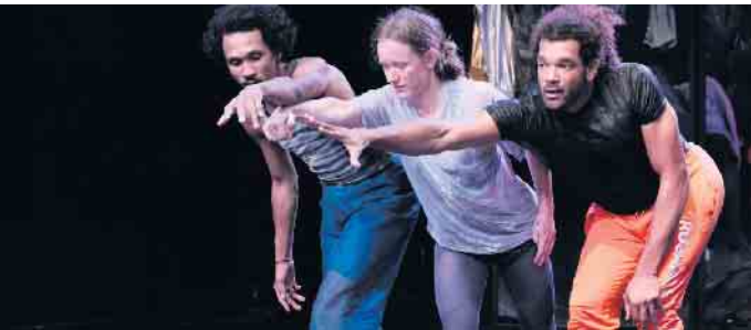
Ein Probenfoto des Tanztheaters „Silent calling“, dessen Uraufführung bevorsteht.

„Be rich or die trying“ ist eine interaktive Performance zum Kapitalismus (ab 13 Jahren). Einladung zur ersten Start-Up-Pitch-Party. „Wir gründen und ohne euch kein Moos. Macht euch bereit für die Party eures Lebens! Wir lassen die Korken knallen, denn klotzen und nicht kleckern ist hier die Devise. Geld haben kommt schließlich von Geld machen!“ Das Ensemble zelebriert die Show mit unverschämter Ironie. Bleibt nach 60 vergnüglichen Minuten die hochaktuelle Frage, wie viel oder wie wenig Geld die Demokratie verträgt. Termine sind am 28. September, 18 Uhr sowie am 29. September, 10 Uhr. Nach der Vorstellung von „be rich or die trying“ am 28. September findet um 19 Uhr ein Gespräch zum Thema „Geld und Klasse - Was macht Geld mit uns?“ mit der Journalistin, Autorin und Moderatorin Mareice Kaiser statt. Ticketreservierung über die Homepage www.theater-marabu.de ; mail@theater-marabu.de ; Tel. 0228/ 433 97 59. wm