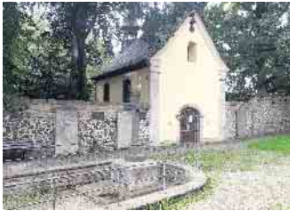
Wallfahrtskapelle und Brunnchen in Pützchen. Nach der Legende beendete die Hl. Adelheid hier eine lange andauernde Dürre.

Christ König Kinderchor. Ab 10 Uhr sind die Gläubigen gegen eine kleine Spende zum Frühstück ins Pfarrzentrum eingeladen. Um 17 Uhr findet eine Konzertandacht mit dem Kammerchor an St. Adelheid & Solisten mit Cello, Harfe und Orgel in der Wallfahrtskirche statt. Leitung: Seelsorgebereichskirchenmusikerin Marita Hersam. Am Montag, 1. September, pilgern um 15 Uhr Kinder-