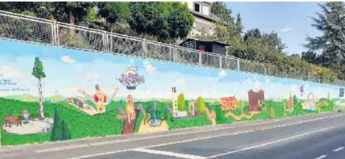
Ein Teilstück des Projekts zeigt den Dorfplatz, die LiKüRa-Prinzessin, das Brunnchen und die Limpericher Kirchen.

Vor einigen Jahren wurde die den Finkenberghang stützende Bruchsteinmauer in Limperich an der Königswinterer Straße durch eine Betonwand ersetzt. Seitdem zierte zwischen Weinbergweg und Finkenbergstraße über 77 mal 4 Meter nackter grauer Beton das Bauwerk, lediglich zeitweise aufgelockert durch ein wenig Grün. Nicht unbedingt ein schöner Anblick. Das sah auch