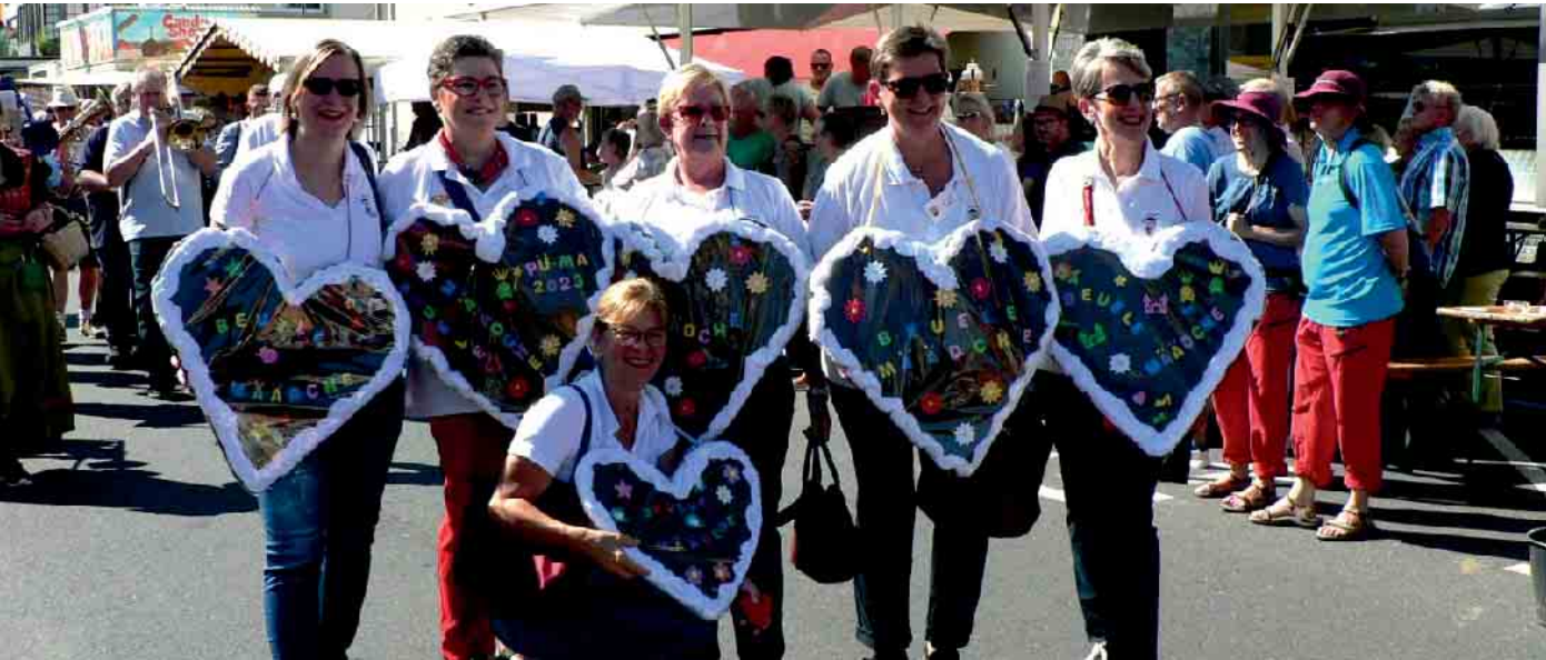
Beim Festzug über das Marktgelände immer dabei: Das Damenkomitee „Beuele Määdche“.

Die Vorbereitungen sind auf der Zielgeraden