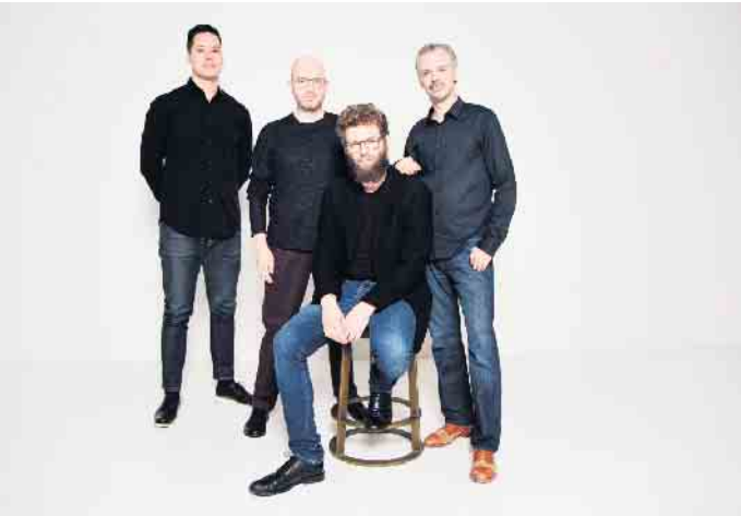
Den Schlusspunkt der Beethovenfest-Konzerte im Pantheon setzt das Streichquartett „Brooklyn Rider“.

Streichquartett „Brooklyn Rider“ im Pantheon musikalisch über amerikanische Bürgerschaft nach: Ein Thema, das aktueller nicht sein könnte. Infos zum weiteren Pantheon Programm sowie Onlinetickets gibt es unter www.pantheon.de . wm