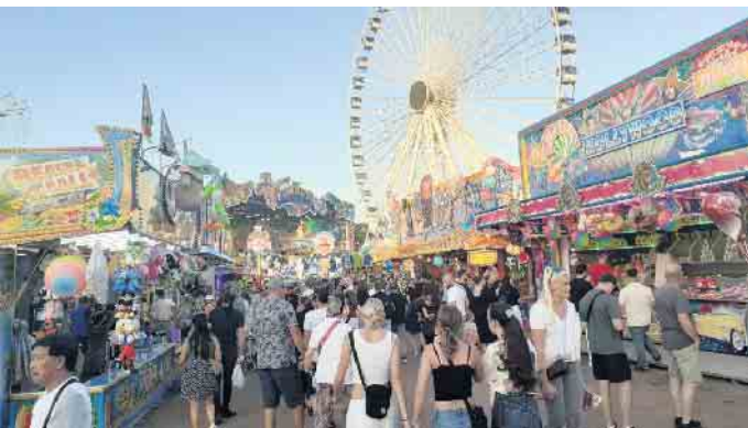
Wenn das Wetter mitspielt, werden an den fünf Kirmestagen wieder mehr als eine Million Besucher erwartet.

„Pützjens Maat is anjesaat“ heißt es jedes Jahr am zweiten Wochenende im September (12 bis 16. September) und immer wieder können sich die Besucher der beliebten Großkirmes auf Platzneuheiten, aber auch auf viele Jahrmarktsklassiker freuen. Längst haben die Vorbereitungen rund um das Marktgelände begonnen. Anfang August sind die Mitarbeitenden des Leistungszentrums Märkte der Bonner Stadtverwaltung vorübergehend in die Markthalle am Holzlarer Weg umgezogen. So sind die Wege zu den Marktwiesen kurz, denen derzeit ihr Hauptaugenmerk gilt, denn das beliebte Volksfest wird traditionell von der Stadt Bonn organisiert. Die Vermessung für den Aufbau der rund 170 Fahrgeschäfte und Kirmesbuden auf dem Hauptgelände und die Markierung der Stellplätze mit rund sechs Kubikmetern Sägespäne sind gemacht. Insgesamt werden auf der Veranstaltungsfläche von ca. 80.000 Quadratmetern