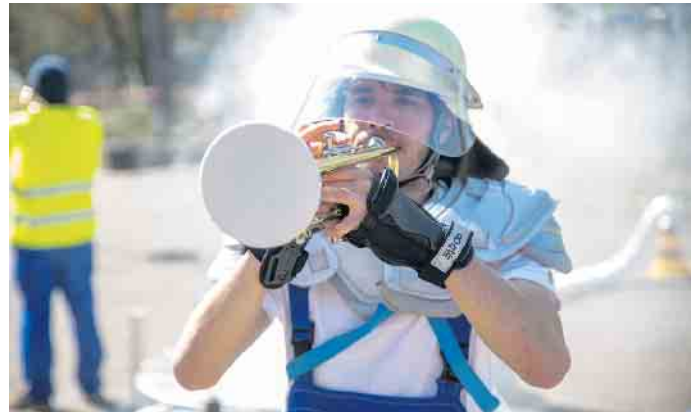
„M.O.D.“, Musik nach der Arbeit macht Spaß.

Ab Mitte des Monats kehrt dann für die Theatermacher wieder der Alltag ein. Am 17. (18 Uhr) und 18. September (15 Uhr) wird im Theater in der Brotfabrik an der Beueler Kreuzstraße das Mehr-Generationen-Tanztheater „Morgen ist heute gestern“ aufgeführt. Drei Leben, drei Alter (12, 30, 63), drei Körper. In Geschichten und Gedanken verhandeln sie Vergangenheit, Gegenwart und Zukunft, veranschaulichen mit Tanz und Bewegung den Wandel der Zeit, aber auch die Kontinuität im Leben. „Blaupause“, eine Objekt- und Musiktheaterproduktion (ab drei Jahren) steht am 19. September um 10 Uhr auf dem Spielplan. Zwei kommen mit ihrem Putzwagen, um das Theater zu reinigen. Plötzlich fehlt einer, macht einfach blau und die Arbeit bleibt liegen! Neben