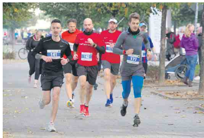
Auch 2021 starteten die Läufer*innen über die 10 km-Strecke

Als einer der wenigen Läufe fand der Drei-Brücken-Lauf auch in den letzten beiden Pandemie-Jahren statt. Ein ausgereiftes Organisations- und Hygienekonzept machte dies möglich. Die Organisatoren sind daher zuversichtlich, auch in diesem Jahr den Lauf durchführen zu können. Die Anmeldung ist über die