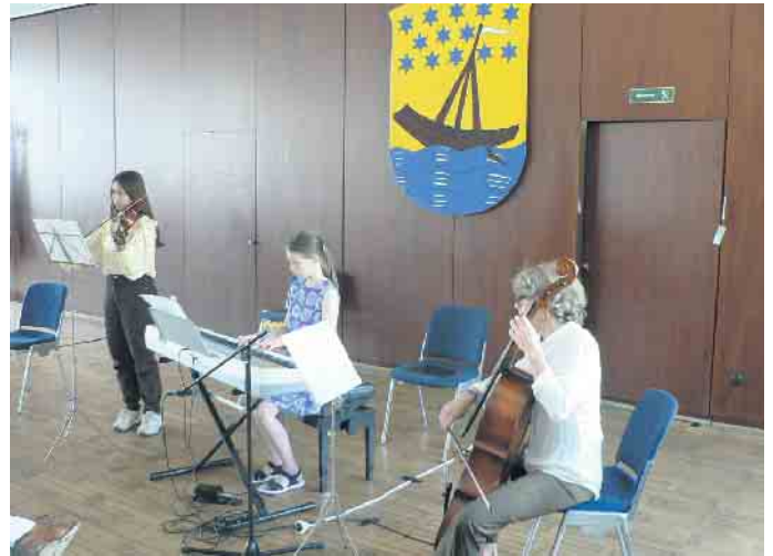
Schülerinnen des St. Adelheid Gymnasium begleiteten die Feier im Beueler Rathaus mit ihrer Musik

Beuel. Die rechtsrheinischen Ortsteile Bonns bilden den Stadtbezirk Beuel, der kürzlich mit einem kleinen Festakt den 100. Geburtstag der Bürgermeisterei Beuel feierte. Das Amt Vilich, Vorgänger der späteren Gemeinde Beuel umfasste seit Beginn des 19. Jahrhunderts das Gebiet des heutigen Stadtbezirks mit Ausnahme von Oberkassel und Holzlar. Am 15. Dezember 1891 beschloss der Gemeinderat die Verlegung der Verwaltung nach Beuel. Das neue Rathaus wurde am 26. September 1896 bezogen, die Gemeinde behielt jedoch noch bis zum 15. Juli 1922 den Namen „Bürgermeisterei Vilich zu Beuel“.