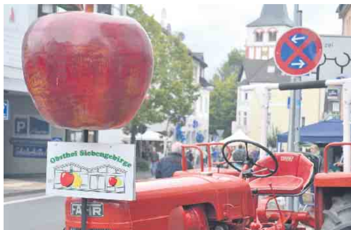
Der Obstanbau in der Region hat dem Apfelsonntag einen Namen gegeben, Obst wird auch in dieses Jahr wieder angeboten