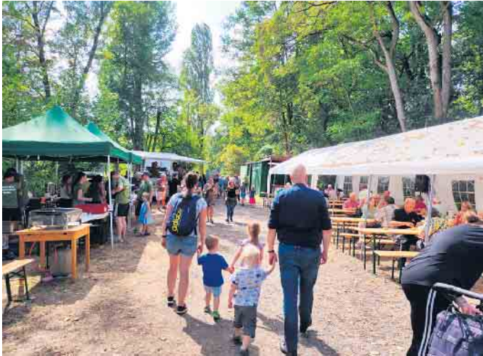
Das im Grünen oberhalb des „Elfen“ gelegene Festgelände war durchweg gut besucht.

Die Sportanglergemeinschaft Beuel freut sich über den tollen Erfolg