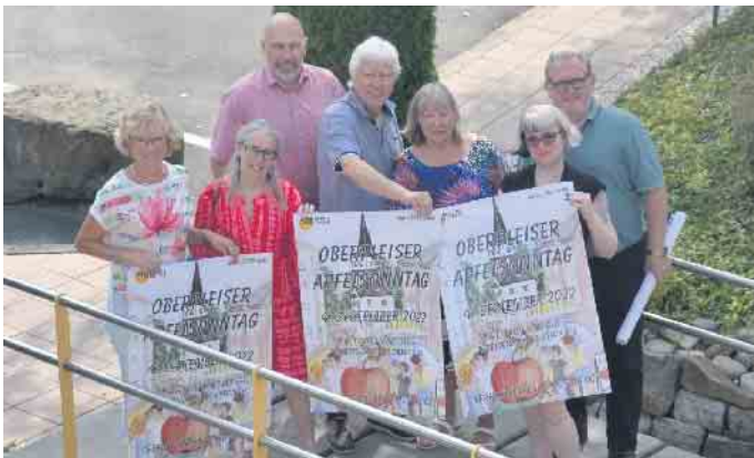
Der Vorstand des Werbekreises lädt herzlich zum 23. Apfelsonntag in den Ortskern von Oberpleis ein

Der Werbekreis Oberpleis freut sich, auch am 23. Apfelsonntag wieder zahlreiche Besucher, begrüßen zu können