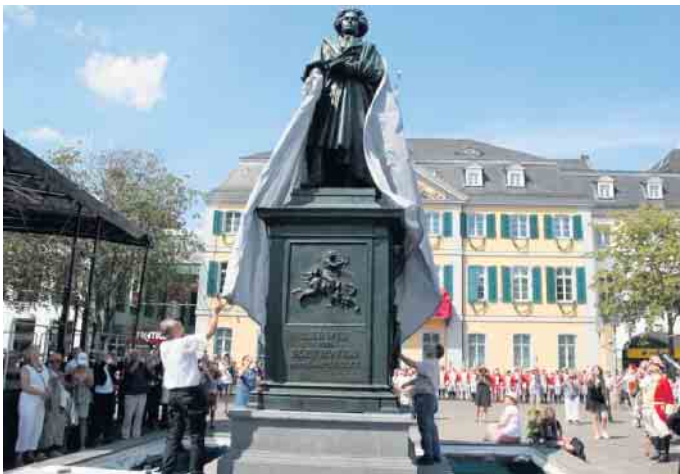
Die Hülle fällt zum zweiten Mal. Bonns größter Sohn ist zurück: „Ludwich is widder do!“

Mit dem zu „Du bes da Ludwig unsere Bonner Jung“ umgetexteten Bläck-Fööss-Song „Du bes die Stadt“ ging die zweite Enthüllung des Beethoven-Denkmal zu Ende. Was bleibt ist die Erinnerung an ein großes historisches Spektakel an einem überheißen Tag. wm