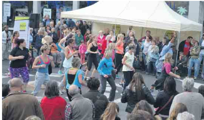
Der Apfelsonntag - eine Traditionsveranstaltung und stets ein kunterbuntes Spektakel - wie hier im Jahr 2015

momentan reges Treiben. Die Apfelernte ist in vollem Gange und so verspricht dieser verkaufsoffene Sonntag wieder viele leckere Obstsorten. Die Obsthöfe der Region werden ihre Stände wieder aufgebaut haben und der Werbekreis begrüßt jeden Gast mit einem dieser leckeren Äpfel, damit Jung und alt auch einmal herzhaft zubeißen und sich von der Qualität