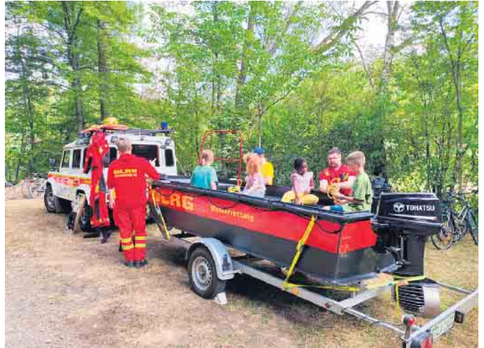
Ein Anziehungspunkt für die Kids war das Rettungsboot der DLRG

Vilich-Müldorf. Zahlreiche Besucherinnen und Besucher erfreuten sich kürzlich bei bestem Wetter auf dem Gelände der Sportangler-Gemeinschaft Beuel, denn die