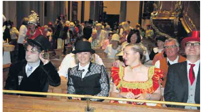
Da hat sich doch jemand eingeschlichen. Beethoven will wissen, was man heutzutage über ihn sagt.