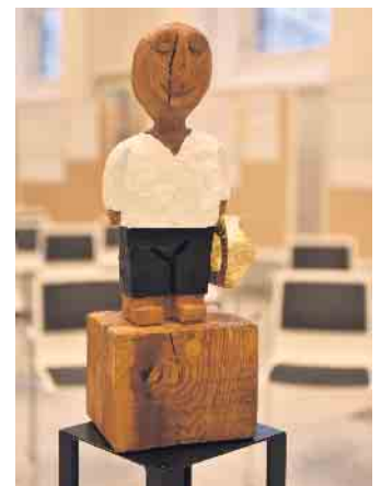
Königsskulptur von Ralf Knoblauch