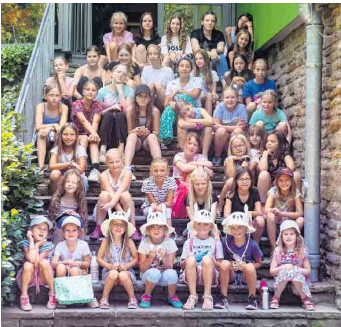
Unsere Gardenmädchen auf Wochenendfahrt

Sommerfest auf dem Gelände des Hauses Felseck in Königswinter an. Mit direktem Rheinblick, Hüpfburg, Animationsprogramm, Popkorn- und Zuckerwattestand sowie Leckerer vom Grill und vielen Spielstationen wurde bis in den Abend gefeiert. Das Gemeinschaftsgefühl wurde