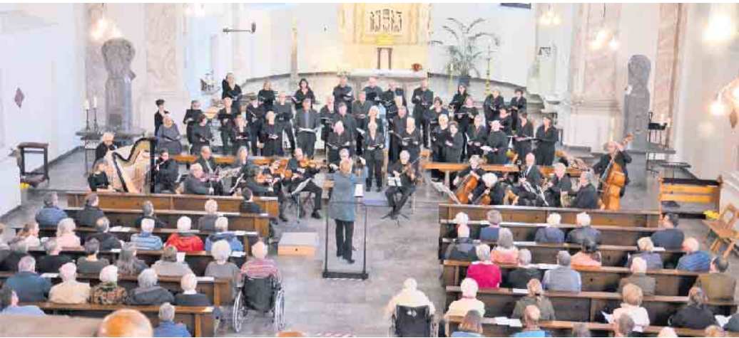
Der Kantaten- und Projektchor bei einem Konzert im Vorjahr.