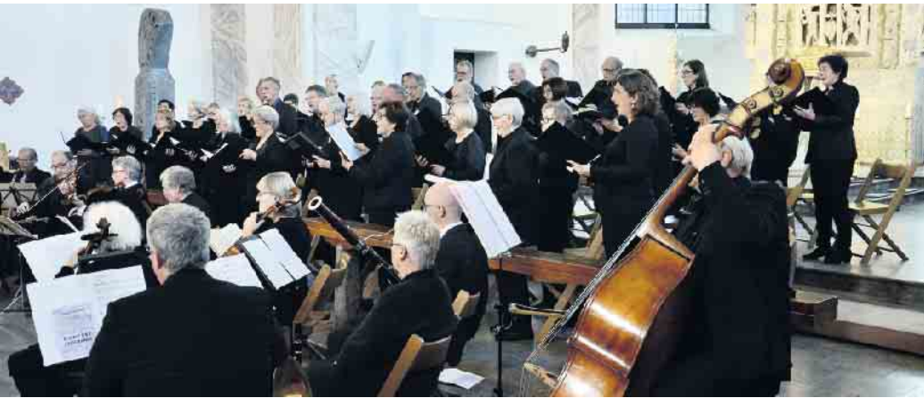
Für den Chor wird es ein Heimspiel in Pützchen.