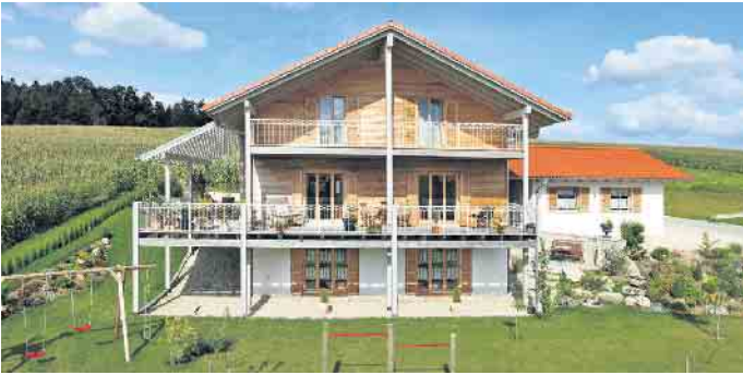
Dank individueller Hausplanung können sich alle Generationen dauerhaft unter einem Dach wohlfühlen.

genug ist. „Wichtig beim Mehr- generationenwohnen ist auch, dass sich alle Parteien mal zu- rückziehen und gemütlich für sich sein können. Daher geht es nicht ohne individuelle Hausplanung, in die jede und jeder zukünftige Be- wohner - von Oma und Opa bis zum Kleinkind und dem Haustier - einbezogen sein sollte“, so Tews. So gelingt der Hausbau planungs- sicher und generationengerecht Neben den individuellen Anforderun-