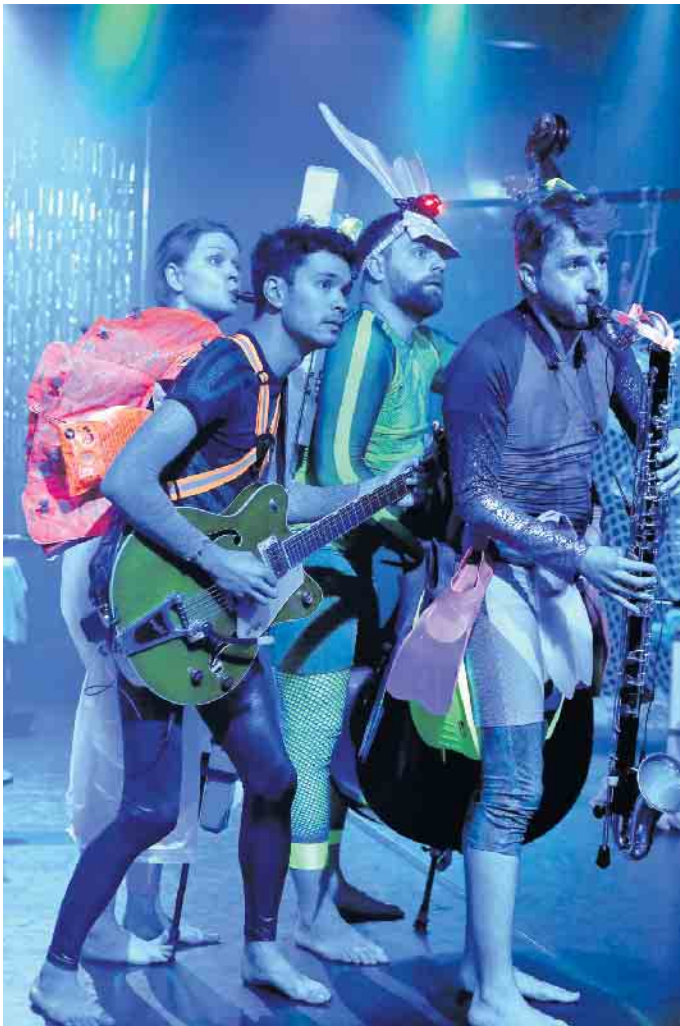
„Splash“, Wasser ist eine Macht.