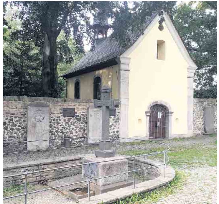
Das Brunnchen, der Ort, an dem die Hl. Adelheid eine Quelle fand, und die Wallfahrtskapelle sind für eine Woche das Ziel vieler Menschen. Foto: wm

Sitzgelegenheiten auf dem Weg. Beginn der Messe ist um 20 Uhr am Brunnchen wm