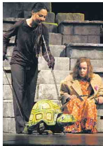
Momo-Inszenierung 2010 am JTB

Aber im nächsten Jahr darf sie mitmachen, wenn es ihr bis dahin gelungen ist, eine richtig gute Hexe zu sein. Die Premiere findet am Samstag, 28. Oktober, statt. Alle Infos zu den Premieren des JTB, weiteren Stücken im Repertoire und zu der neuen Kooperation zwischen dem Theater Bonn und dem Jungen Theater Bonn finden Sie auf der Website des JTB: www.jt-bonn.de