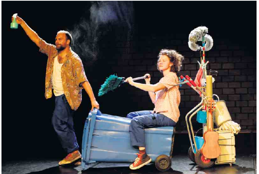
Noch wird fröhlich gemeinsam geputzt, aber dann macht jemand BlauPause.

In einer Koproduktion mit dem Theater Bonn gibt es am 3. September um 15 Uhr und 4. September