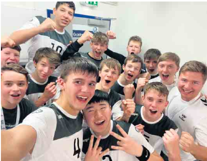
TuS Oberkassels Handballjugend nach einem siegreichen Spiel.

„Zwei Veedel - ein Verein“ besteht. Hier wird Handballsport von den Jüngsten bis zum Spitzensport in Damen-, Herren- und Jugendteams angeboten. Jeder findet den für sie oder ihn passenden Einstiegspunkt. Trainings- und Spielzeiten der HSG sowie Infos zum sehr aktiven Förderverein finden Sie im Netz unter hsg-geislar-oberkassel.de . Auch die Tischtennisabteilung des TuS hat eine lange Tradition. Durch ihre Auslandsfahrten und internationalen Vereinskontakte waren die TT-Aktiven immer ein wichtiger Schwerpunkt des Vereins. Dienstags und freitags ab 18 Uhr steht die Turnhalle der Gottfried-Kinkel-Grundschule im Zeichen des schnellen Sports mit dem kleinen Ball. Das Angebot richtet sich an Jung und Alt, Amateur- und Hobbyspieler sowie interessierte Anfänger. 2023/24 geht der TuS mit je drei Erwachsenen- und Jugendteams an den Start. Weitere Informationen gibt es im Netz unter tischtennis-tusoberkassel.de . Über die Jahre ist das Angebot an Fitness-, Tanz- und Gymnastikkursen des TuS stetig gewachsen. Dies bestätigt, dass es auch im Verein möglich ist, klassische und moderne Formen der Bewegung zu trainieren. Das geht von A bis