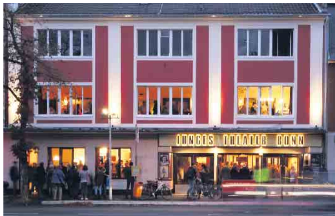
Das Junge Theater Bonn

Das Junge Theater Bonn startet voller Energie in die neue Spielzeit 23/24 und präsentiert gleich drei spannende Premieren, sodass zu Beginn für fast jedes Alter ein neues Stück auf dem Spielplan steht. Mit „Momo“, „Das Tribunal“ und „Die kleine Hexe“ verspricht das JTB ein vielseitiges Programm, das das Publikum in fantastische Welten entführt, zum Lachen oder zum Nachdenken bewegt. Den Auftakt macht die Premiere von „Momo“ von Michael Ende. Die Premiere findet am 2. und 3.