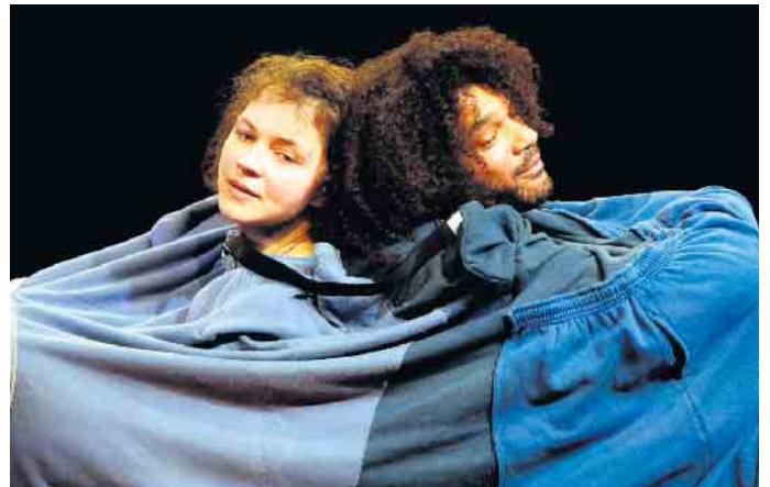
„Genau so, nur anders“, da gilt es viel zu überwinden.

um 10 Uhr Aufführungen von „Genau so, nur anders“ (ab 6 Jahren). Wer bin ich und wer bist du? Was unterscheidet uns voneinander und macht uns anders?