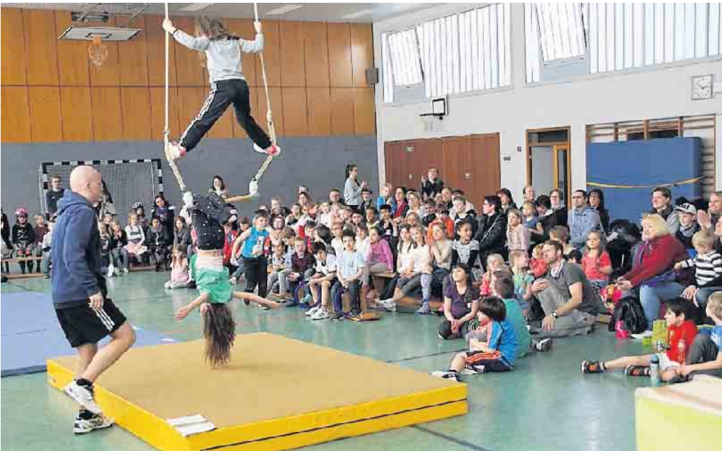
Junge Sportler*innen bestaunen die akrobatischen Übungen.