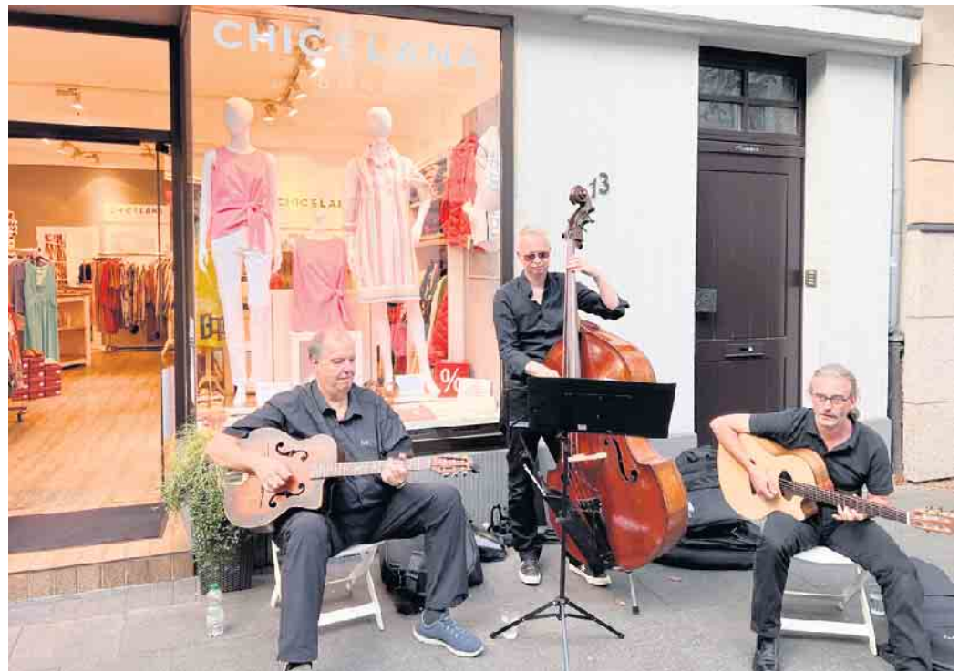
Wie im Vorjahr gibt es wieder Livemusik vor den teilnehmenden Geschäften.