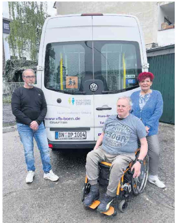
Das neue Fahrzeug zur Rollstuhlaufnahme

neues Fahrzeug mit der Möglichkeit zur Rollstuhlaufnahme zur Verfügung zu haben. Morgens und nachmittags wird das Fahrzeug zur Beförderung von Schulkindern zu ihren Förder-schulen eingesetzt. Dazwischen finden Fahrten von Privatpersonen zu Arztbesuchen, Veranstaltungen oder anderen Terminen statt. Ermöglicht wurde das neue Fahrzeug durch die Unterstützung von zwei Stiftungen. Die Lieselotte-Peipers-Stiftung und die Heinz-Dörks-Stiftung haben gemeinsam den Teil der Anschaffungskosten übernommen, den der vfb aus eigener Kraft nicht aufbringen konnte. Weitere Informationen zur Zentrale für Behindertenfahrten im Verein für Behindertensport Bonn/Rhein-Sieg e.V. erhalten Sie in der Geschäftsstelle im Beueler Zentrum, Hans-Böckler-Straße 16, per Telefon unter 0228 / 40367-25, per E-Mail an fahrdienst@vfb-bonn.de oder auf den Internetseiten des Vereins unter http://www.vfb-bonn.de