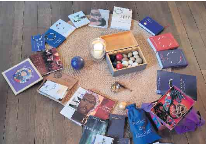
Perlen des Glaubens - Bodenbild

Kleiner Glaubenskurs in der Evangelischen Kirchengemeinde Beuel