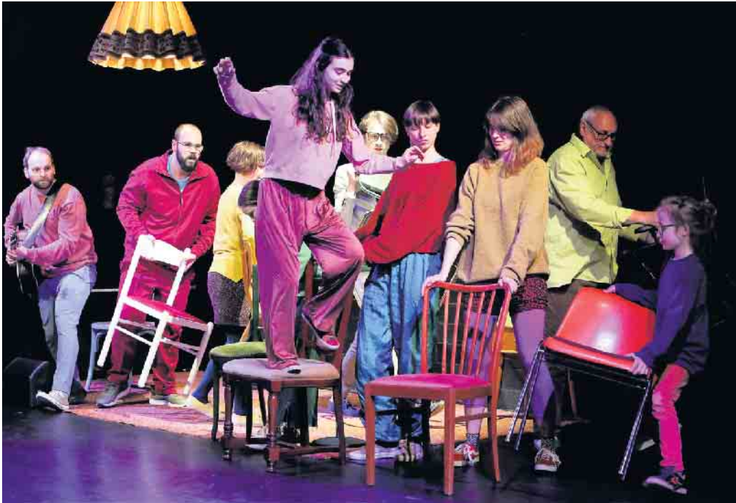
Verschiedene Generationen wollen sich „ZusammenRaufen“. Ob es gelingt?

Theaterinteressierte junge Menschen gesucht