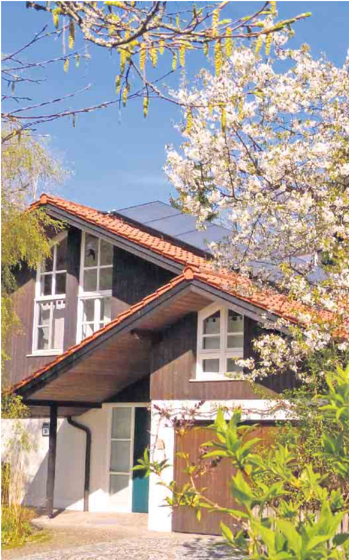
Viele Menschen in Deutschland wohnen in älteren Ein- und Zweifamilienhäusern, in denen früher oder später Sanierungen anstehen.

rungsarbeiten sinnvoll zu priorisieren und zu budgetieren. Unterstützung dabei bieten unabhängige Sachverständige, zum Beispiel die Bauherrenberater des BSB. Sie unterstützen Hauseigentümer auch dabei, wirtschaftliche und nachhaltige Lösungen zu definieren und vertragliche Vereinbarungen mit Bauunternehmen fachlich und juristisch zu prüfen. In der eigentlichen Umsetzungsphase können sie zudem eine Bauqualitätssicherung übernehmen, mit der sich Mängel frühzeitig entdecken und Folgeschäden vermeiden lassen. (DJD)