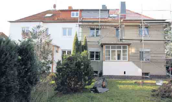
Laut einer aktuellen Verbraucherschutzstudie sind Baumängel auch in der Sanierung von Altbauten keine Seltenheit.

Renovierungen richtig planen und sicher durchführen