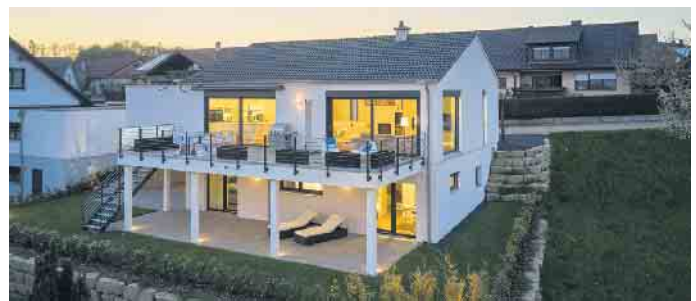
Keller werden heute zum Wohlfühlwohnen genutzt. Foto: GÜF/Fertighaus WEISS

gänglich positioniert werden. Eine Alternative hierzu ist ein sogenannter Lichthof, der beispielsweise über eine Rampe barrierefrei erschlossen werden kann. In die bergseitigen Räume des Kellers können Sonnenlicht und frische Luft etwa durch Lichtschächte gelangen. Schlaf- und Badezimmer sind in diesem Bereich der Wohnung sinnvoll platziert und bleiben an heißen Sommertagen vergleichsweise kühl. GÜF/FT