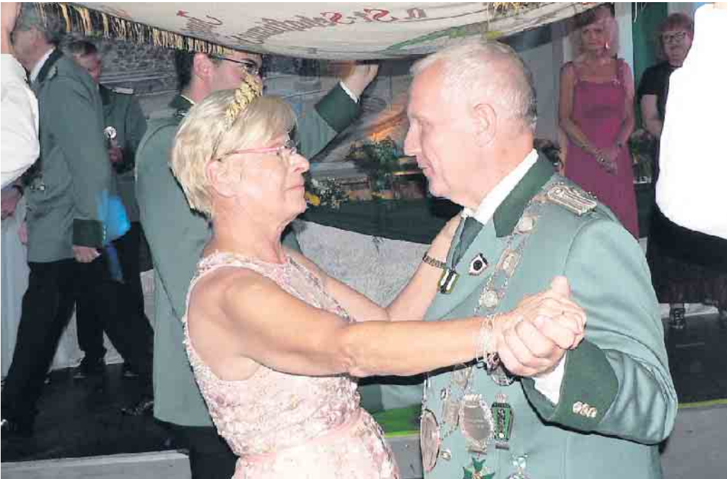
Das ist Tradition! Die Majestäten tanzen unter der Bruderschaftsfahne.