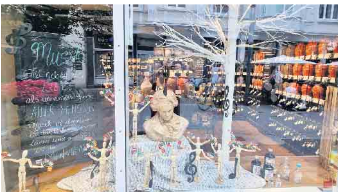
Das Sieger-Schaufenster 2022 des Feinkost-Shops „vomFASS“.

ses Motto gibt der Kreativität viel Raum und ist ein Signal der Zuversicht und zum Nachdenken.“ In der ersten Wettbewerbsrunde werden die Teilnehmer gebeten, ein Foto ihres dekorierten Schaufensters in digitaler Form bei frank.wittwer@netcologne.de einzureichen. Einsendeschluss ist Montag, 4. September. Eine unabhängige Jury vergibt die Preise und wählt für die zweite Wettbewerbsrunde aus allen Einsendungen acht Schaufenster aus, die vom Medienpartner des Wettbewerbs, dem regionalen Anzeigenblatt Schaufenster/Blickpunkt in seiner auflagenstarken Printausgabe sowie online präsentiert werden. Daraus wählen die Leser den Publikumspreis. Prämiiert werden Kreativität, gestalterische Umsetzung und Werbewirksamkeit für das Beethovenfest und die Beethovenstadt Bonn. Den Siegern des Wettbewerbs werden bei