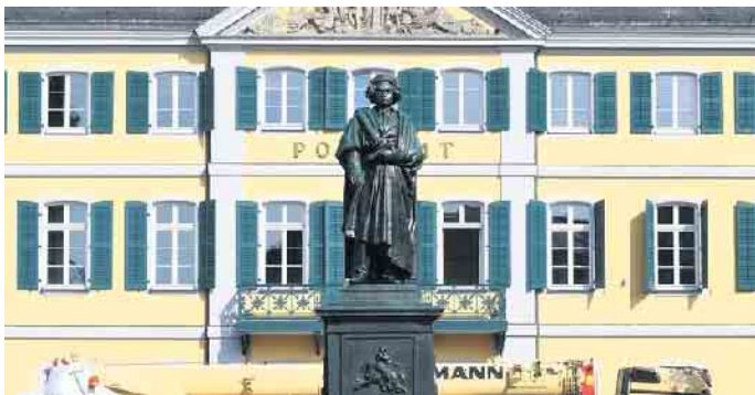
Bonns größter Sohn Ludwig van Beethoven ist wieder zu Hause.

Bonn. Am 12. August 1845 wurde in Bonn aus Anlass des 75. Geburtstages von Ludwig van Beethoven das erste Beethovenfest gefeiert. Im Rahmen des mehrtägigen Festes enthüllte Franz Liszt das berühmte Denkmal des Komponisten auf dem Bonner Münsterplatz. Zum 175. Jahrestag der Einweihung des Denkmals und aus Anlass des 250. Geburtstages des großen Komponisten wollten Bonner Bürgerinnen und Bürger die damalige Szenerie in historischem Ambiente im August 2020 nachstellen. Daraus wurde nichts, da die Corona-Pandemie das öffentliche Leben lahmlegte. Ein neuer Versuch im August 2021 scheiterte aus denselben Gründen. Damit ereilte die Veranstalter ein ähnliches Schicksal wie schon die Initiatoren für das Beethovendenkmal, die 1828 durch eine in Europa grassierende Cholera-Epidemie gestoppt wurden.