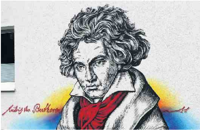
Beethovens Abbild sieht man im ganzen Bonner Stadtgebiet, hier in Oberkassel. Bald wird er auch vermehrt in den Schaufenstern zu sehen sein.