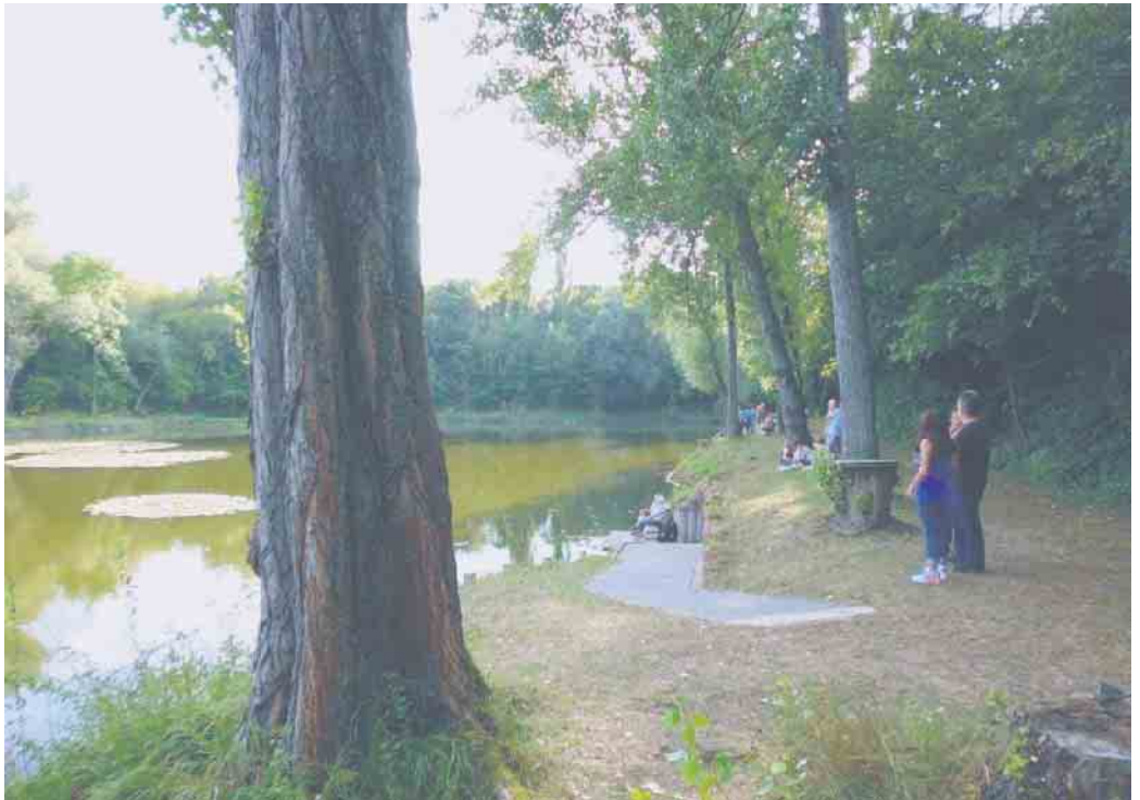
Noch ruht der „Elfgen-See“

Als besonderes Angebot gibt es Wildspezialitäten und räucherwarne Forellen, die direkt vom Räucherofen auf den Tisch kommen. Zudem können die Fische auch vorbestellt werden. Einfach anrufen (0176-7677 8515) oder