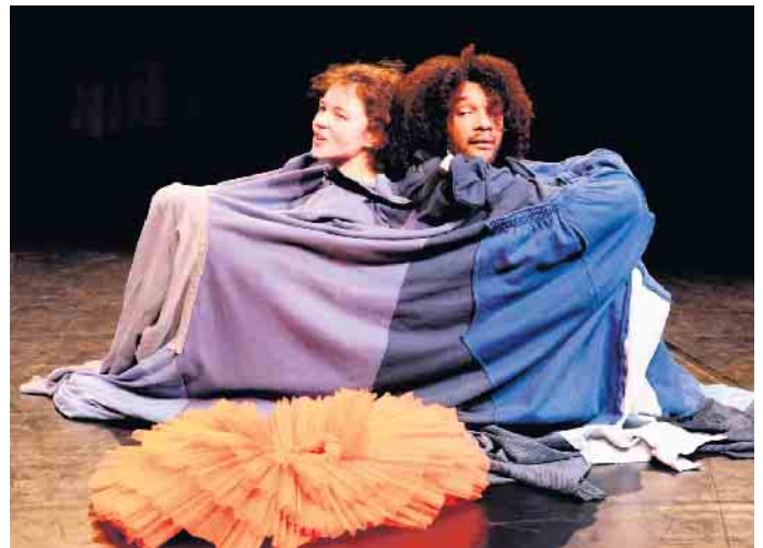
Wer bin ich und wer bist du? Was unterscheidet uns voneinander?

Die nächsten Aufführungen der Inszenierung „Genauso, nur anders“, einer Koproduktion mit dem Theater Bonn aus dem Jahre 2023, finden ab September im Rahmen des Festivals Spielarten NRW statt, für das die Inszenierung ebenfalls von der Jury ausgewählt wurde. Die nächsten Termine in Bonn sind dann im Oktober. Näheres unter: www.theater-marabu.de/stueck/genauso-nur-anders . Darüber hinaus können auch mobile Vorstellungen in Schulen gebucht werden. Anfragen an mail@theater-marabu.de oder portal@bonn.de . wm