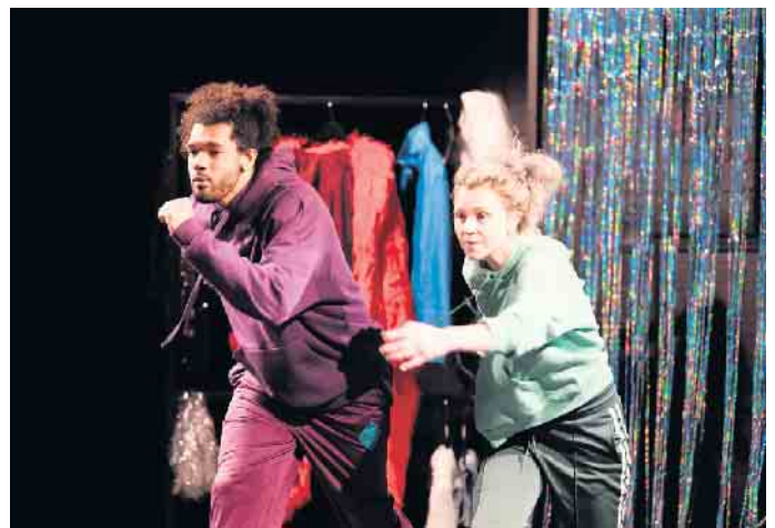
Ein Tänzer und eine Schauspielerin versuchen im spielerischen Wettstreit gesellschaftliche Erwartungen zu überwinden.