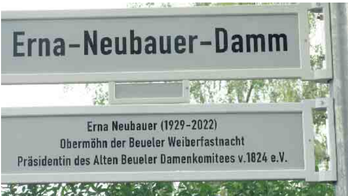
Aussage Patty Burgunder: „Erna und Hans sitzen jetzt auf einer Wolke und sagen „Das habt ihr gut gemacht“.