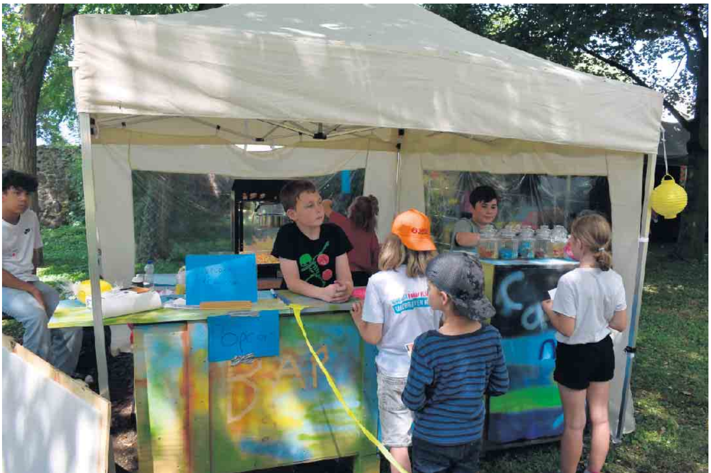
Großer Andrang an der Candybar

Ferienprojekt des Jugendzentrums Haus Michael startet in der ersten Ferienwoche