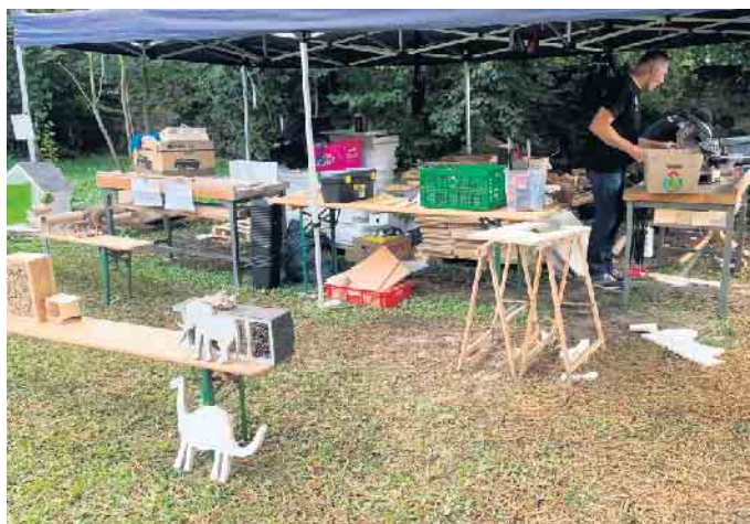
Die Holzwerkstatt in SchwarzKLEINdorf