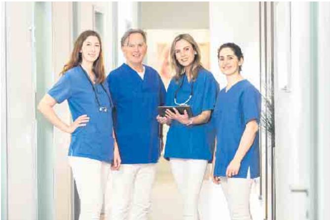
Das Team der dental suite im Kölner Rheinauhafen