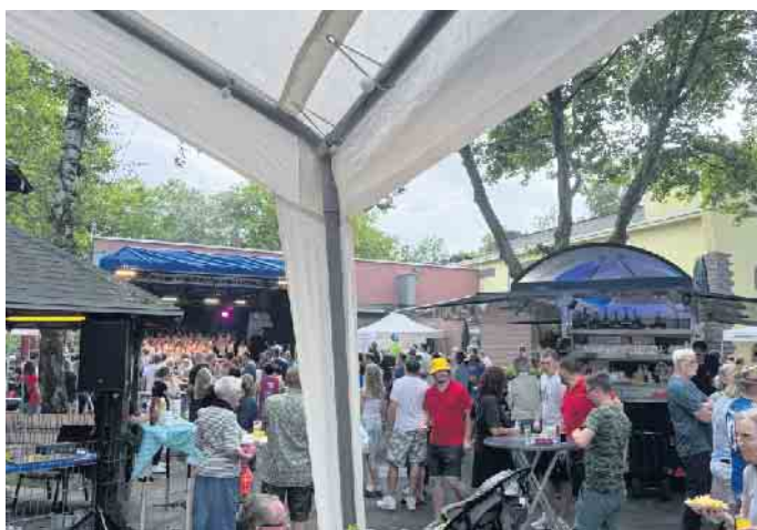
Die Mühlenbachhalle und der Vorplatz sind Heimat für die Vilich-Müldorfer Bürgerschaft.

sucher hatten ihren Spaß. Besonders die Hüpfburg, das Kinderschminken und das Torwandschießen erfreuten sich großer Beliebtheit. Für Hunger und Durst stand ein vielfältiges Angebot an Speisen und Getränken bereit. Der Sonntag begann mit der Heiligen Messe und endete mit einem traditionellen Frühschoppen unter Mitwirkung der Musikschule Rita Niemann, dem Chor des Therapiezentrums Pützchen und den Bunkerbläsern. Die Ortsvereine, der Bürgerverein und die Dorfgemeinschaft freuen sich schon jetzt auf das Dorffest im nächsten Jahr vom 12. bis 14. Juni. wm