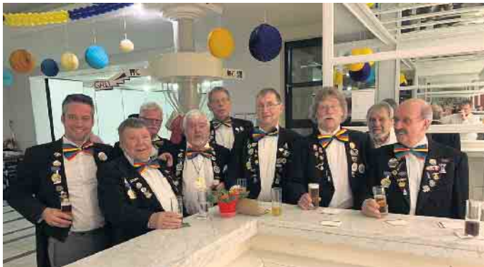
Vor Corona: Die Bottemelech's Jonge nach einem erfolgreichen Auftritt.