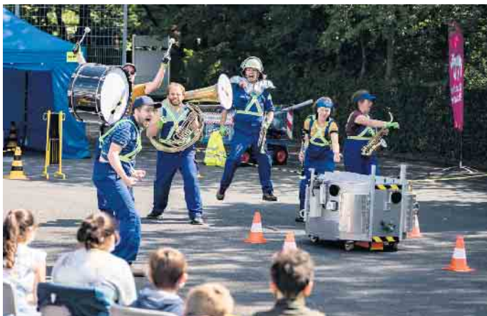
Szenenfoto aus der preisgekrönten Aufführung „Master of Desaster“.

Ein Jury-Hauptpreis des Landes NRW geht an das Beueler Theater