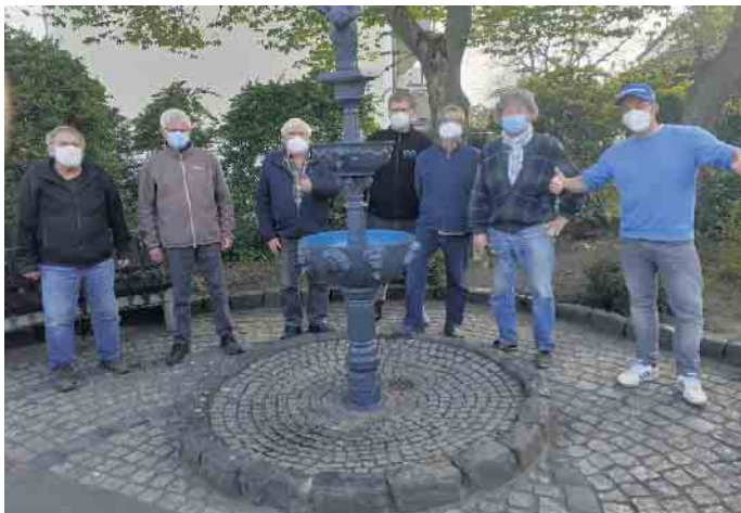
Corona: Pflegearbeiten am Bottemelch's Brunnen müssen sein.