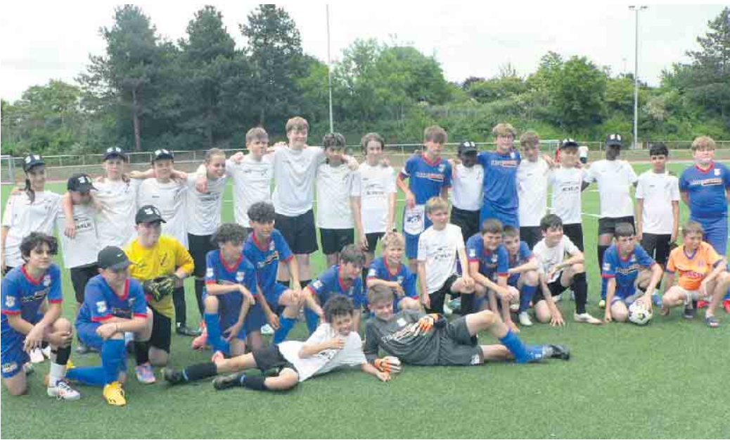
Deutsch-Französische U13 Freundschaft zwischen Mirecourt (blau) und Schwarzrheindorf.