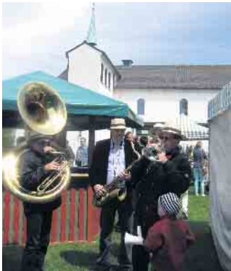
Buntes Treiben auf dem Kirchplatz von Christ König in Holzlar

schungsprogramm bis 17 Uhr ein großes Angebot an Speisen und Getränken sowie Spaß und Spiel für die ganze Familie. Die Büche- rei veranstaltet einen Bücher- und CD-Flohmarkt. Alle Angebote, Speisen und alkoholfreien Geträn- ke sind auf Spendenbasis. Der Er- lös wird zwischen der Partnerge- meinde in Brasilien und dem Pfarr- verein geteilt.