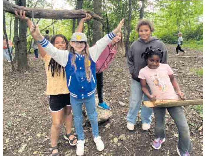
Im angrenzenden Waldstück konnten die Kinder ausgiebig spielen

Der Beueler Judo-Club fuhr auch in diesem Jahr mit den Kindern und Jugendlichen in seine traditionelles Pfingstfreizeit. Für insgesamt 125 Teilnehmer zwischen 6 und 18 Jahre ging es in die Jugendherberge nach Lindlar. Dort erwartete die Kids ein buntes Programm aus Sport, Spiel- und Bastelaktionen. Natürlich durfte auch die legendäre Talentshow gefolgt von einer Nachtwan-