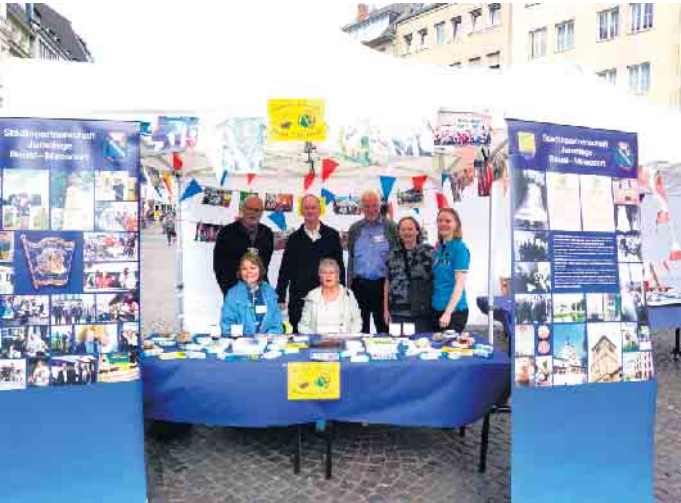
Der Stand des Partnerschaftskomitees beim Europatag auf dem Bonner Marktplatz.

Zweiten Weltkrieges durchgeführt, bei der am Mirecourtplatz die Flaggen gehisst wurden, nachdem zwei Schülerinnen des Ernst-Kalkuhl-Gymnasiums berührende Worte über ihr Verhältnis zu Frankreich sagten. Am Europatag auf dem Bonner Marktplatz war die Städtepartnerschaft ebenfalls vertreten, wo zahlreiche Mitglieder des Komitees den Stand betreuten und dabei in vielen Gesprächen über die sehr lebendige Städtepartnerschaft erzählen konnten. wm