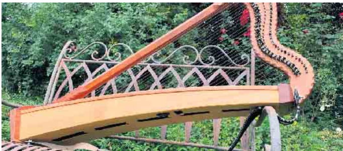
Harfenklänge zu biblischen Traumgeschichten