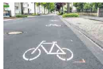
Achtung Radfahrer: Fahrradpiktogramme auf der Pützchens Chaussee sollten aus Sicherheitsgründen mittig überfahren werden.

Auf der Pützchens Chaussee werden diese Piktogrammketten zum ersten Mal im Bonner Stadtgebiet eingesetzt. Die Stadtverwaltung weist darauf hin, dass es sich dabei um eine Kompromisslösung handelt. Auch das NRW-Verkehrsministerium hat explizit darauf hingewiesen, dass „durch die Aufbringung von Piktogrammketten eine zur nachhaltigen Sicherung des Radverkehrs separate Radverkehrsführung keinesfalls ersetzt oder deren Herstellung verzögert wird. Dies gilt insbesondere für Hauptverkehrsstraßen, bei denen stets auf eine räumliche Tren-